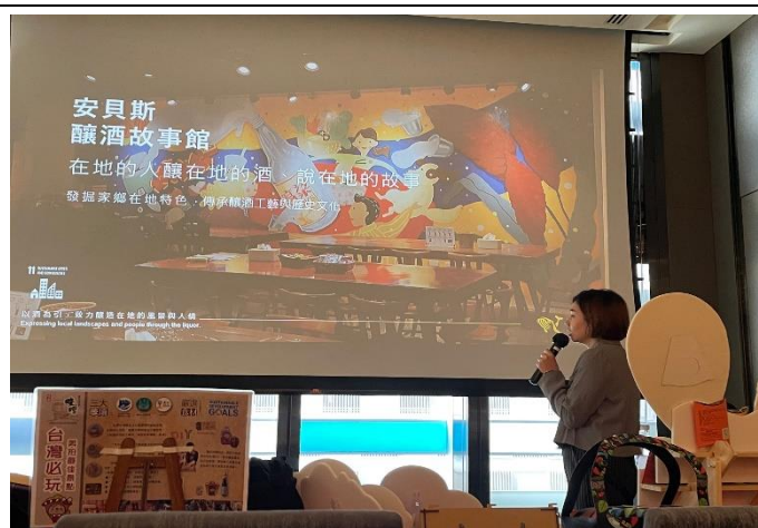
臺中業者簡報 (臺中觀光推廣會)