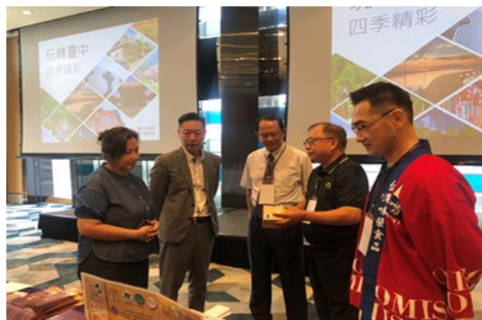
與新加坡出境旅遊業者交流 (臺中觀光推廣會)