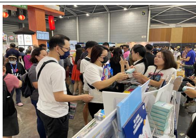
向民眾說明臺中旅遊資訊