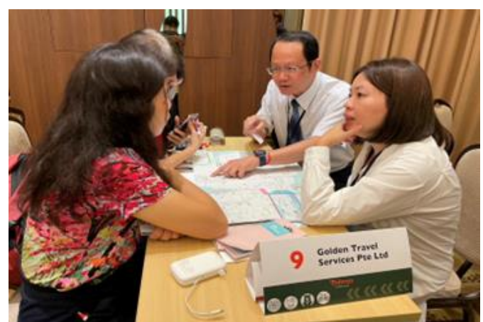
向新加坡業者推廣情形 (臺灣觀光推廣會)