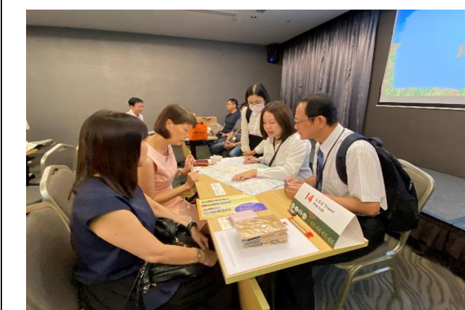
向新加坡業者推廣情形 (臺灣觀光推廣會)