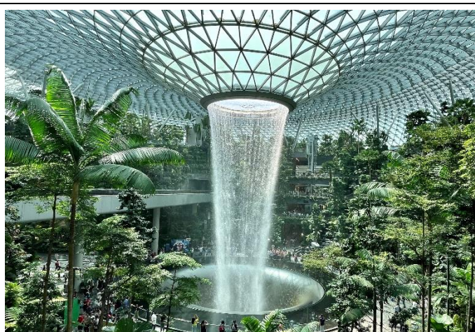
樟宜機場參觀全世界最大的室內瀑布 「雨漩渦」高達高達40公尺