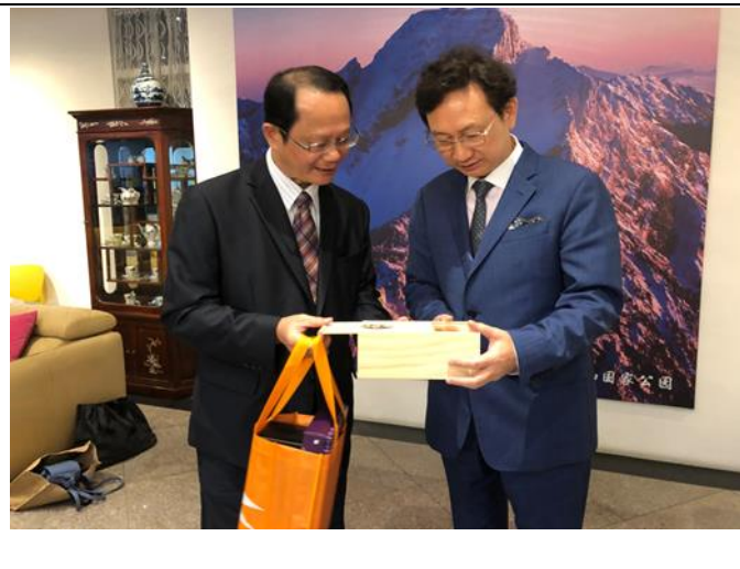
拜會童振源大使致贈茶葉伴手禮