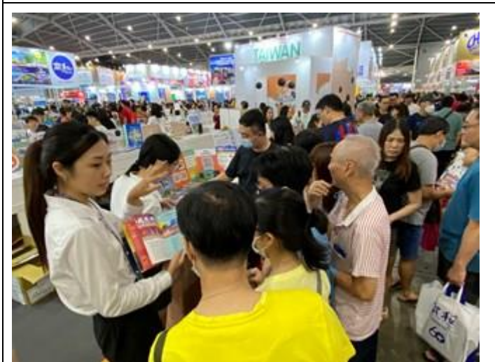
臺中攤位人潮不斷