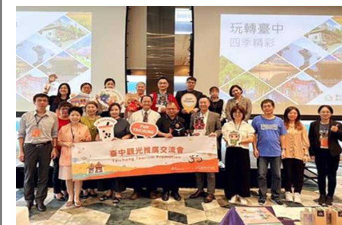
與新加坡出境旅遊業者交流 (臺中觀光推廣會)