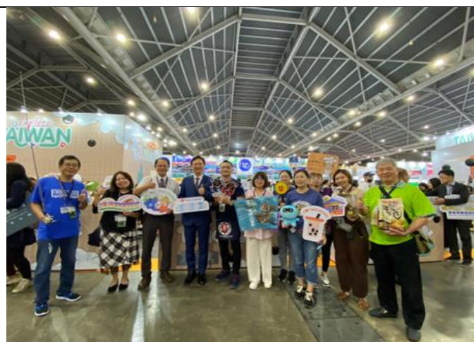
臺中業者與童振源大使合影