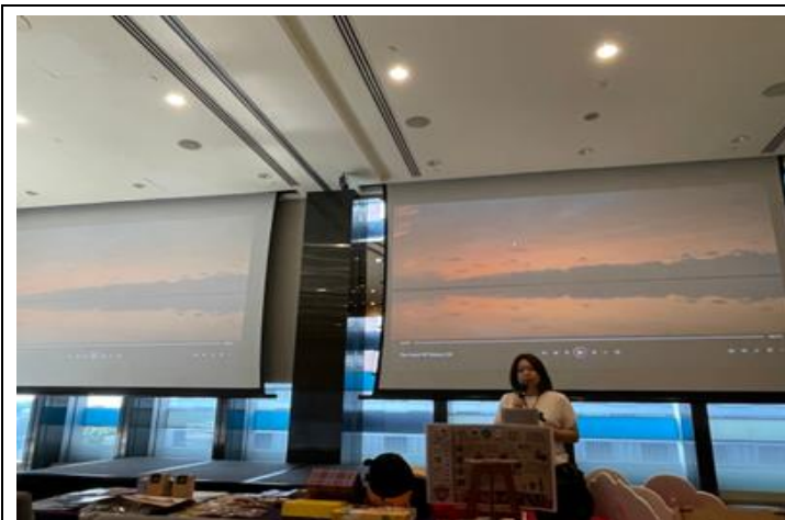
臺中觀光資源推廣簡報 (臺中觀光推廣會)