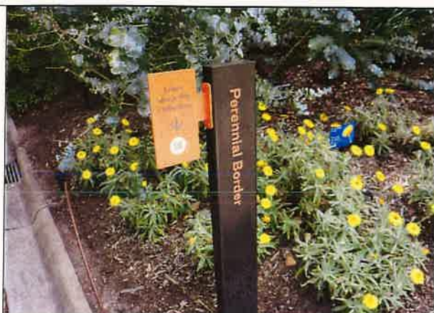
圖十三：植物園一隅