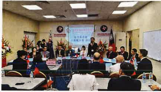
圖三：全球台灣客家聯合總會成立大會，江主委致詞