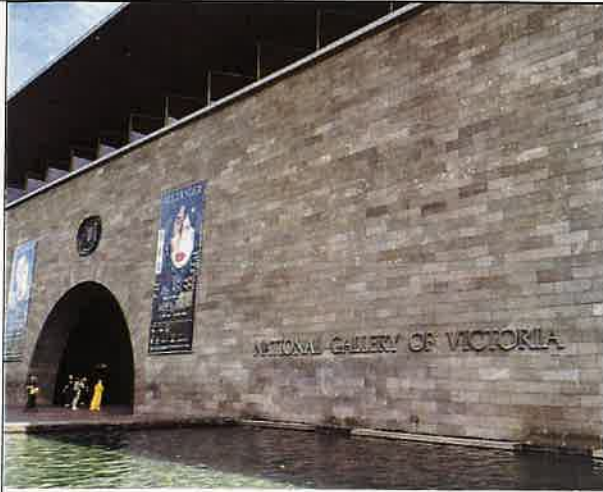
圖七：美術館外部池水