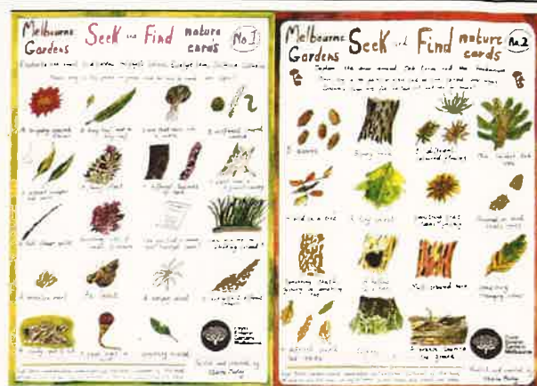
圖十四：植物園圖繪