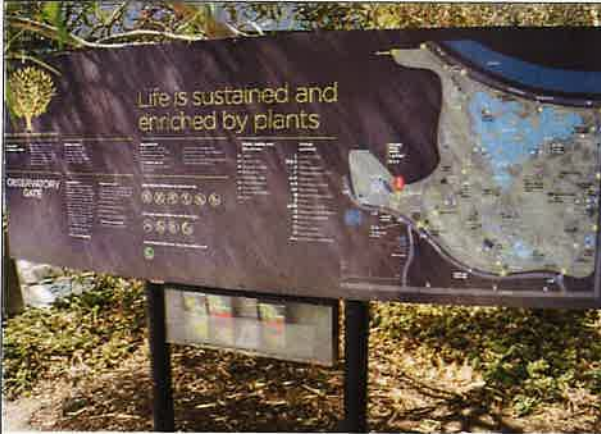
圖九：植物園告示牌