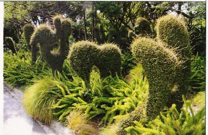
圖十：植物園多樣種類種植