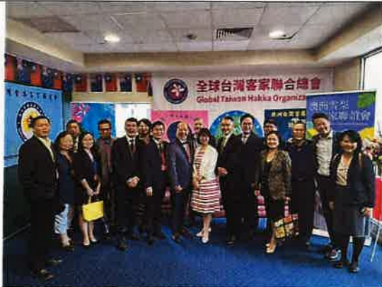
圖五：全球台灣客家聯合總會成立大會來賓合影