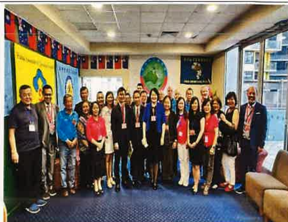
圖二：江主委於大洋洲客屬總會交接典禮與現場與會人員合影