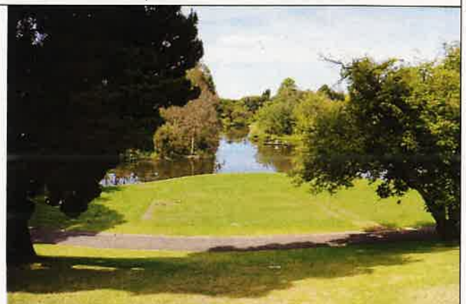
圖十二：植物園一隅