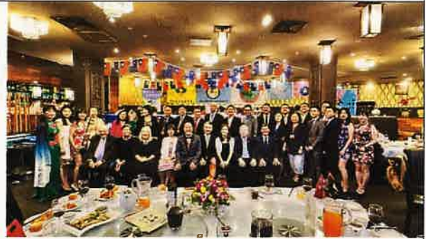
圖六：江主委與全球台灣客家聯合總會成立晚宴與來賓及澳大利亞國會議員合影