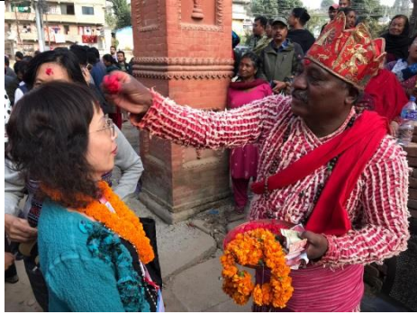
市民歡迎各與會城市代表，以當地文化信仰硃砂點 Tika 為與會者祈願