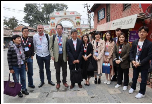
我國、韓國、馬來西亞等與會城市代表實地參訪拉利特普爾市