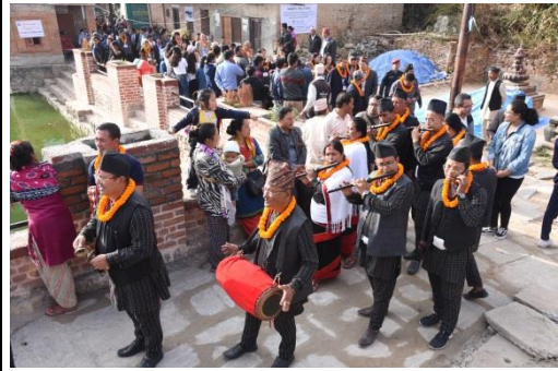
市民演奏傳統樂器，並陪同各與會城市代表實地參訪布加馬堤村鎮