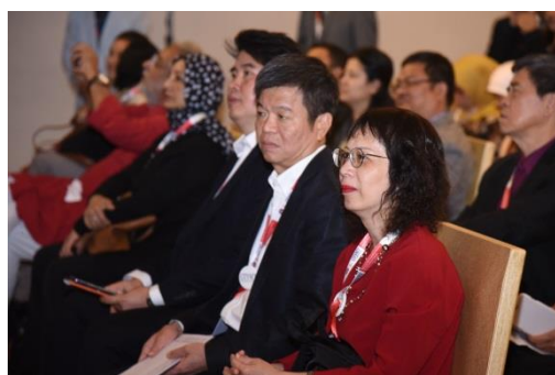
代表團出席第 38 屆執行委員會議

月 23 日至 25 日於韓國濟州島(Jeju, Korea)舉辦，並邀請會員踴躍出席。