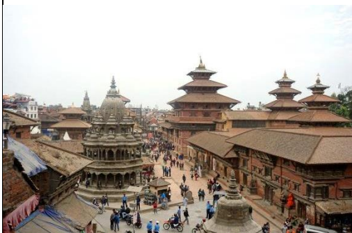
世界文化遺產—帕坦古城