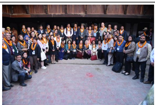
實地參訪布加馬堤(Bungamati)村鎮

下午實地參訪位於市郊的布加馬堤(Bungamati)村鎮，該地區同受 2015 年尼泊爾強震影響，有多處建築物受損。當地雖非典型觀光地區或都會區，然居民面對國際訪客仍展現親切與友善的態度。代表團到訪時，村鎮居民皆前來歡迎，全程陪同實地參訪，並展現該地傳統樂器、宗教及文化禮俗。