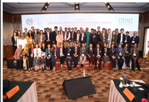
第 38 屆執行委員會議與會城市代表全體合影