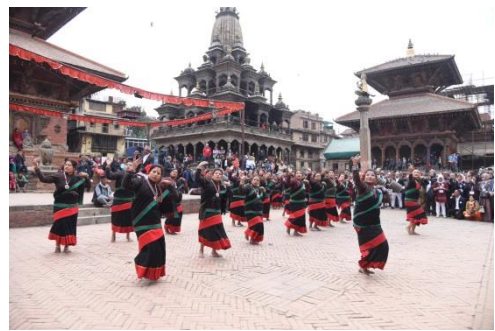
作為歷史記憶與現代文化生活共存之市民活動空間的帕坦古城