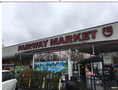
維多利亞島上之地區型超市 (fairwaymarket)