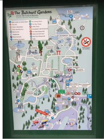
Butchart Gardens(布查德花園)導覽圖