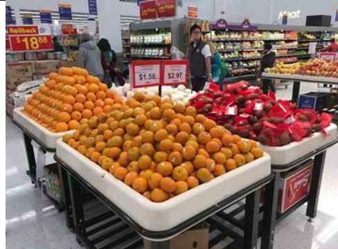
Walmart農產品銷售區一隅