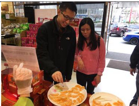
2月3日於國華超市舉辦椪柑行銷品嘗活動