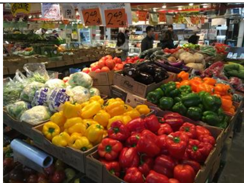
Granville island公眾市場販售農產品