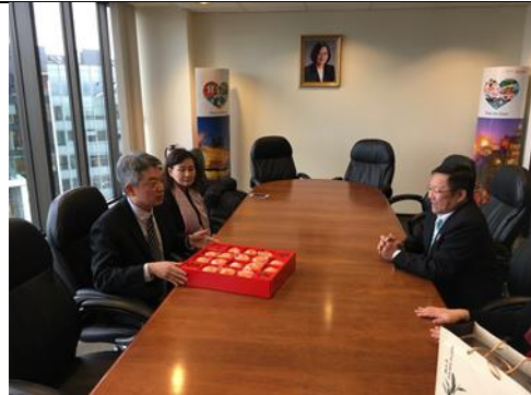
王局長俊雄與溫哥華台灣貿易中心張主任如蕙及駐溫哥華台北經濟文化辦事處李處長志強雙方交流農產品行銷經驗