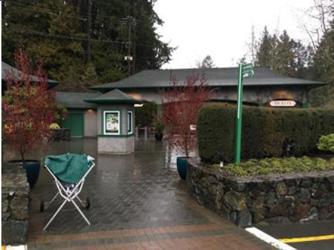
Butchart Gardens(布查德花園)入園門口