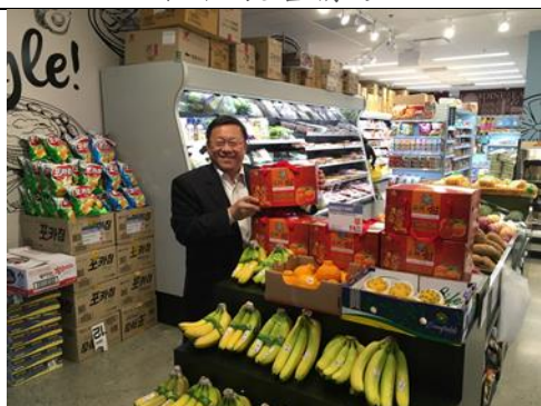
英屬哥倫比亞大學 (UBC)校園內之Hmart 極柑展售情形