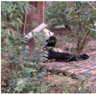
參觀成都大熊貓繁育研究基地