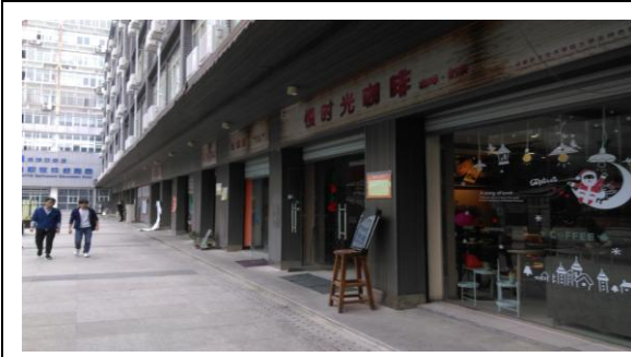
大陸學生創業實習商店