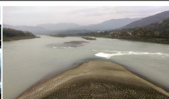
參觀都江堰水利工程