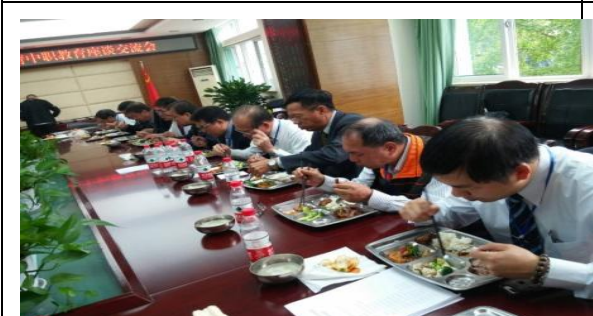
特殊教育學校享用學生午餐伙食