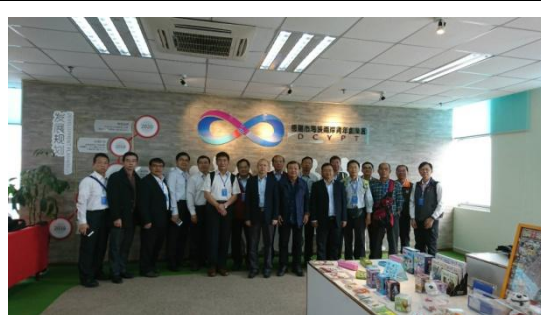
德陽市海峽兩岸青年創業基地