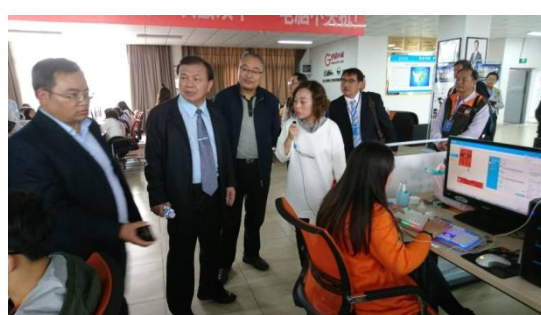
中職學校_商科學生實習現況