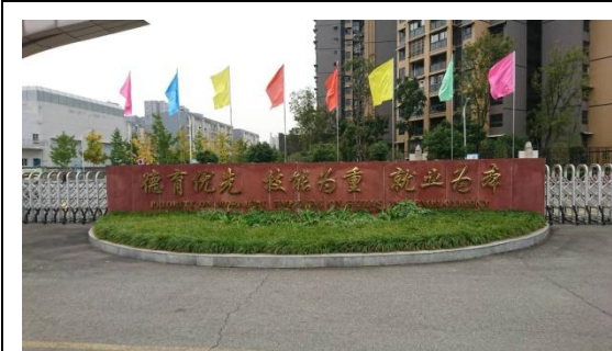
參訪德陽黃許職業中等學校