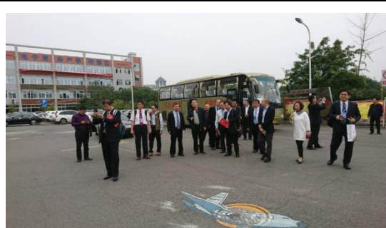
參觀四川省商貿學校校園