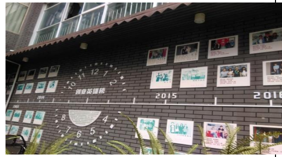
大陸學生創業英雄榜