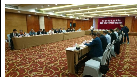
川臺高中職教育交流座談會