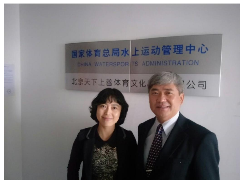
拜會中國國加體育總局水上運動管理中心