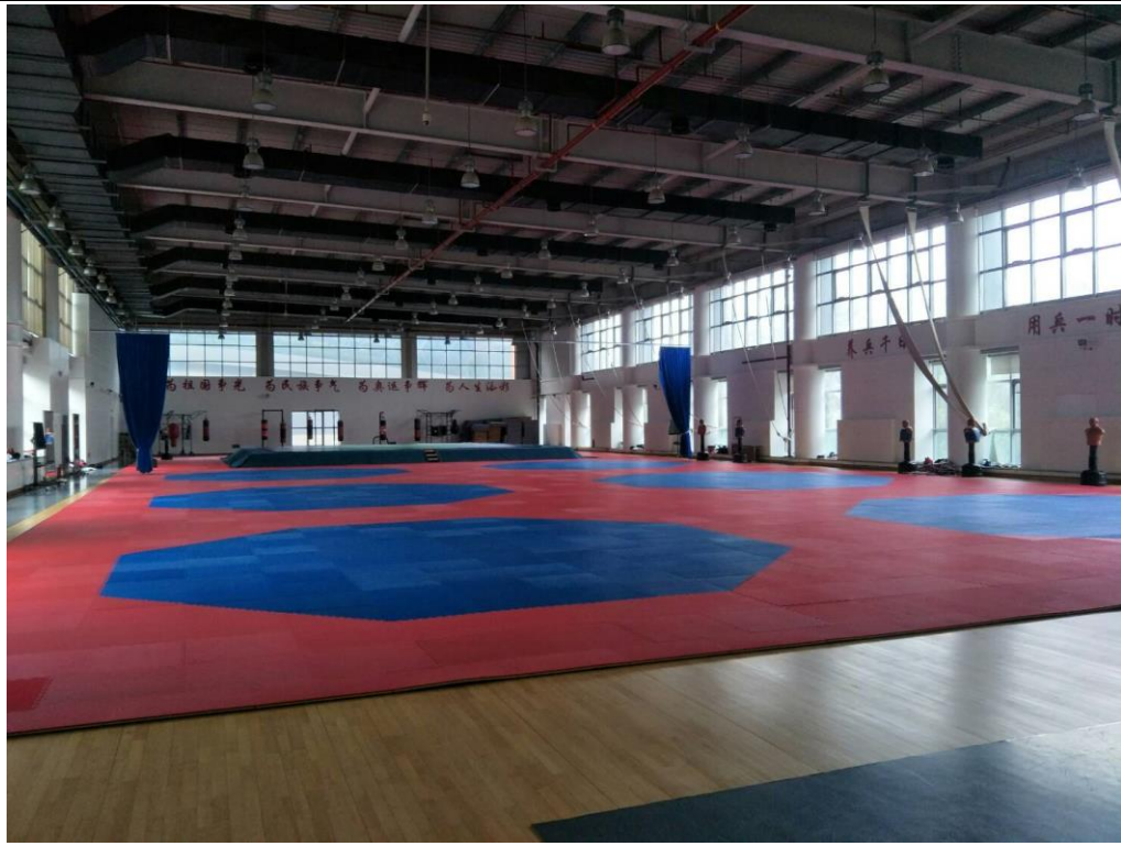
北京體育大學柔道訓練場地