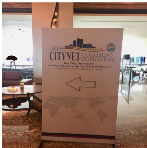
2017 城市聯絡網 30 周年大會