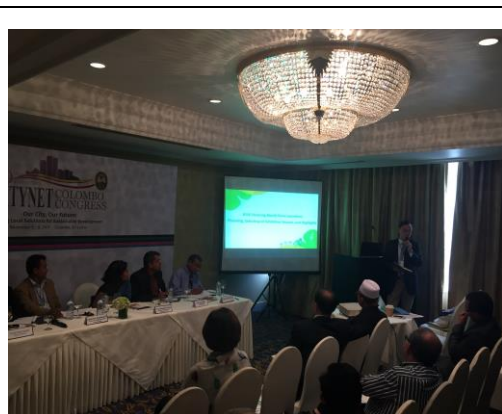
本市於第 9 場平行會議中發表演說