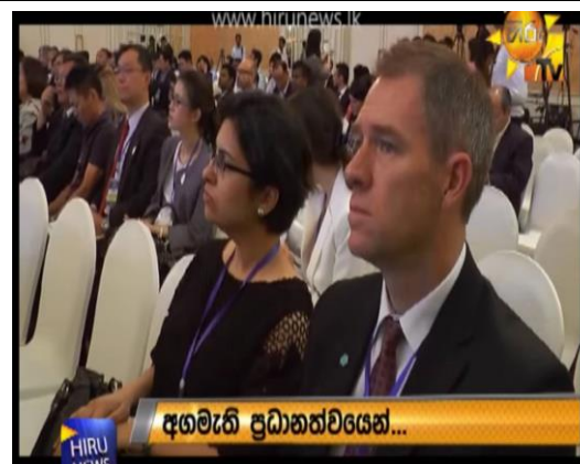
臺灣 3 城市 (臺北市、臺中市及高雄市) 出席開幕式登上當地新聞