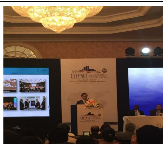
城市聯絡網主席暨韓國首爾市長 Mr. Park Won-Soon