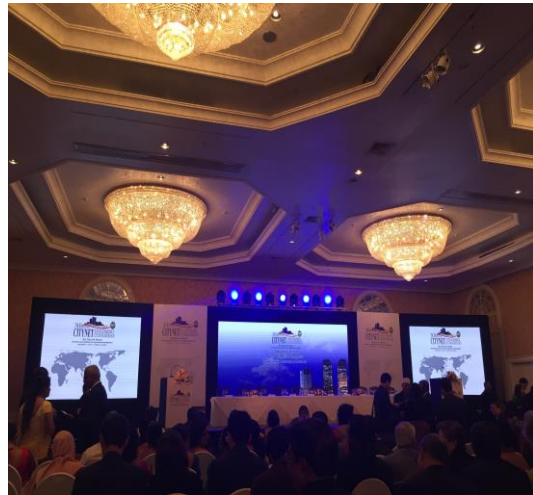
2017 城市聯絡網 30 周年大會