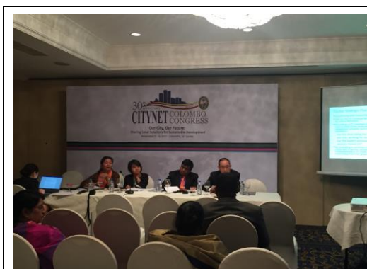
「氣候變遷」小組會議

城市聯絡網依會員城市專長或感興趣領域，另設小組系統，計有「氣候變遷」、「災害」、「基礎建設」及「永續發展目標」等 4 組，小組系統每 4 年進行檢討及系統調整，亦歡迎會員重新選擇加入組別。本市目前加入之「氣候變遷小組」(Climate Change Cluster)，由印尼雅加達擔任小組主持人，不定期辦理本小組研討會及各式防災培訓課程。