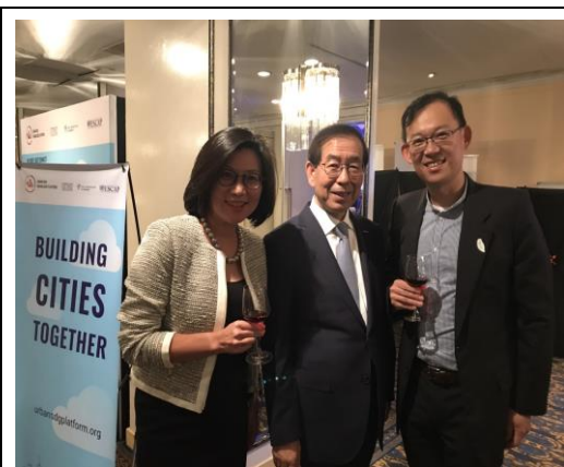
韓國首爾市長 Mr. Park Won-Soon

(一) 代表團於全體會員大會後，親向韓國首爾市長 Mr. Park Won-Soon 道賀成功連任下 (2018-2021 年) 屆主席，並向渠等介紹本市即將主辦之「2018 臺中世界花卉博覽會」，歡迎韓國首爾市參加，Mr. Park Won-Soon 市長亦邀請本市及臺灣其他會員城市與城市聯絡網秘書長、副主席及秘書處主管一同會談，感謝本市及臺灣其他會員城市對其及城市聯絡網之支持，期盼本市未來能多參與組織活動。