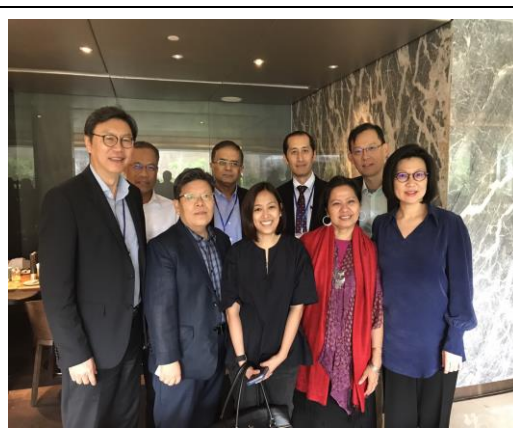
城市聯絡網主席、副主席、秘書長及秘書處主管與臺灣會員城市代表合照