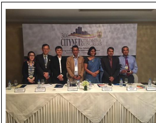
第 9 場平行會議講者大合照

本市於「聯合國人居署：亞太地區城市永續發展之參與式公共空間規劃」(UN-Habitat: Participatory public space planning for sustainable urban development in Asia Pacific) 場次中發表演說，以「2018 臺中市界花卉博覽會」為例說明本市公共空間之規劃與永續發展，藉此宣傳臺中花博會活動，期各城市踴躍參與盛會，獲與會代表熱烈回應，並對於本市藉由舉辦重大國際活動契機，整合城市公共空間規劃表達敬佩及認同之意。