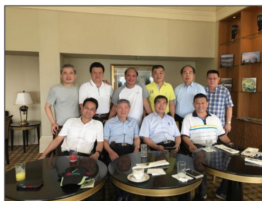
張副市長與當地臺商及印尼產業界 人士合影