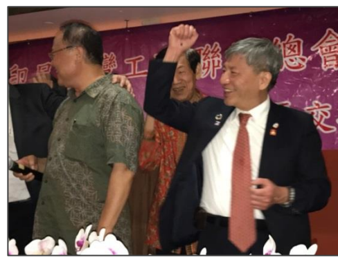
張副市長與出席臺商會員熱絡互動