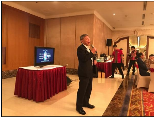
張副市長向印尼臺商介紹本市投資環境