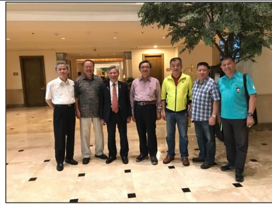
張副市長與臺商合影