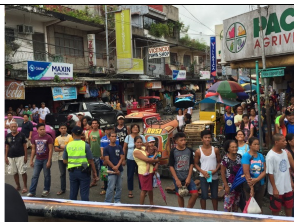
民眾沿街歡迎遊行車隊