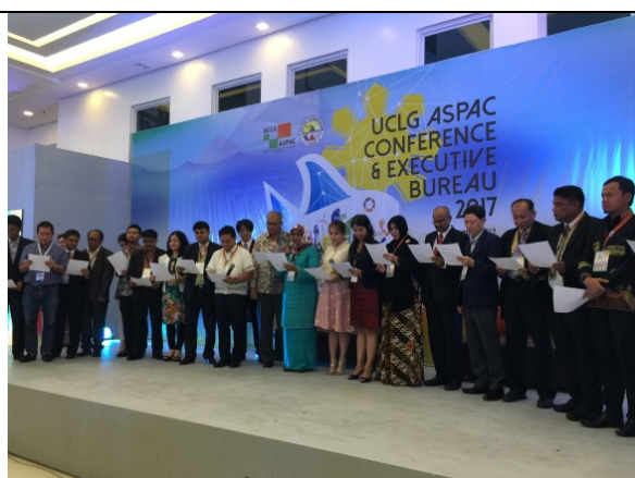
亞太分會主席 Mr. Won Hee-ryong 亞太會議會後宣讀「卡巴洛甘宣言」