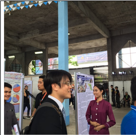
參觀旅遊及經貿資訊展與科技展

(五)「旅遊及經貿資訊展」(Travel and Trade Fair)及「科技展」(Science & Technology Fair)：會議期間薩馬省 (Samar Province) 舉辦各城市旅遊及經貿資訊展，展場中各城市以動態及靜態方式呈現城市特色及物產，薩馬大學 (Samar State University, SSU) 主辦的科技展中則展示科技成果及學生作品。