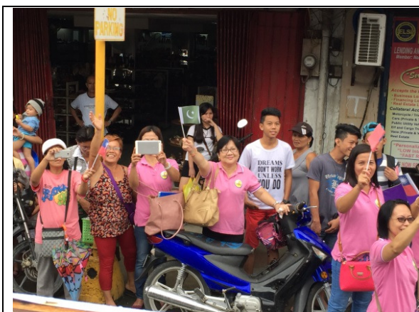
民眾手持各國國旗歡迎遊行車隊

本次會議係首次於薩馬省 (Samar province) 首都卡巴洛甘，亦是首次於東維薩亞群島 (Eastern Visayas) 舉辦之國際會議，主辦城市為表示歡迎，特安排與會代表們以車隊遊行方式繞行市區，當日雖天候狀況不佳，偶飄細雨，民眾仍不減熱情夾道歡迎並揮舞各國國旗，與會代表莫不留下深刻印象，而我國國旗亦出現於人群中。