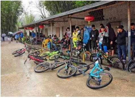
部分選手在洗手間外躲雨