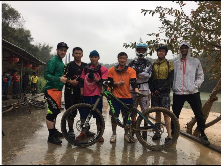
這次比賽菁英組還邀請到來自法國，澳洲，加拿大，和巴西的選手參賽。