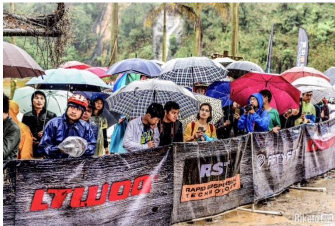
雖然下著大雨觀眾扔撐傘替選手加油打氣