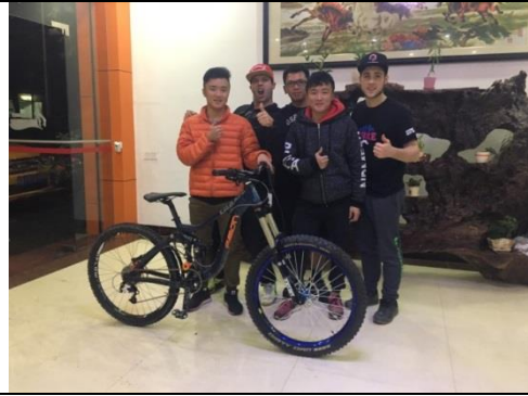
與同住一個賓館的法國選手合照