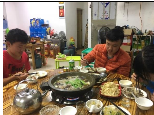
在廣州的最後一個晚餐