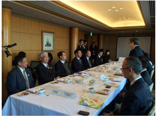
拜會橫濱副市長渡邊巧教