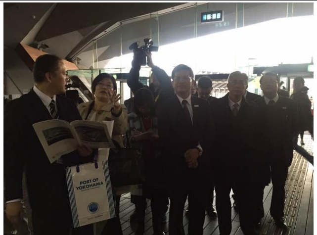
參訪大棧橋郵輪碼頭