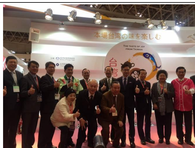
「東京國際食品展」臺灣館開幕致詞及全體合照