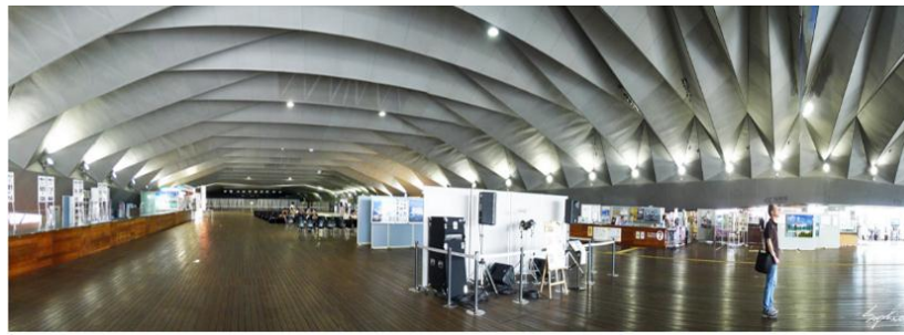
2F 售票候船處 行李寄放 諮詢