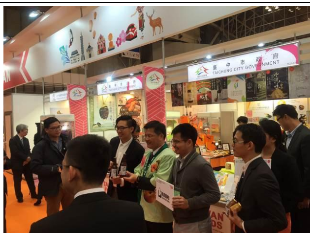
至臺中市攤位接受媒體採訪