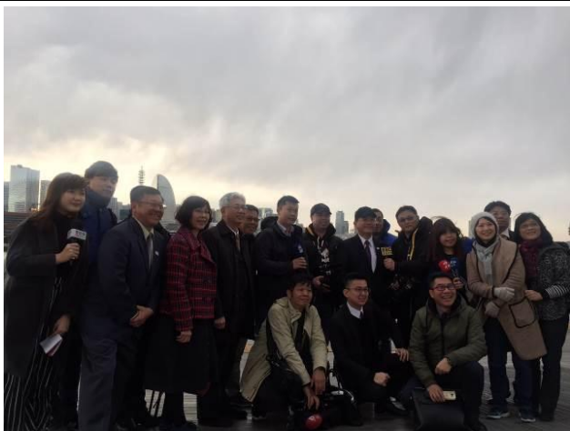
參訪大棧橋郵輪碼頭