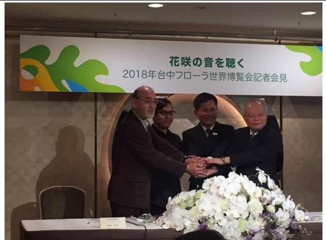
2018臺中世界花卉博覽會記者會