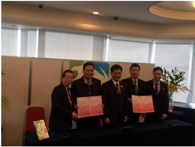
臺中市文心蘭、百合外銷日本兩地經銷商簽署合作備忘錄