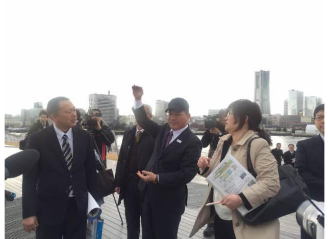
參訪大棧橋郵輪碼頭