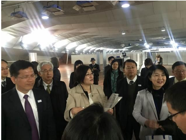
參訪大棧橋郵輪碼頭