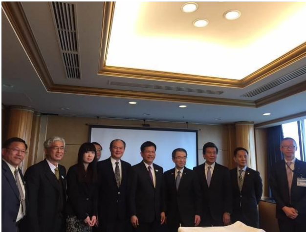
拜會橫濱副市長渡邊巧教