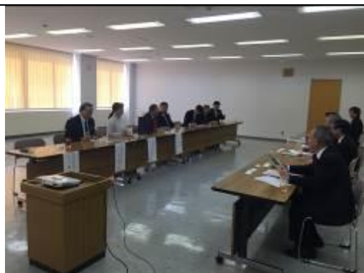
圖 3、訪問秩父別町市役所