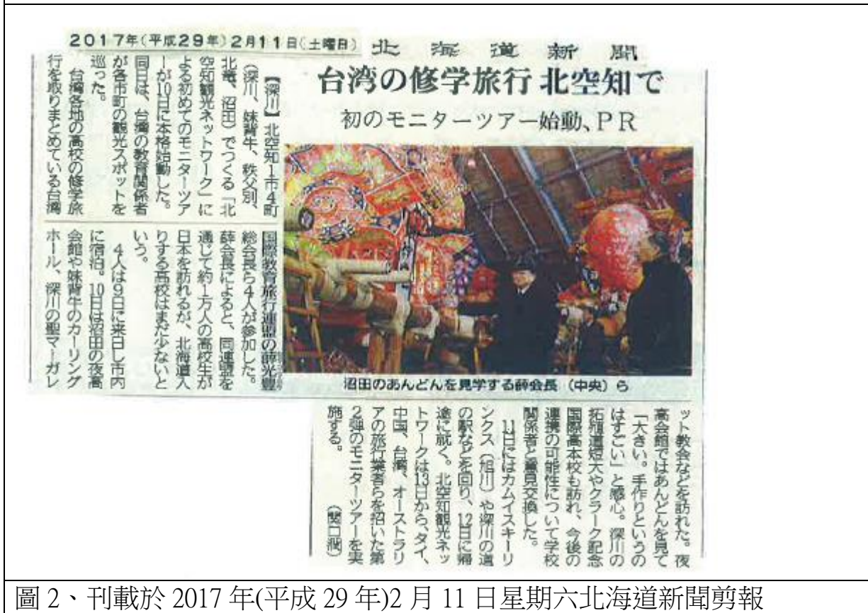
圖 2、刊載於 2017 年(平成 29 年)2 月 11 日星期六北海道新聞剪報