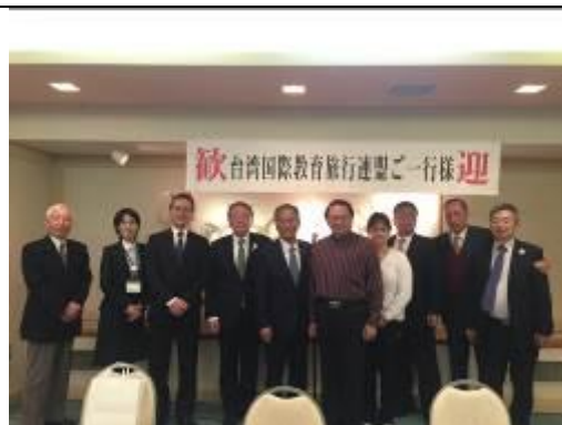
圖 2、歡迎晚宴全員留影