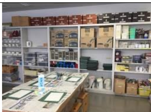
圖 27、北海道立青年體驗活動支援設施可體驗活動