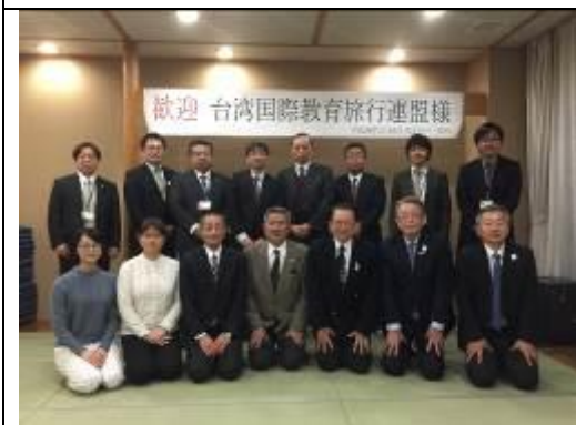
圖 21、與北龍町相關人員合影