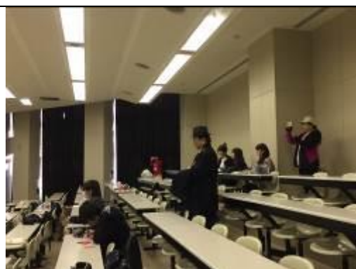
圖 10、了解拓殖大學深川市短期大學部學生上課情形