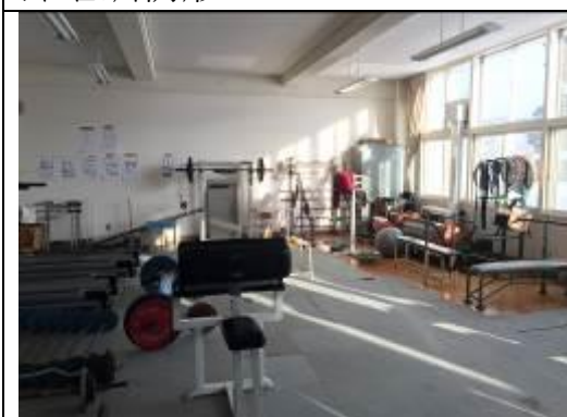
圖 15、野球部校區內設置的健身設備