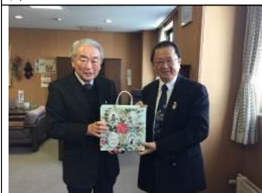
圖 11、感謝拓殖大學深川市學部接待交流