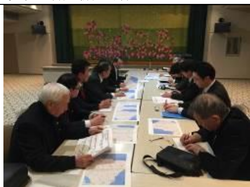
圖 29、意見交換會情形