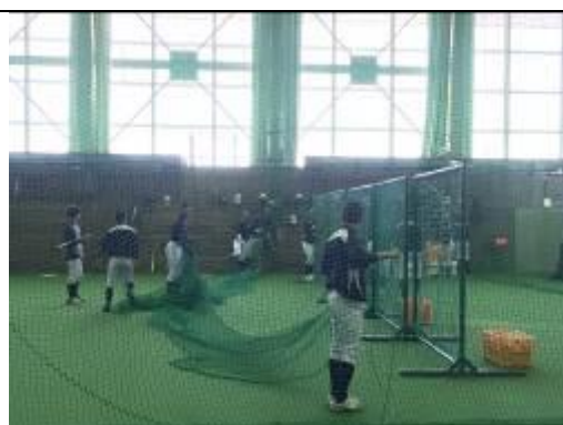
圖 14、Clark 紀念國際高校野球部培訓情形