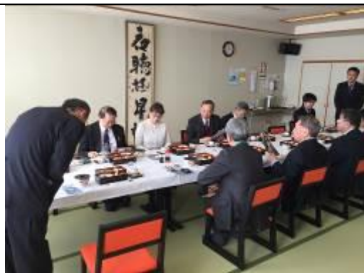
圖 7、與妹背牛町相關人員交流餐會