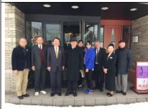
圖 23、與深川市長交流後留影