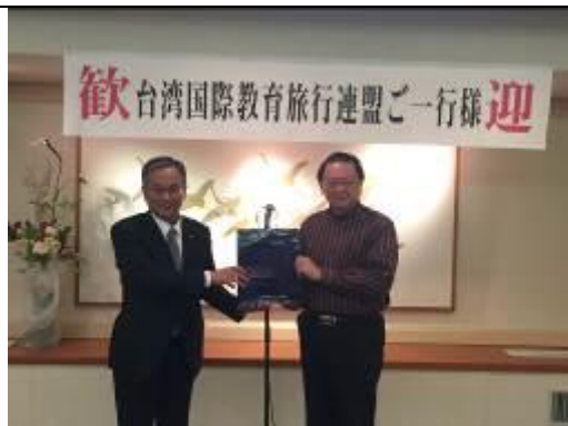
圖 1、與經濟・地域振興次長伊藤久人先生交換交流紀念品後留影