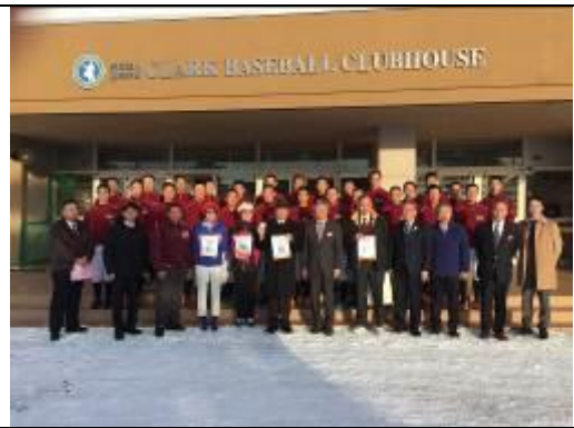
圖 18、參訪 Clark 紀念國際高校後留影