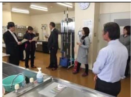
圖 24、參訪 AGURI 工坊 MAABU 設施