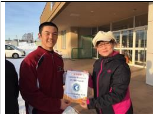
圖 17、野球部學生致贈交流紀念錦旗