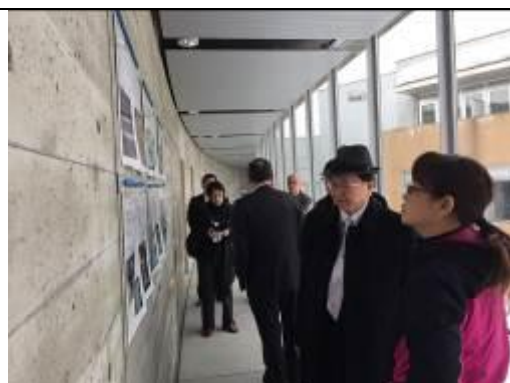
圖 26、了解北海道立青年體驗活動設施