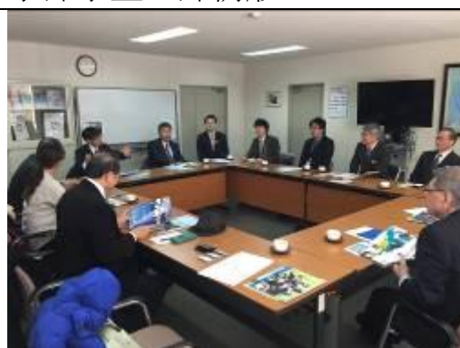
圖 12、訪問 Clark 紀念國際高等學校