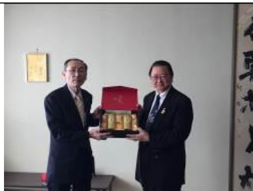
圖 8、與妹背牛町寺崎一郎町長交流合影