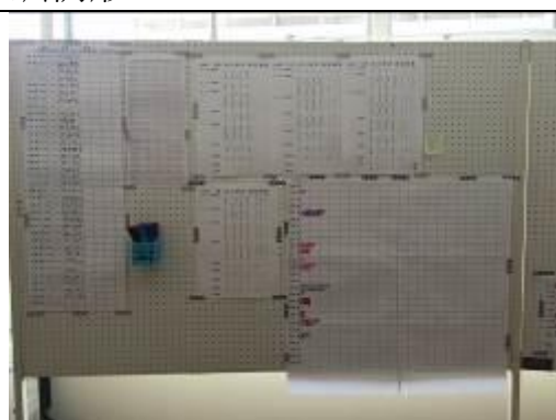
圖 16、校方嚴格把關野球部學生的體能與健康狀況