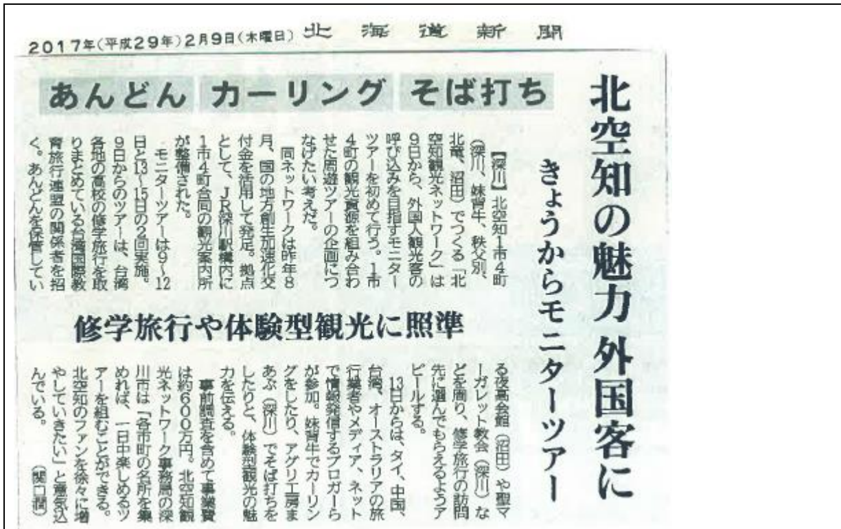
圖 1、刊載於 2017 年(平成 29 年)2 月 9 日星期四北海道新聞剪報