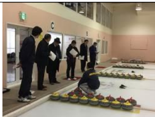
圖 6、參訪妹背牛町冰壺場