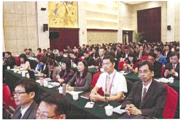
臺中市校長認真參與峰會報告 2