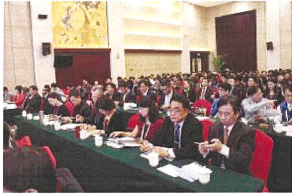
臺中市校長認真參與峰會報告 1