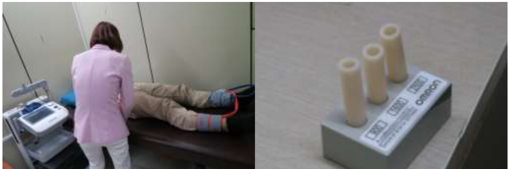
圖六 體適能檢測及衛教道具

原州市運動醫學中心是個具備多功能的機構，它有研究中心可以幫原州市民做體適能的測量，包括運動能力，手眼協調等。也可以測量四肢血壓，了解血管硬化的程度。圖六是個有趣的衛教道具，三個塑膠管分別模擬不同硬化程度的血管，可以用手去感受健康血管與硬化的血管彈性上的明顯差別。原州市運動醫學中心除了研究的功能，它也是個運動中心，提供多種運動設備供原州市民使用，包括游泳池、籃球場、健身房等，也提供了各式各樣的運動課程，供市民參加。