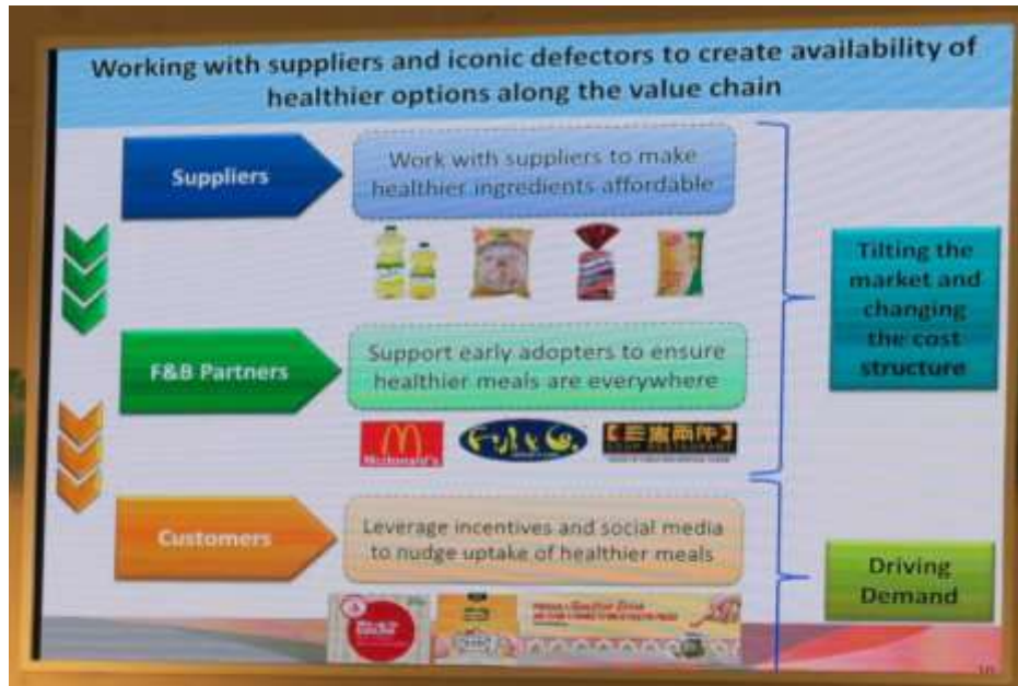
圖一 新加坡食品健康城市簡報

肥胖人口增加，垃圾食物充斥是現代文明社會常見的問題，新加坡從三方面著手來解決這個問題。最上游的食品原料供應，政府與業者合作，提供獎勵讓健康食品原料能更容易為一般大眾取得。政府也與大型餐飲業者合作，鼓勵他們推出健康餐點，讓一般民眾即便是到速食店用餐，依然能選擇比較健康的食物。後端則是消費者的教育，透過社群媒體的宣傳，讓民眾能時常接收到食品健康的資訊，無形中便能讓這些觀念深植人心。