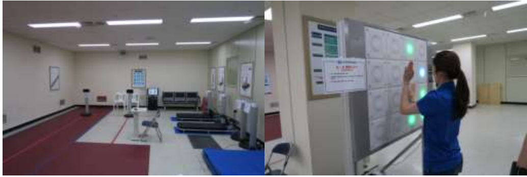
圖五 體適能檢測區