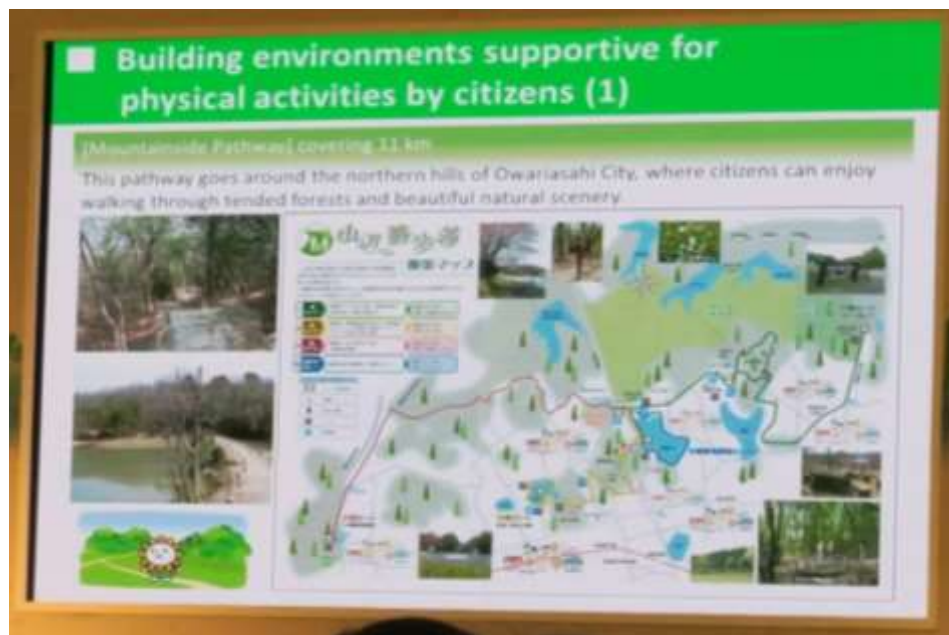
圖二 日本尾張旭市健康運動城市簡報