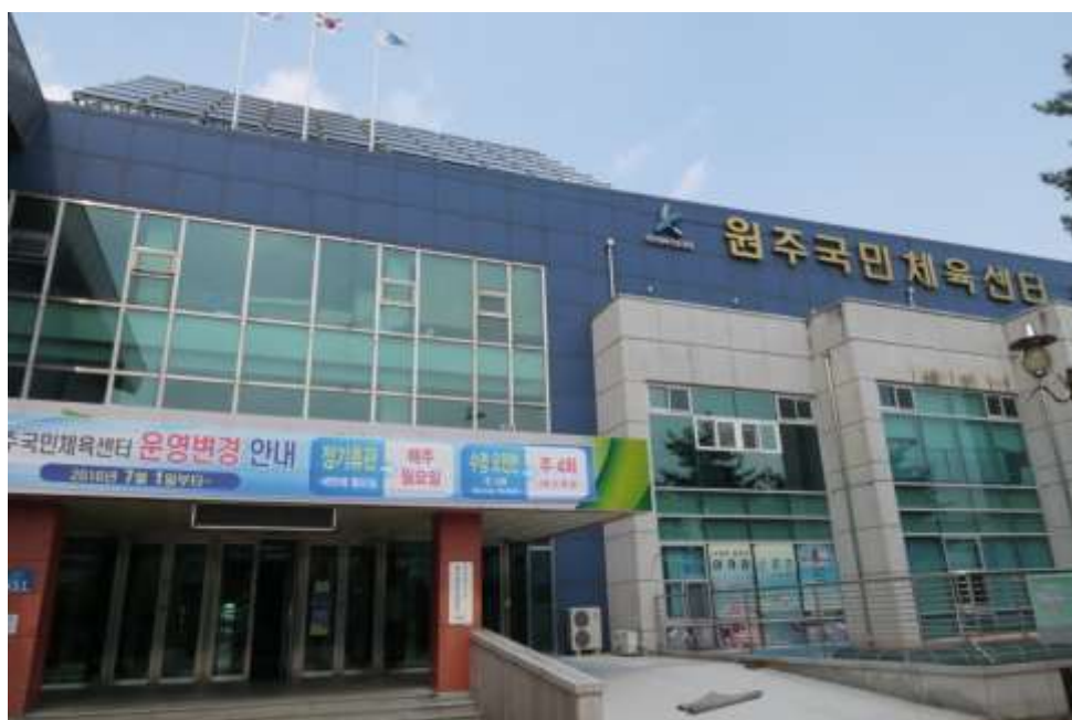
圖四 原州市運動醫學中心