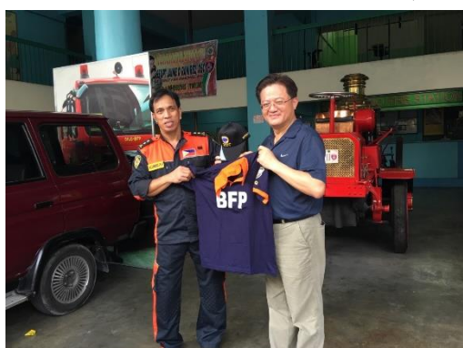
圖 4 馬尼拉第7消防站紀念品交換