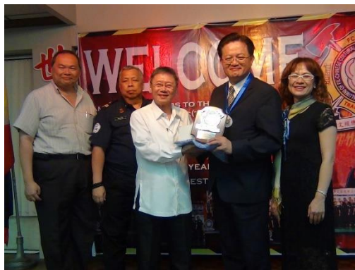
圖 6 FCCEA 致送紀念牌