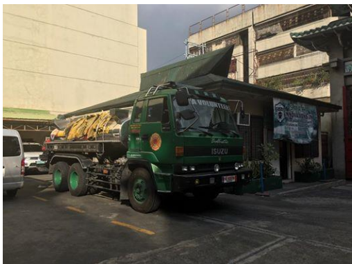
圖 1 防火會自備綠色改裝消防車

馬尼拉政府則設有12個消防站、各置放1部消防車待命出動，火災事故往往都是先由各地防火會指揮中心透過無線電調派防火會消防車與成員出動救災，再接續由官方消防力量進入救援。在參訪馬尼拉第7消防站時，便發現有一部臺灣10年前捐贈的消防車，目前還在該分隊服勤，不過該消防站接待消防同仁也強調，菲律賓政府已規劃新購置80餘部消防車，期能強化菲律賓官方火災救援能力。此外該消防站同仁詢問，有無併同菲華防火會前來消防署訓練中心機會，以期有機會也能增進官方消防救災能量。