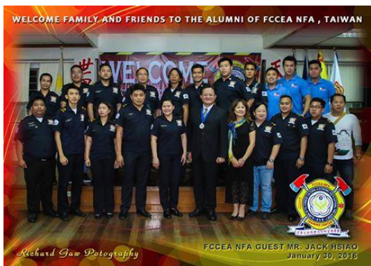
圖 5 105 年即將來台受進階訓學員

至去（104）年已完成 6 梯次訓練，合計已有 192 名各地菲華青年接受我國的救災訓練協助，乃至進一步成立「菲華文經總會消防研習營同學會，Alumni of FCCEA National Fire Agency of Taiwan」，也因為此一機緣，讓各地原本互不相識的防火會成員，得以串連在一起、講共同的救災用語、有更多的救災技術、一旦在火場相遇得以相互支援合作，有默契且順利地安全完成救災任務與使命。