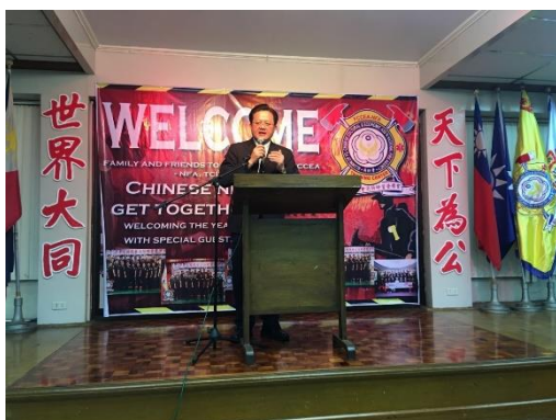
圖 7 FCCEA 新春聯誼餐會致詞