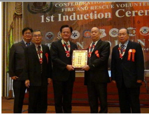
圖 9 理事長致送紀念牌