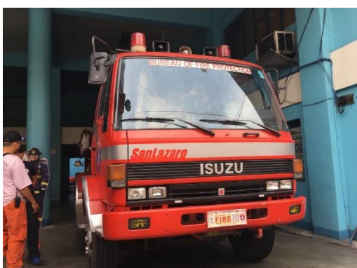
圖 3 10年前由臺灣捐贈的消防車