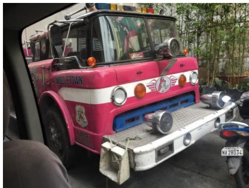
圖 2 防火會自備粉紅色消防車