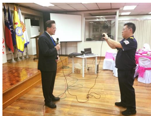
圖 8 接受僑社宏觀電視專訪