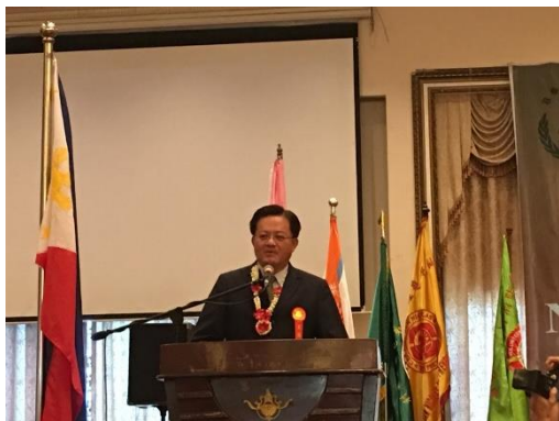
圖 11 受邀於成立典禮會上致詞