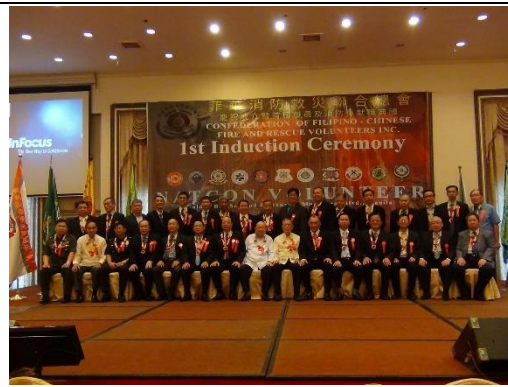
圖 10 消防救災聯合總會成立合影