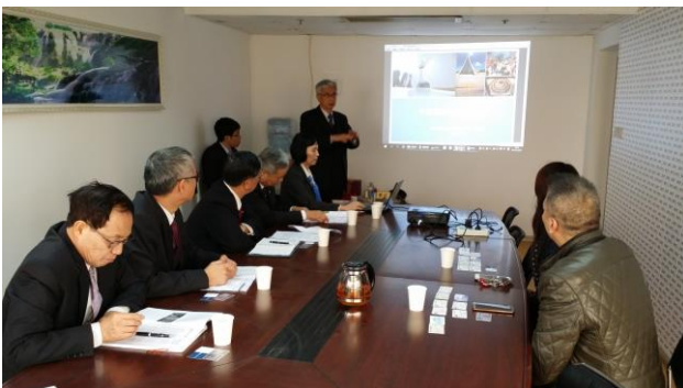
12/29上午拜會太湖國旅簡報行銷