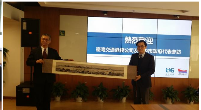
中聯運通公司熱烈歡迎本團參訪