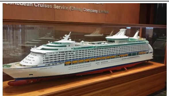
皇家加勒比郵輪模型