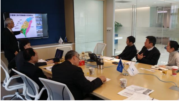
12/28拜會公主號郵輪，簡報七縣市觀光資源