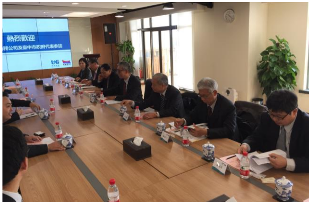
12/30上午拜訪中聯運通公司