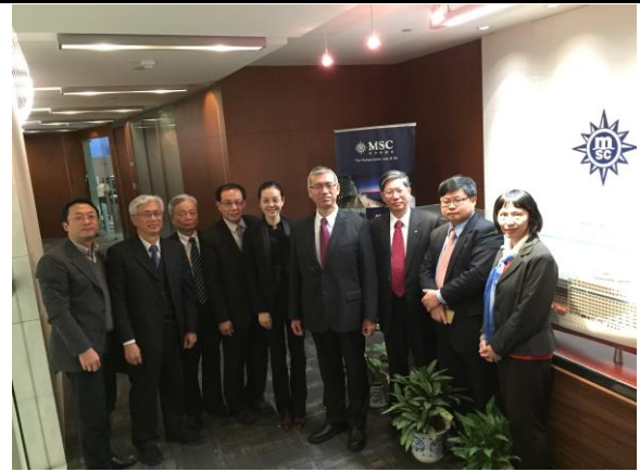
地中海郵輪公司全體留影