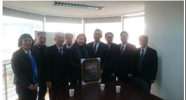
參訪後與太湖國旅全體合影