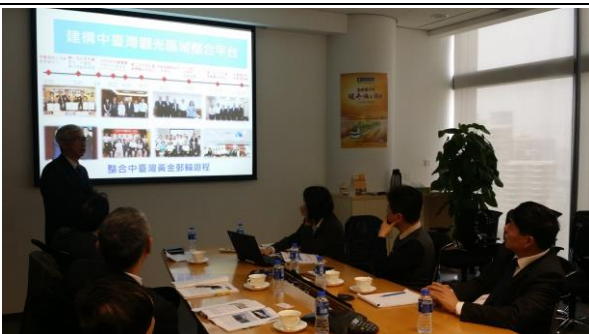
12/29下午拜會皇家加勒比郵輪公司