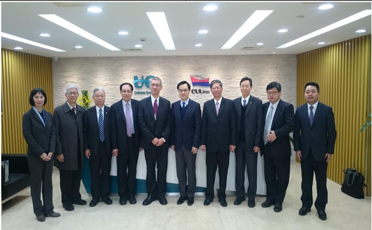
參訪團與中聯運通會後留影