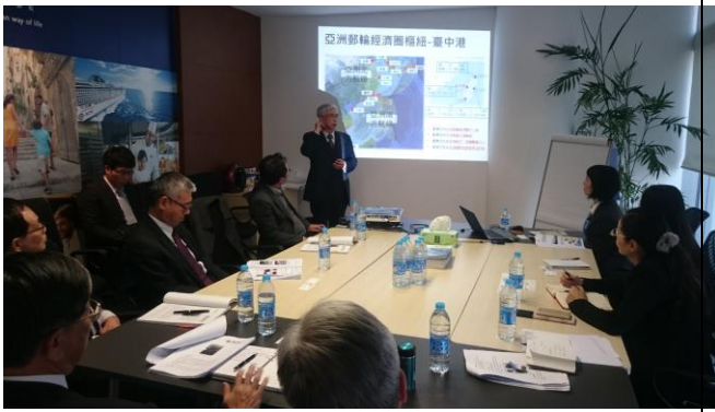
12/29下午拜會地中海郵輪公司