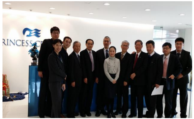
參訪後與公主郵輪公司合影