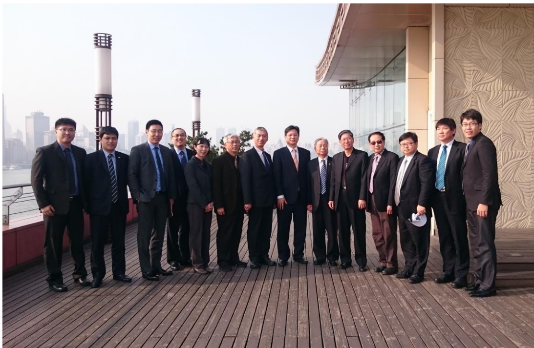
會後參訪團與上海港務集團全體留影