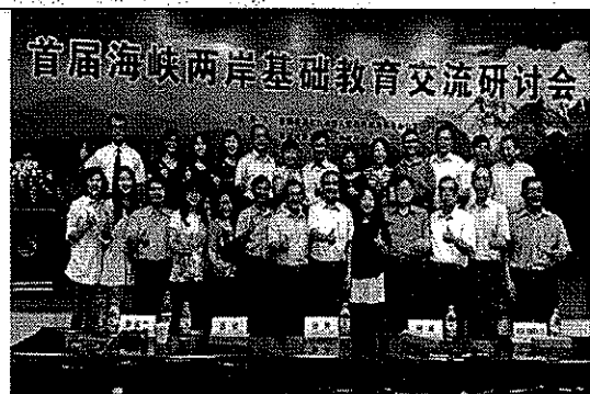
台灣參與研討會成員