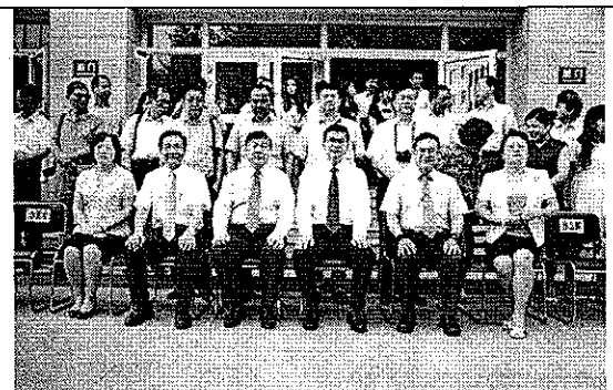
新疆與台灣參與研討會人員合影