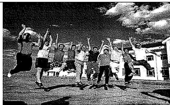
800公里途中找到廁所與藍天跳躍合影