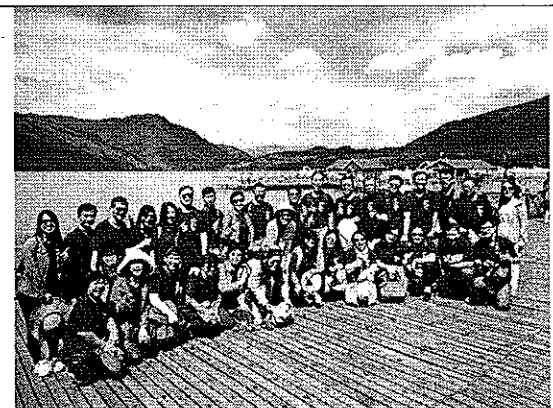
參訪團參訪人間仙境—喀納斯湖