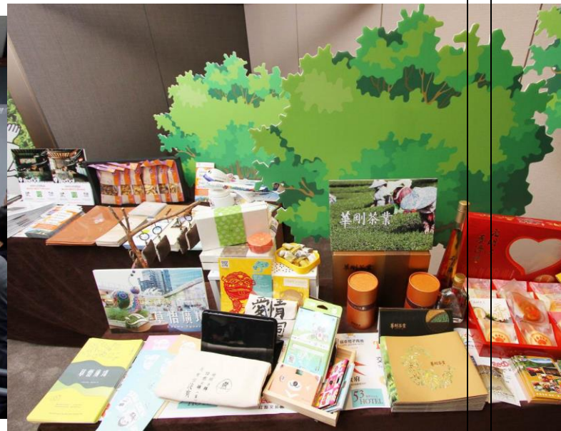
首爾廣場飯店推介會現場陳列的臺中 伴手禮與相關旅遊摺頁