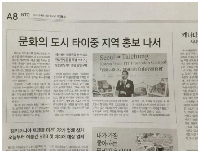
推介會於韓國媒體的露出情形之一