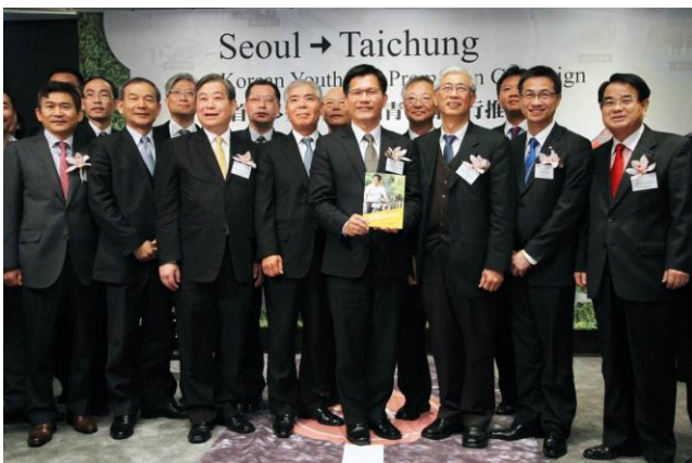
林佳龍市長、外交部駐韓大使石定、陳 盛山局長、華信航空韓梁中總經理、臺 中旅館、旅行同業與韓國旅行業者在推 介會現場合影留念