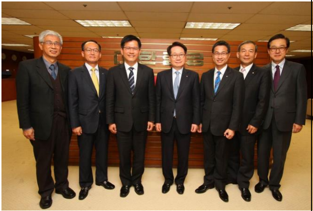
林佳龍市長、陳盛山局長、華信航空韓 梁中總經理，拜會大韓航空池昌薰社長