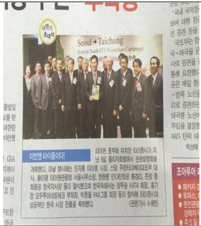
推介會於韓國媒體的露出情形之二