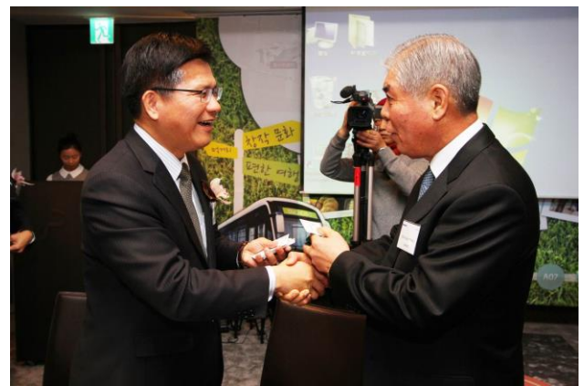
林佳龍市長與韓國旅行協會會長梁武 承相談甚歡