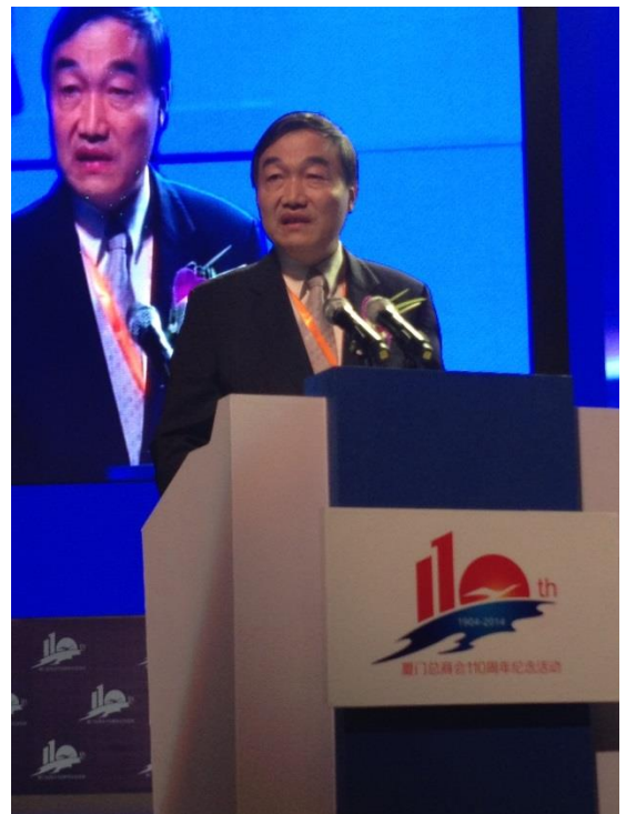
黃副市長率本府代表團出席「廈門商會110周年紀念暨華商高峰論壇」並於大會上致詞演說