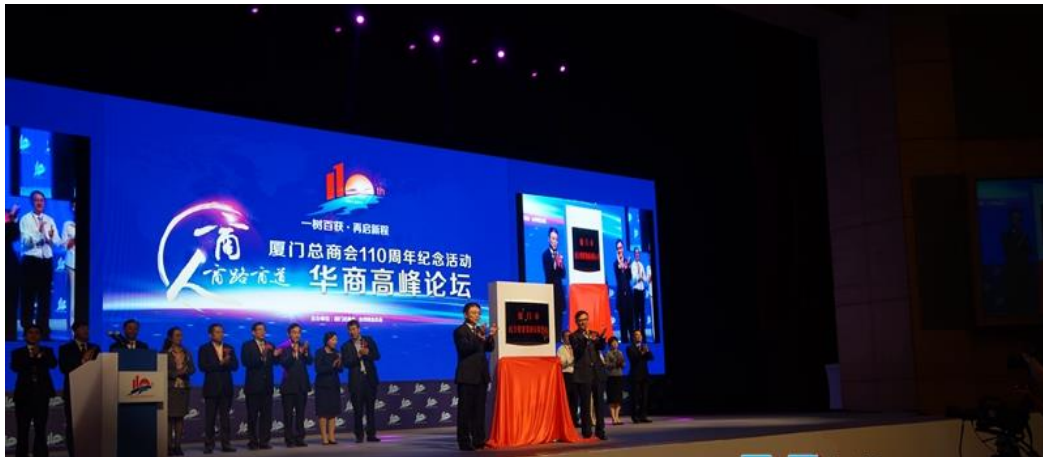
黃副市長及與會貴賓共同為大會論壇舉行揭牌儀式

今年適逢廈門商會成立110周年，所以本次論壇具有重大意義，希望藉由論壇的舉辦，將工商界的優良傳統，並將「尊商重商」的社會價值加以表彰，促進兩岸商人交流價值取向的認同。