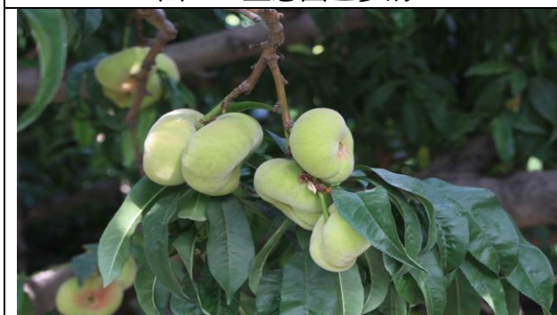
圖三、蟠桃園休閒農業採果樂參訪