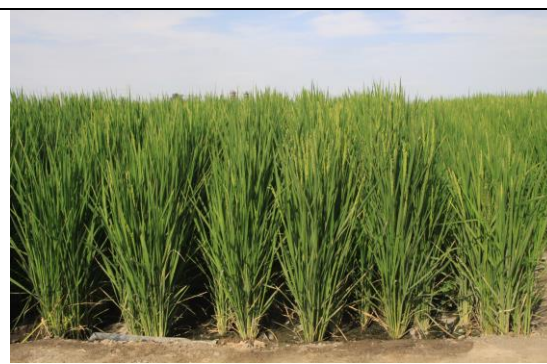
圖二、水稻旱種節水灌溉示範基地