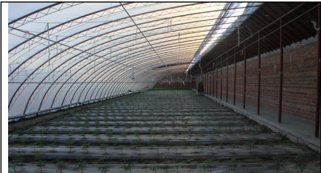
圖五、龍疆設施農業基地番茄栽培