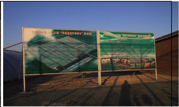
圖六、龍疆設施農業基地