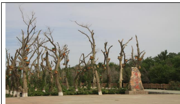
圖一、生態園區參訪