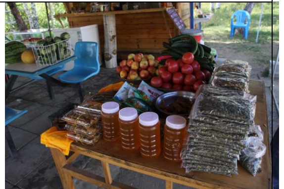
圖八、農家樂販賣的農產品