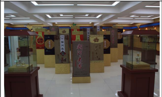
圖七、兼具休閒旅遊發展之額河酒廠