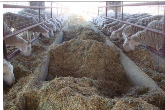
圖十、惠民合作社國際化養殖基地