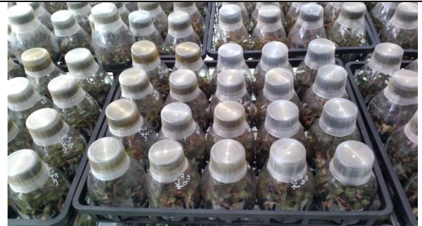
參訪森源蘭蕙生技公司 (4)