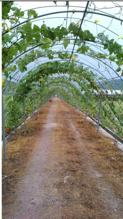
參訪臺灣精緻農業（果蔬）示範基地（2）