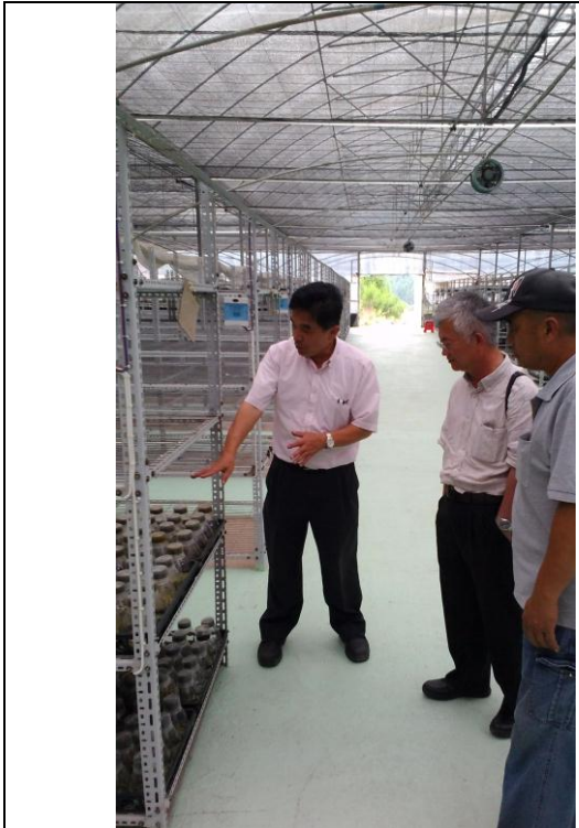
參訪森源蘭蕙生技公司 (1)