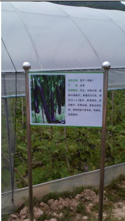
參訪臺灣精緻農業（果蔬）示範基地（4）