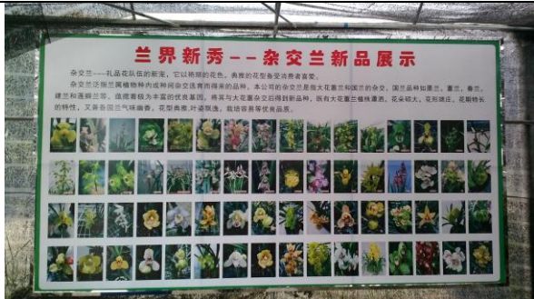
參訪森源蘭蕙生技公司 (3)