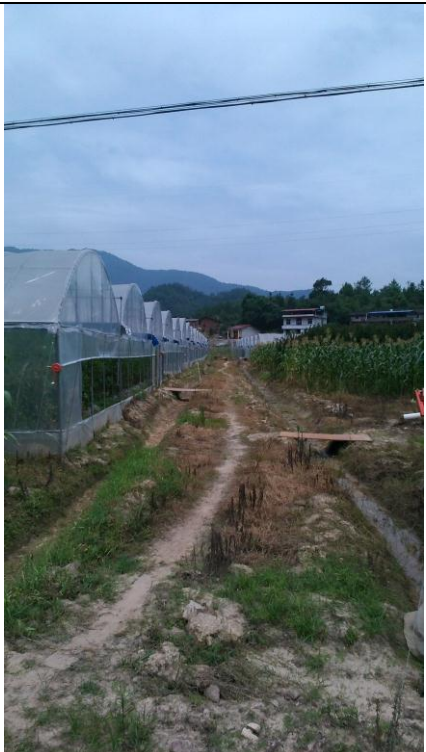
參訪臺灣精緻農業（果蔬）示範基地（3）