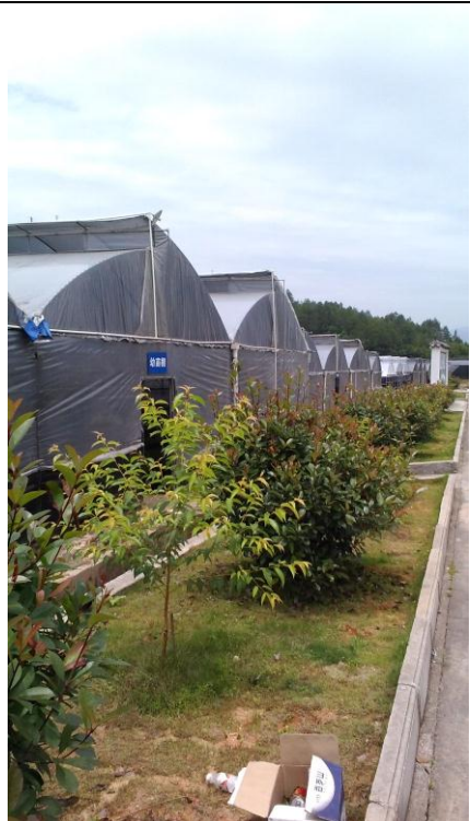
參訪森源蘭蕙生技公司 (2)