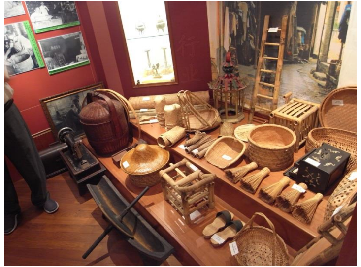
【圖 5 客家傳統生活用品】

在會館中設置有會議室，平時作為研習教室，開辦有關電腦軟體或程式語言的研習課程，讓會員們能培養第二專長，使其在競爭激烈的新加坡能獨佔鰲頭。而在會館中，更成立客家文化研究室與茶陽文物館(圖 6)，除舉辦學術研討會和各地學者專家交流外，客家文化室也鼓勵客家文化研究進行結集出版，已出版多本客家傳統叢書。另外在展覽廳部分，自踏入文化館開始，牆上標題不時的提醒著我們「情繫鄉梓」，秉持著飲水思源的传统，張主任先帶領我們認識大埔原鄉(圖 7)，在瞭解地理位置後，再依序由食衣住行育樂逐一介紹(圖 8)，其中更包含許多傳統建築模型的展示，有圓樓造型與伙房造型(李光耀故居、張弼士故居)的建築，在張主任的介紹下，我們彷彿身歷其境般的飽覽客家原鄉之美。