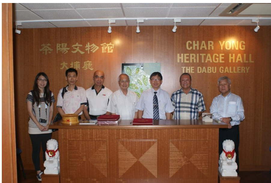
【圖 6 於茶陽文物館合影留念】

在交談中，彼此分享客家族群在異鄉打拼與創業的辛苦，在本市東勢區，過去大埔客家族群移居於此，曾發展匠寮業與樟腦業，至今皆在社會經濟的發展與歷史洪流中逐漸退色，在新加坡亦有相同經驗，過去客家族群在新加坡多經營中藥店、當舖、眼鏡行，如今，在企業化經營效應下，傳統行業也受此潮流而被融合，取而代之的是外資進駐的連鎖店。張主任感嘆表示客家族群經歷了 5 次遷徙，其文化、語言、飲食與遷徙地融合，皆難以追究其純正性。