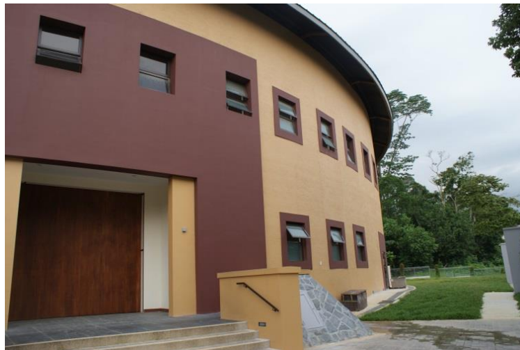
【圖 19】參觀客家宗祠，仿客家土圓樓式建築(外部)

而在新加坡的客家鄉親為配合政策，興建了一座仿土樓式的建築(如圖 19、20)，作為先人放存的地方，我們也實地參訪了這個具有飲水思源、慎終追遠意涵的特色建築，從中發現土樓建築的設計，除了讓室內空間明亮外，也具有通風的功能，不禁讓人感佩先人的智慧。