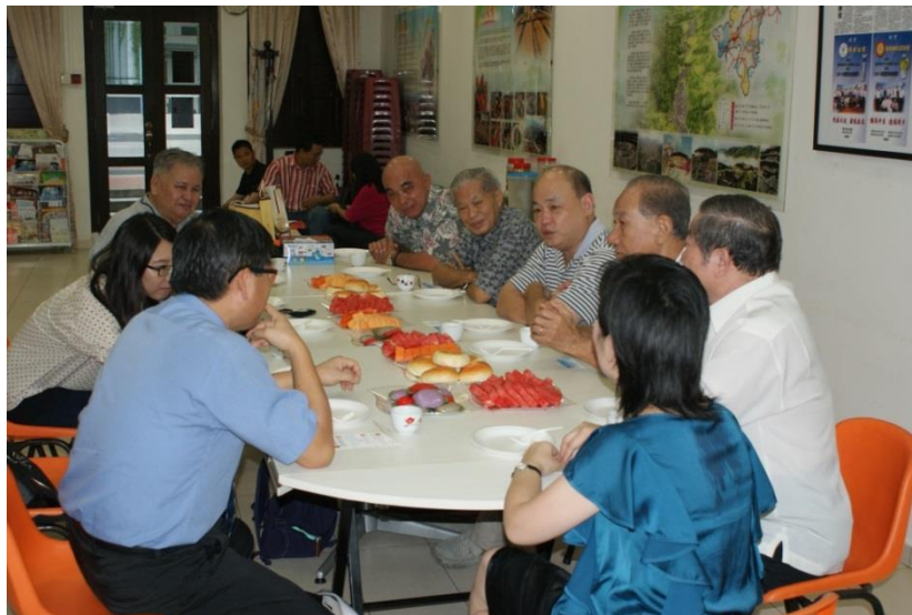
【圖 16 與永定會館交流】

會長表示客家方言的推行因與國家語言政策(提倡華語與英語)的衝突，使得客語的提倡在新加坡受到政府打壓，更遑論提倡，政府更鼓勵社團舉辦活動或開會時可多採用華語來溝通，使得客語的傳承受到嚴重的考驗，反觀客家傳統習俗與文化的傳承，未與國家政策衝突，反而受到較完善的保存(圖 16)。