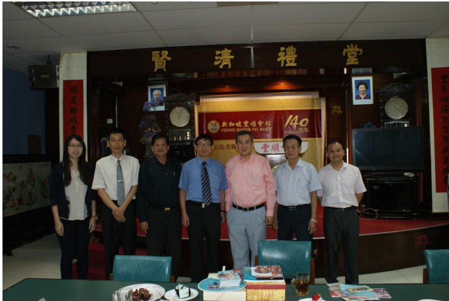
【圖 10 參訪豐順會館合影留念，背景為會館慶祝 140 週年慶祝紀念】

成立於 1873 年的新加坡豐順會館，因為會所原址被政府徵用，最後座落在芽籠區(Gaylang)，此處因未受到都市重建的影響，已成為華人宗鄉會館最為集中的地區，在這裡仍然可見許多殖民時期所建立的街屋。會館早期肩負著豐順鄉親的生活安頓及聯繫工作，如今雖然以往的功能不再，但是豐順會館仍然勇於轉型創新，甚至成為發揚華人文化的重鎮(圖 10)。