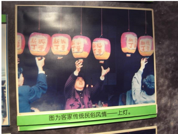
【圖 4 客家傳統民俗風情-上灯】