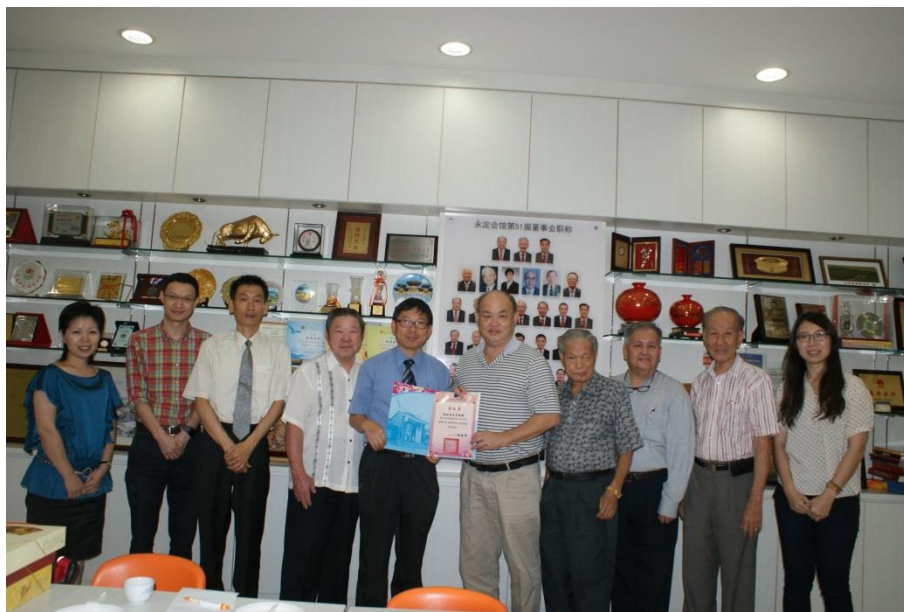
【圖 18 與永定會館成員合影留念，並贈送感謝狀致意】

在交流中，我們得知永定會館正推行百年樹人計畫，是由該會的文教股所策劃，會館每年都會贊助兩所學校舉辦母語文化雙週活動，以富有創意又靈活的方式，服務學校及文化團體，藉此傳承傳統客家文化。曾會長表示，希望以富有創意又靈活的方式，服務學校及文化團體，藉此傳承傳統客家文化。