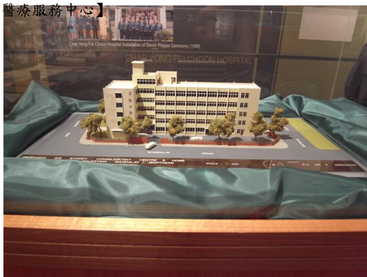
【圖 3 茶陽回春醫社，現為國際區域性醫療服務中心】

何主任表示，茶陽會館是大陸「大埔縣」的宗親會、同鄉會，命名來源是因為，初期茶陽會館只限茶陽鎮的鄉親為會員，後期為了吸收更多會員而改為大埔縣鄉親會館，另一個原因則是因為茶陽鎮因地勢低窪，部分鎮民移居至大埔縣，因而將茶陽鎮與大埔縣的客家鄉親皆納入會員招募的對象。茶陽會館在八年前建有會館大樓，樓高三層，後來會員人數增加、活動頻繁，場所不敷應用而重建大樓，2002 年 12 月 3 日，新落成的八層樓茶陽大廈由時任副總理的李顯龍鄉賢主持開幕(圖 2)。