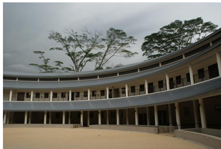
【圖 20】參觀客家宗祠，仿客家土圓樓式建築(內部)