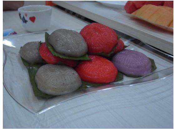
【圖 14 會館內陳列著推行各項活動的感謝狀及獎牌】 【圖 15 客家傳統點心-紅龜粿】

會長表示客家方言的推行因與國家語言政策(提倡華語與英語)的衝突，使得客語的提倡在新加坡受到政府打壓，更遑論提倡，政府更鼓勵社團舉辦活動或開會時可多採用華語來溝通，使得客語的傳承受到嚴重的考驗，反觀客家傳統習俗與文化的傳承，未與國家政策衝突，反而受到較完善的保存(圖 16)。