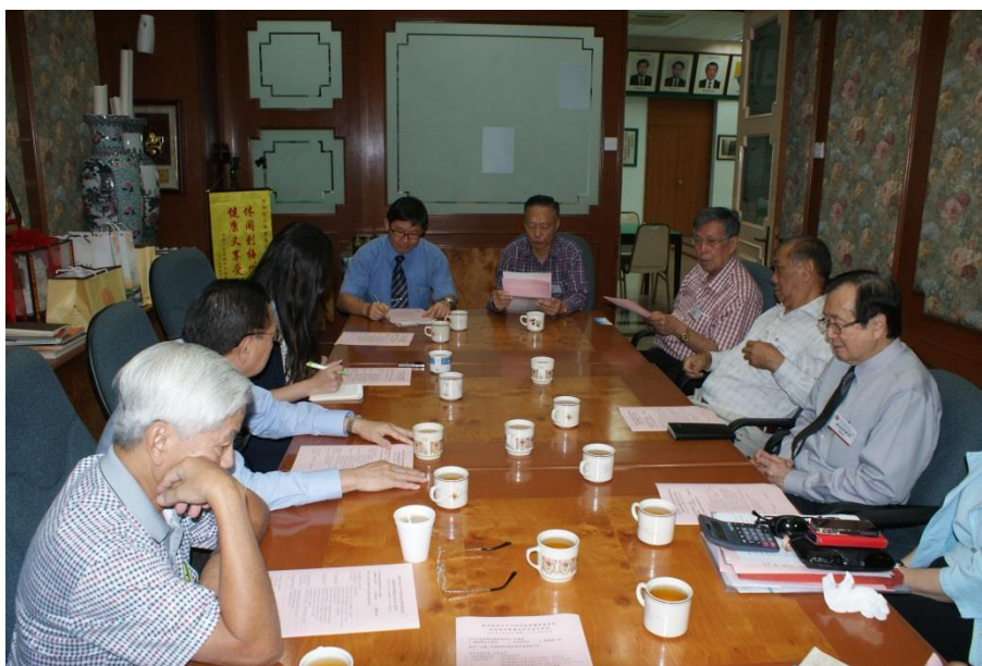
【圖 13 與南洋客屬總會與惠州會館進行經驗交流】

在訪談中，從南洋客屬總會在教育方面的建樹上，得以感受到客家人重視「崇文重教」的精神。自 2007 年全力協助落實南洋理工大學孔子學院的“南洋華文文學獎”計劃、與新加坡國立大學中文系，共同主辦了“新加坡客家研究論文發表會”，並在其後資助出版了“新加坡客家文化與社群”論文集，每年皆舉辦相關研討會，出版相關論文集，並積極建立人才培育基地。另外更組成客家合唱團分別在《中國北京第 10 屆中國國際合唱節》以及《梅州國際山歌文化節》比賽中獲得多獎項；這些獎項為客總以傳承華族文化作為己任得到肯定。