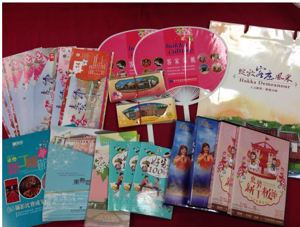
【圖 1 本次參訪，賴主委朝暉特地準備了本會發行的好客雙月刊、東勢客家文化園區簡介、石岡土牛客家文化館簡介、好客 100 句、東勢新丁板節攝影比賽成果專輯、2014 東勢新丁板節活動光碟、大海之歌光碟、模樣。走進板印下的時光印記專輯光碟等其他相關文宣品，分送給各客家會館】

於下榻飯店放置完行李後，將此次參訪宣導品備妥後(如圖 1)，隨即前往此次第一個參訪行程-茶陽(大埔)會館(以下簡稱茶陽會館)。一抵達會館，由何會長、張秘書、郭總務、何主任與藍先生共同為我們介紹茶陽會館的歷史與目前的經營情形。