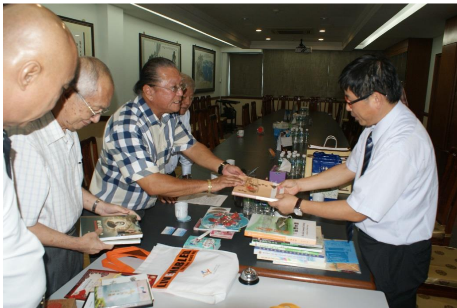
【圖 9 賴主委與何會長交換文宣品】