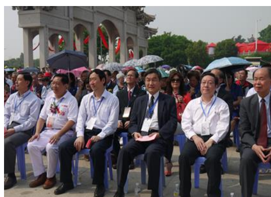
黃副市長國榮與廈門市相關領導於貴賓席就坐合影