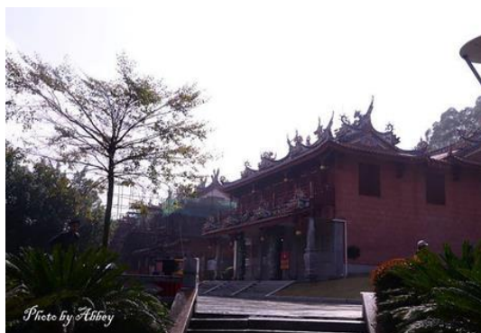
青礁慈濟宮為保生大帝生前煉丹修道之所亦是初享廟食之始地

殿前有拜亭。後殿重建於 1989 年，內供佛道諸神。三殿由兩側廊廡通連。宮內保存大量珍貴的石雕、木雕、彩繪藝術品，體現了閩南匠師精湛的工藝水平。