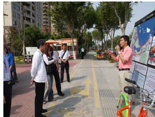
公共自行車導覽人員為本府代表團人員解說設置目的及使用功能

海滄區啟用公務自行車系統，推動公務人員出門辦事的交通工具從四輪的公車變成兩輪的公車，既低碳環保有利於節約行政成本，亦有利於拉近幹部與群眾之間的距離，推動轉變幹部的工作作風，可以