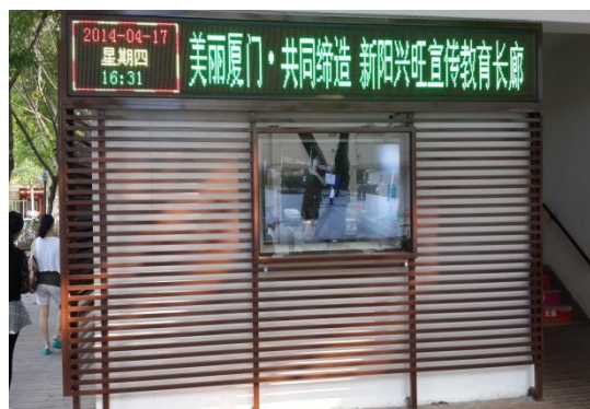
新陽街道LED文字跑馬燈