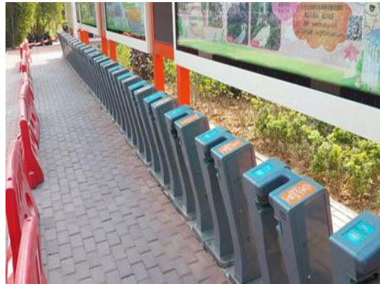
公共自行車系統設置站

參觀完公共自行車系統後，接著本府代表團一行人來到了海滄街道海虹社區，由海滄街道領導介紹社區內規劃與配置，據該街道領導解說表示，海滄街道海虹社區成立不到4年，2011年底在全省率先發展社區“網格化、信息化、精細化”，發揮了相當大的成效，引起了有關部委和省、市的高度關注。今年初以來，國家民政部、省市主要領導先後蒞臨海虹社區指導工作，對海滄區在社區管理創新方面給予了高度評價，“海虹模式”在全省全面推廣、全市全面推行。