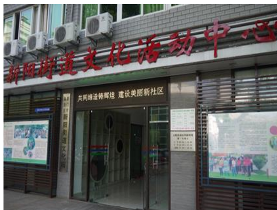
新陽街道領通向本府代表團人員介紹 新陽街道文化活動中心外觀 該社區目前之規劃與設置概況

17日結束了白天的參訪行程，晚上歡迎晚宴設在鼓浪嶼酒店舉行，由海滄區政府及台辦接待各地前來參加旅遊節活動貴賓，包含本府代表團人員，並由常務副區長吳順彬先生主持餐會。