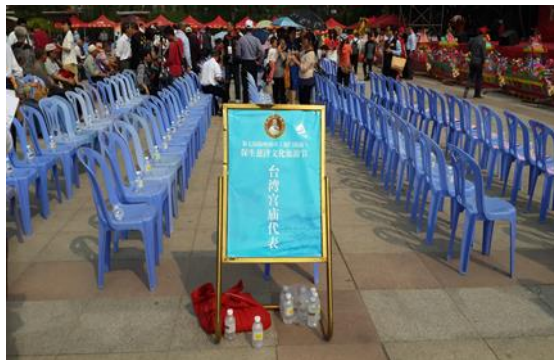
臺灣宮廟代表團座位圖

臺灣參與活動的團體包含新北、新竹、臺中、嘉義、臺南、高雄、屏東、澎湖與金門等 9 個縣市，共有 19 個宮廟 300 多名信眾參加。當日活動開場在臺灣原住民高亢的歌聲中隨即展開，接著表演原住民歌舞，當地特有民俗藝陣「蜈蚣閣」也遠行會場進行表演，48 名穿著古裝的小朋友坐在連接的藝閣上，由 100 人扛著遊行。