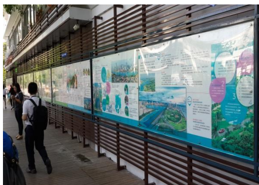
新陽街道導覽解說圖說

本府代表團一行人當(17)日最後來到廈門市海滄區新陽街道興旺社區，就該社區落實“美麗廈門、共同締造”戰略規劃的實踐進行現場觀摩。與會人員對該社區的“網格化”指揮服務中心均表示高度肯定，而該社區推行的“五共”（共謀、共建、共管、共用、共評）理念更是與臺灣地區的社區營造不謀而合。