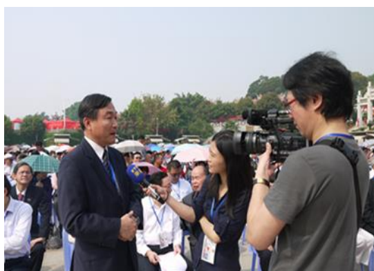
黃副市長國榮於活動會場接受東森電視台記者訪問

第七屆中國大陸福建省廈門海滄保生慈濟文化旅遊節，18日在廈門海滄青礁慈濟祖宮正式揭幕，兩岸三地信眾交流，擴大保生大帝的慈濟大愛。當日由前福建省政協副主席陳榮春先生宣布文化旅遊節活動正式開始，接著由本市副市長黃國榮與廈門市委副書記鐘興國共同敲鑼後，展開為期2天的慶祝活動。