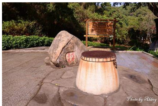
此井是吳真人醫生煉丹藥時用的泉水井