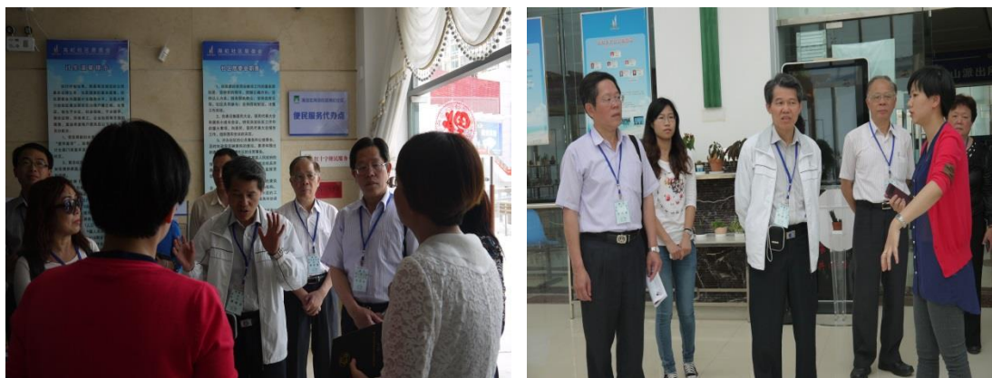
海虹社區海滄街道領通向本府代表團人員解說該社區目前規劃與設置概況

人性化”，實現了社區管理由硬體建設轉向軟體服務的全面提升。海滄區由此成為了全國首座城鄉所有社區推行“四化”模式的行政區，並且在全國率先將網格化、信息化、精細化及人性化等當前社會管理最新理念引入社區管理服務。