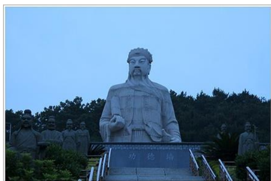
青礁慈濟祖宮保生大帝石像