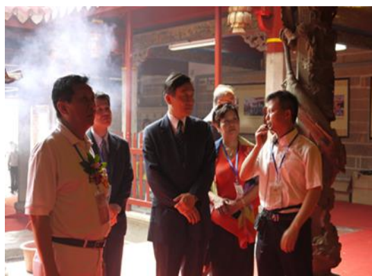
青礁慈濟祖宮導覽人員向本府代表團一行人介紹該宮現況及歷史背景