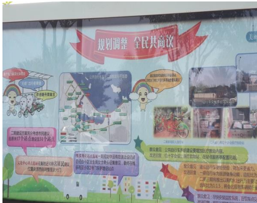
公共自行車系統規劃設置圖說

法，也是希望引導更多的公務人員和市民選擇綠色出行，其實效果還不錯，無論是公務自行車系統還是公共自行車系統，它們的利用率現在正越來越高，尤其是到周末的時候，很多市民和遊客也是競相體驗，甚至有一車難求的局面。