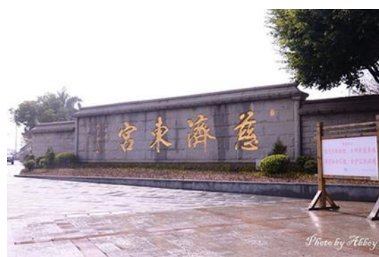
青礁慈濟宮：又稱為東宮，始建於南宋紹興二十一年（1151 年）

現存青礁慈濟宮重建於清初，係重檐歇山頂磚石木結構三進建築，坐西朝東，建築面積 1305 平方公尺。中軸線自東向西逐漸增高，前殿重樓，由檐廊、門廳和鐘鼓樓組成；中殿為正殿，內供吳真人神像，