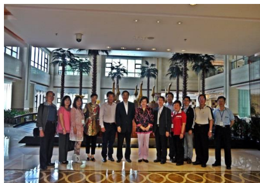
黃副市長國榮、國策顧問蔡鈴蘭女士與本府代表團人員及海滄區相關領導人員於鼓浪灣酒店1樓大廳合影

第七屆中國大陸福建省廈門海滄保生慈濟文化旅遊節，18日在廈門海滄青礁慈濟祖宮正式揭幕，兩岸三地信眾交流，擴大保生大帝的慈濟大愛。當日由前福建省政協副主席陳榮春先生宣布文化旅遊節活動正式開始，接著由本市副市長黃國榮與廈門市委副書記鐘興國共同敲鑼後，展開為期2天的慶祝活動。