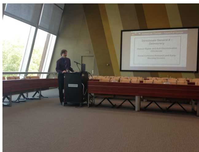
【圖 5】歐洲委員會專題報告

每一循環都會有八個步驟：（1）動員大眾；（2）共同界定社會進步期程；（3）前期評估；（4）設計方案；（5）共同投入做出決定；（6）付諸行動；（7）後期評估；（8）估算此一環循段的影響及為下一步做準備。再進入第二段環循的八個步驟，再進到第三段環循的八個步驟，如此螺旋發展下去。（資料來源： https://wikispiral.org/ ）