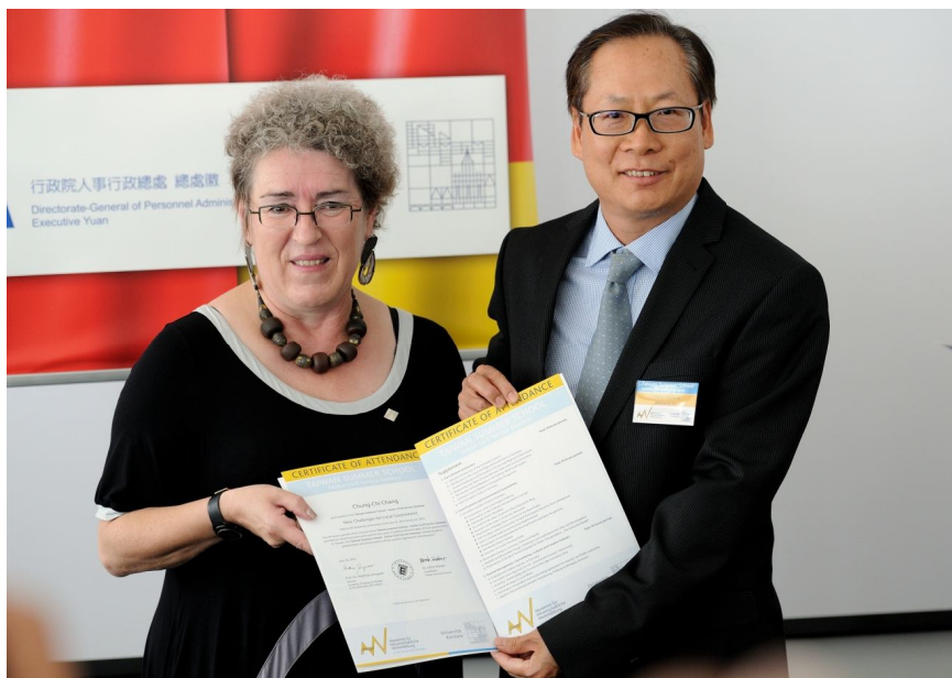
【照片 9】頒發與康斯坦茲大學結業證書