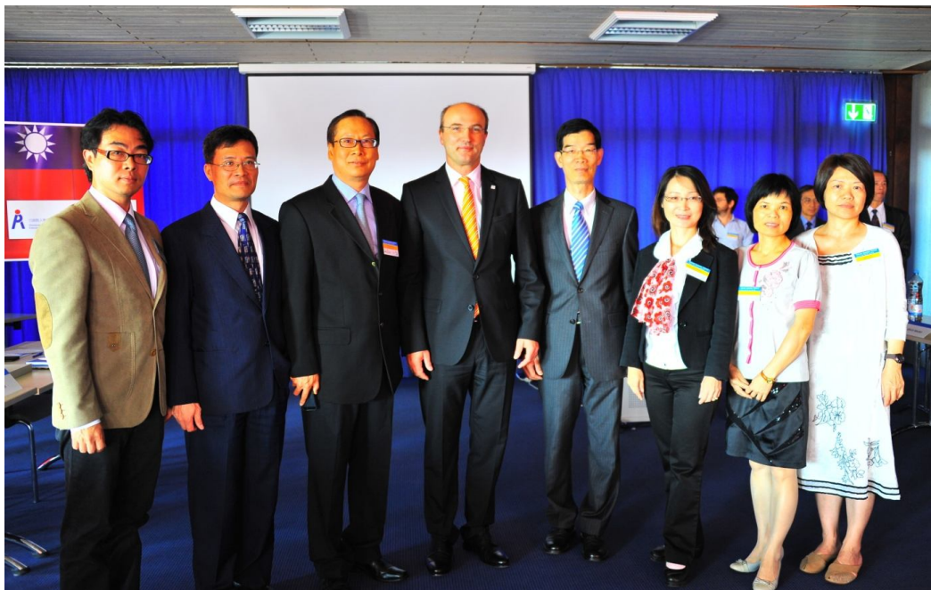
【照片 4】康斯坦茲大學校長、人事行政總處陳處長、駐德代表與跨領域治理小組成員於開幕典禮