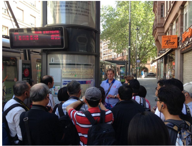
【圖 1】法國史特拉斯堡實地課程

現象，也是少數幾個並非一國首都，卻是國際組織總部所在地的城市，駐有歐洲聯盟（Europe Union）許多重要的機構，包括歐洲委員會、歐洲人權法院、歐盟反貪局、歐洲議會等，突顯其政治上的地位。