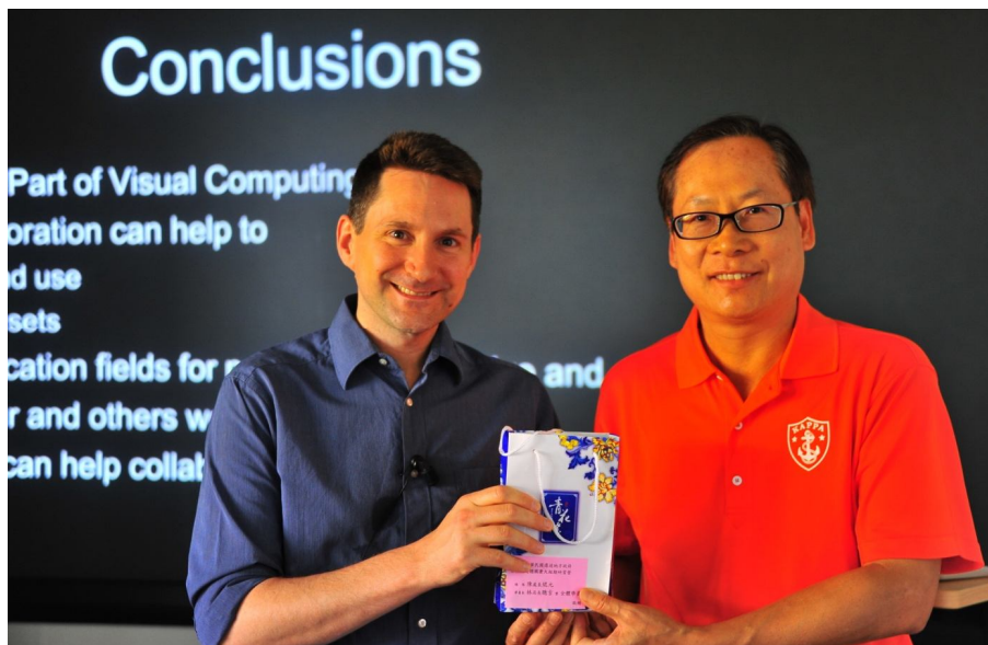
【照片 5】致謝康斯坦茲大學講師