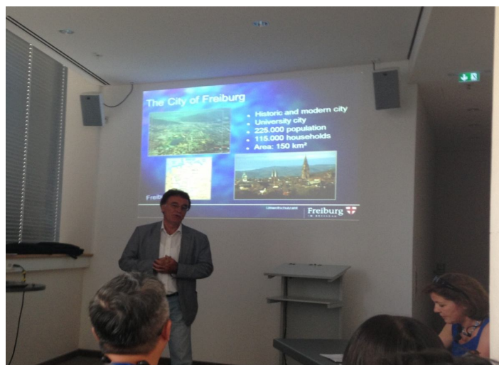
【圖 6】創新學院環保處教學課程

(5) 城市 100 年前已有輕軌，亦首創自行車優先路段，社區 500 公尺內提供輕軌，在終點站提供 bus 接駁，或鼓勵電動車；但政府投資仍在虧損中，繼續提供 21 萬人民便利安全之交通服務。