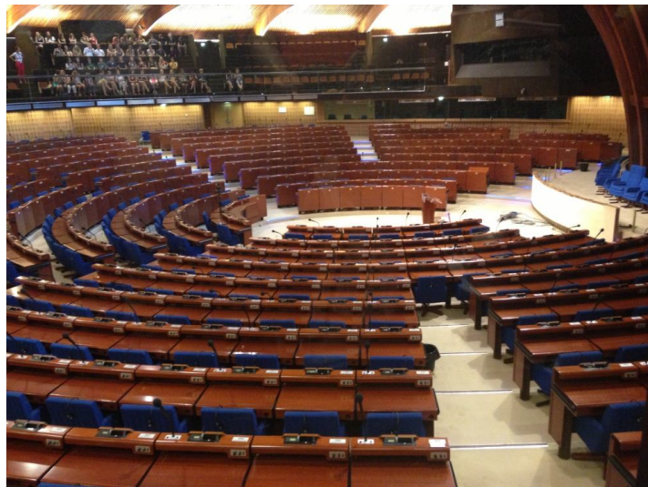
【圖 3】歐洲委員會議會

秘書處成員來自所有 47 個成員國並有超過 2,000 個永久員工和臨時僱員，辦理各項行政工作。