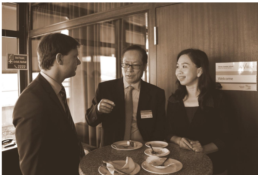
【照片 7】與康斯坦茲大學講師課後交流