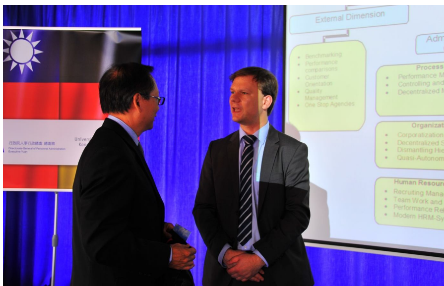
【照片 6】與康斯坦茲大學講師課堂討論