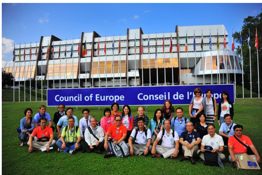
【照片 2】參訪歐洲委員會