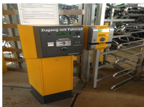
【圖 7】自行車自動收費機器(kiosk)