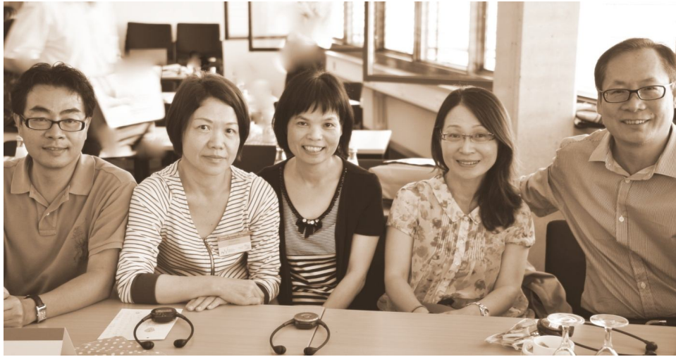
【照片 3】跨領域治理小組成員