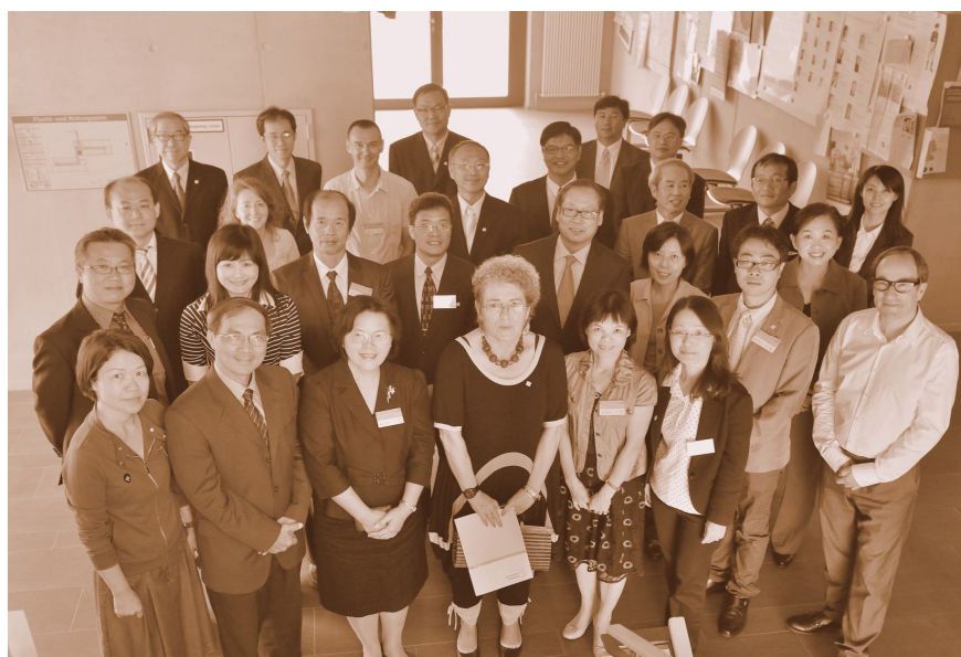
【照片 10】康士坦斯大學短期研習全體參訓學員結業式留影