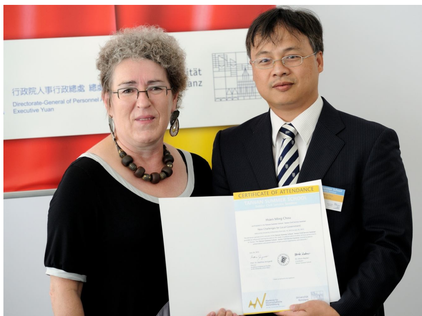
【照片 8】頒發與康斯坦茲大學結業證書