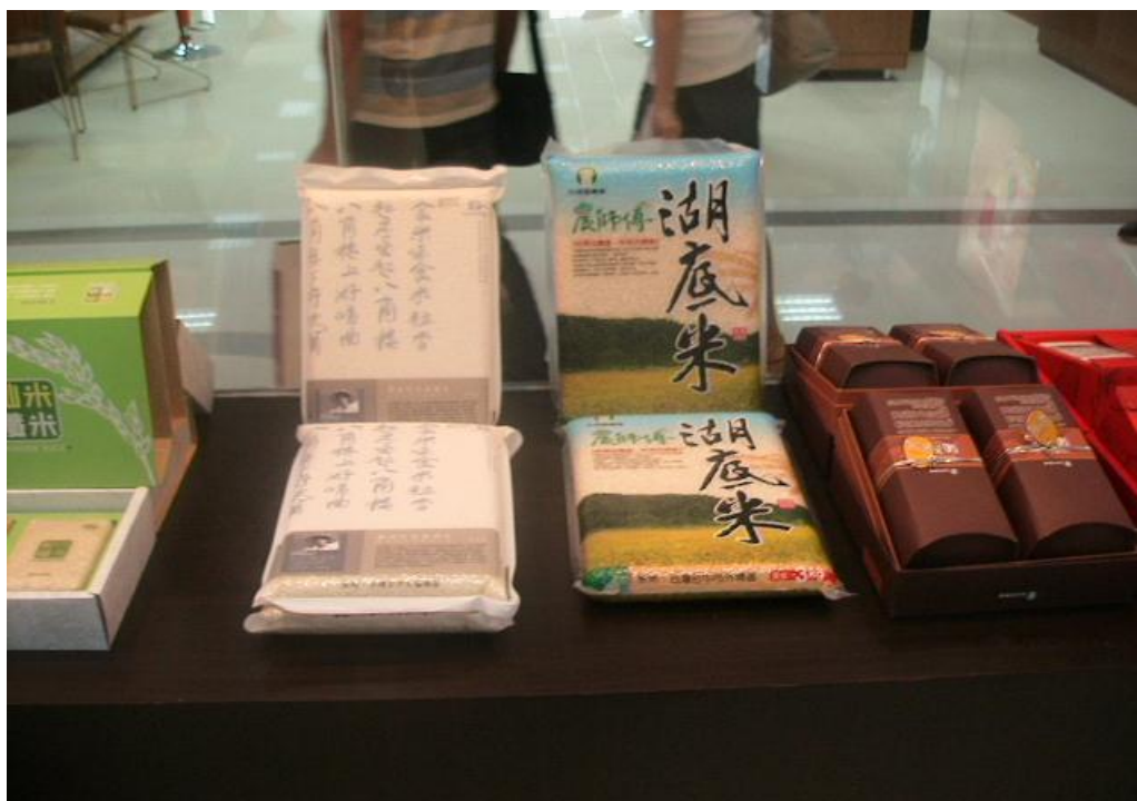
臺中精品農產館成列產品