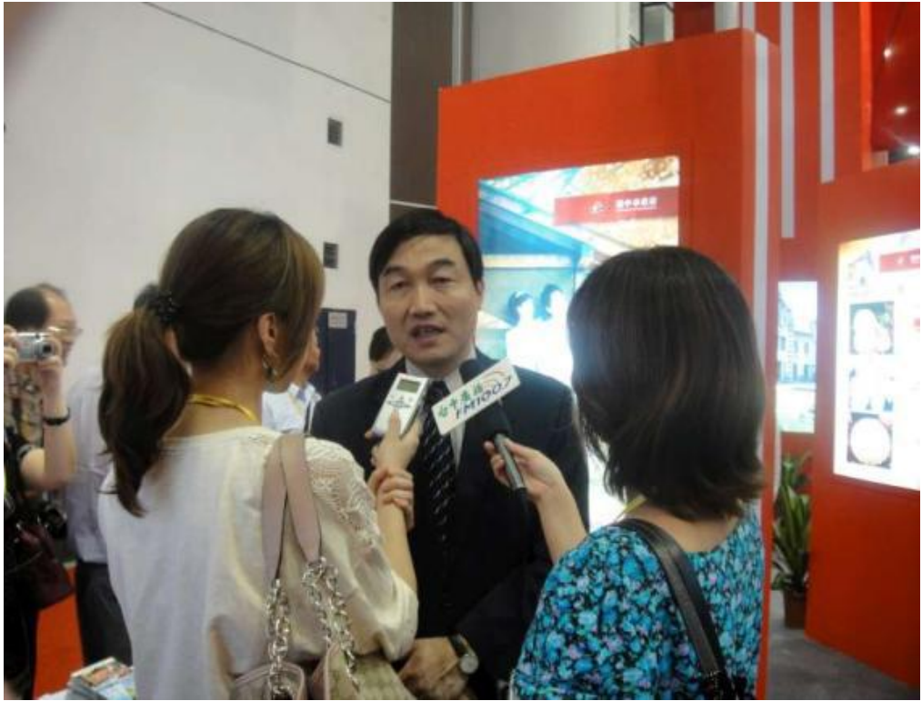
廈門旅展-中彰投中臺灣館秘書長接受媒體採訪