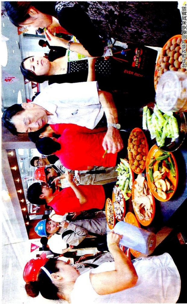
台中农业博览会农产品备受欢迎。