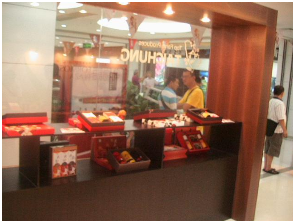
臺中精品農產館成列產品