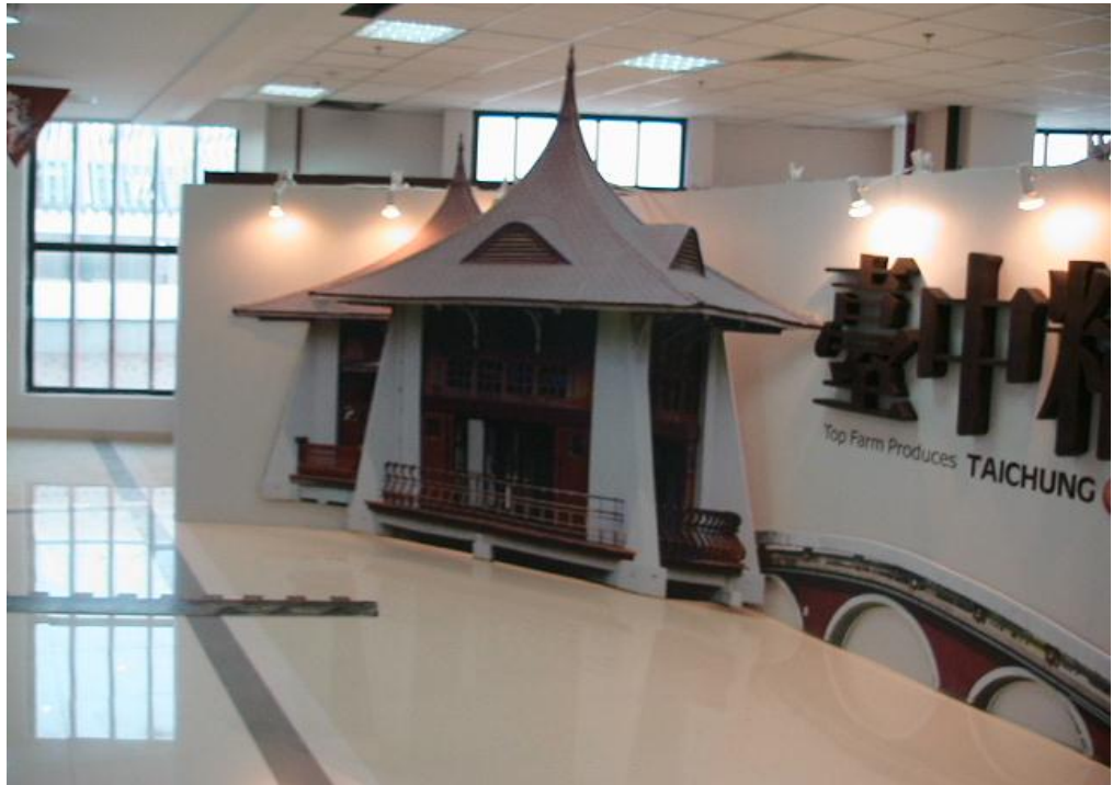
臺中精品農產館設置於臺灣農漁會精品特展大樓三樓