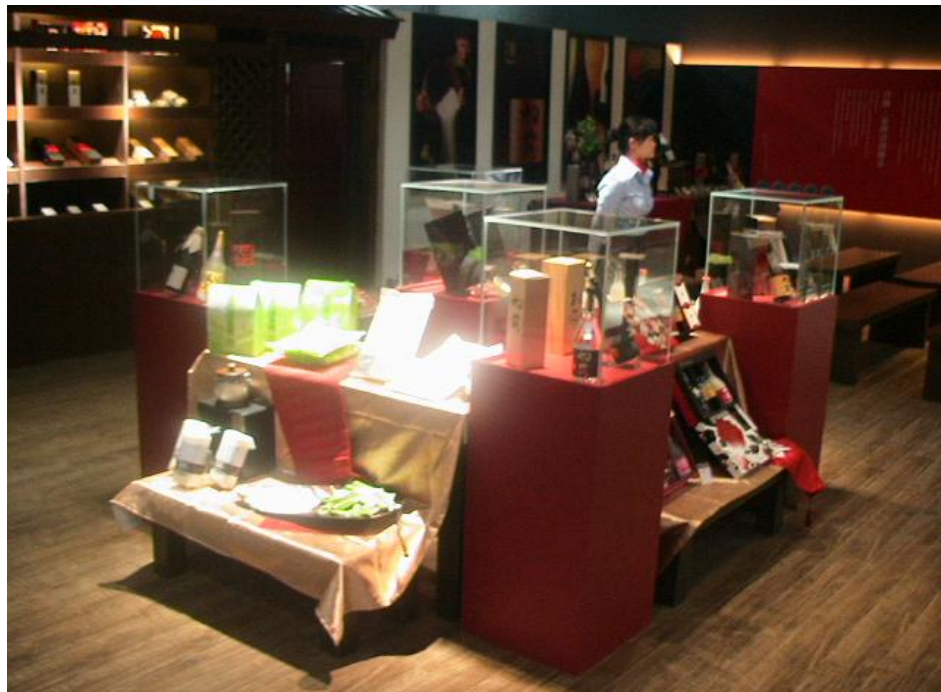
臺中精品農產館成列產品