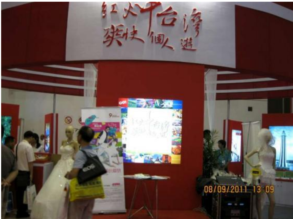
廈門旅展-中臺灣館正面