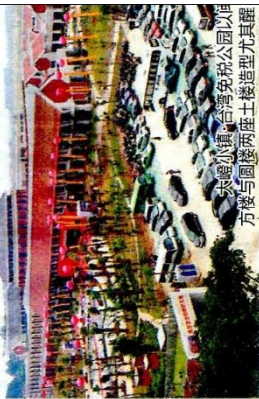
大嶼小镇·台湾免税公园以海峡两岸与圆融两座土楼造型为灵感

而大嶼小镇另一面“大嶼生活馆”,也多了山原创作的木雕、油画的窗口,让人提供了一个了解台湾化的窗口。