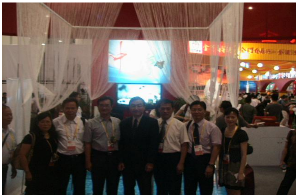
廈門旅展開館儀式後出席人員合影