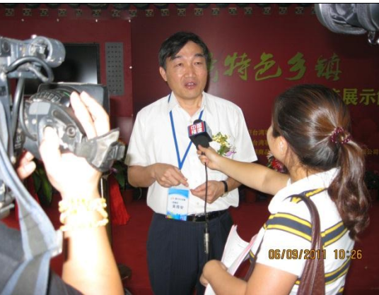
秘書長於開幕儀式後接受媒體訪問