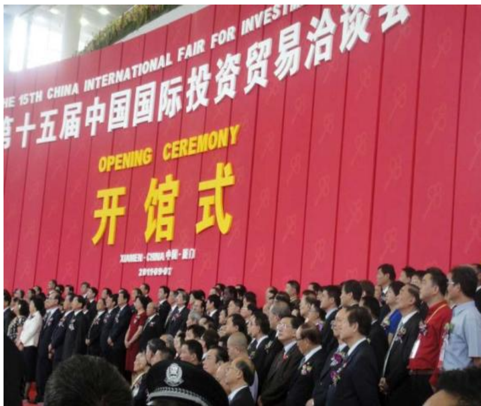
廈門旅展開館儀式