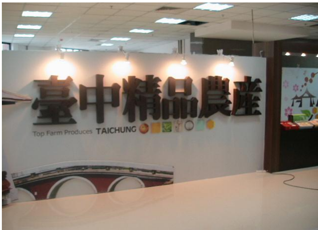
臺中精品農產館設置於臺灣農漁會精品特展大樓三樓