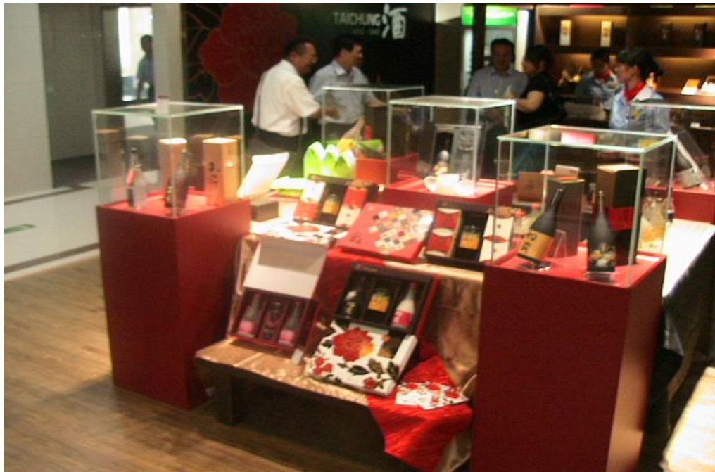
臺中精品農產館成列產品