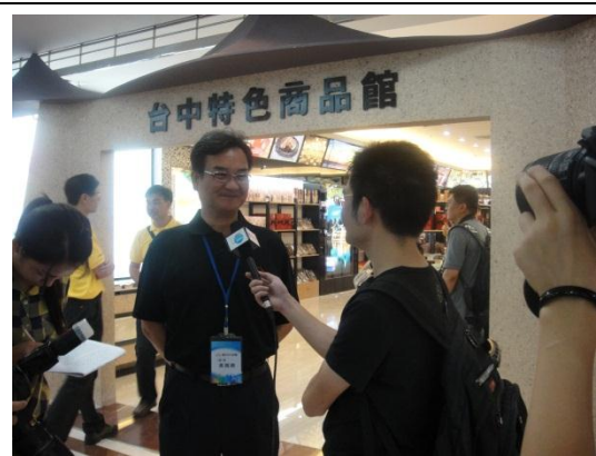
於臺中特色商品館前接受媒體採訪