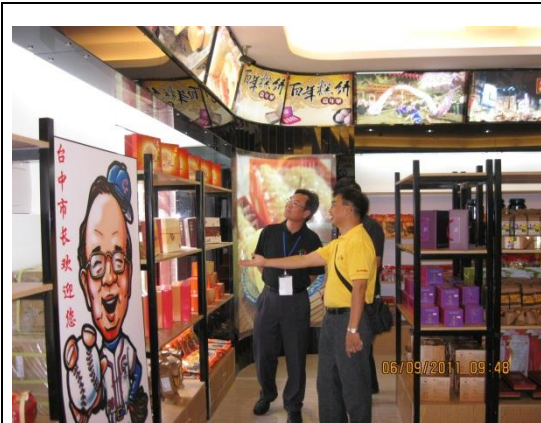
瞭解臺中特色商品於館內之上架情形