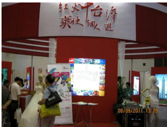
廈門旅展-中臺灣館正面