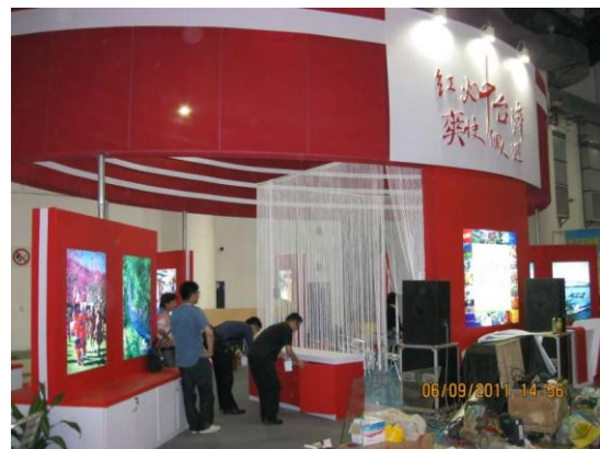
廈門旅展-中彰投中臺灣館 檢查展場設備