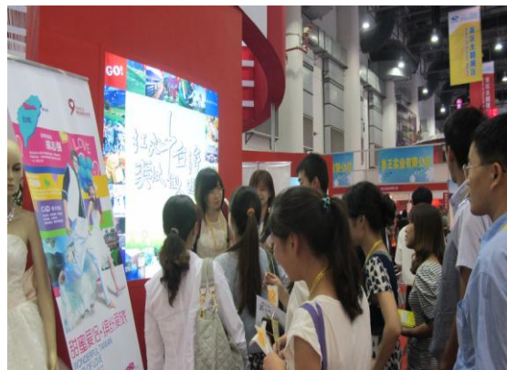
廈門旅展-中臺灣館大富翁遊中臺灣-博餅有獎問答活動