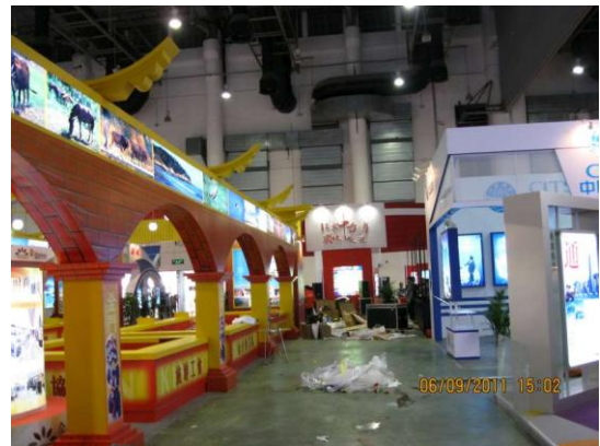
廈門旅展-中彰投中臺灣館(相片中間) 周圍展位多已完工但環境未清理