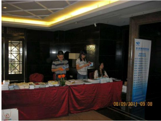
廈門旅展推介（推薦）會門口設置之書面資料桌 本市於該處擺放觀光手冊及相關新聞稿