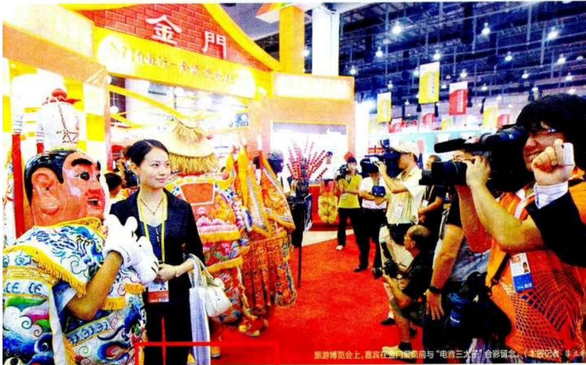
旅游博览会上,嘉宾在“金门”展位前与“电子三太子”合影留念。