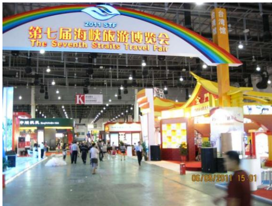
廈門旅展-臺灣館(相片右邊) 展場已完工環境未清理