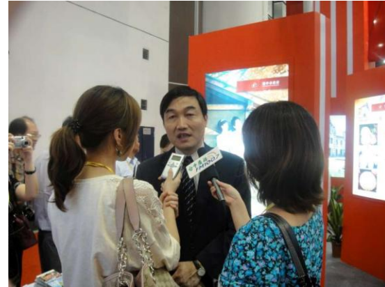
廈門旅展-中彰投中臺灣館 秘書長接受媒體採訪