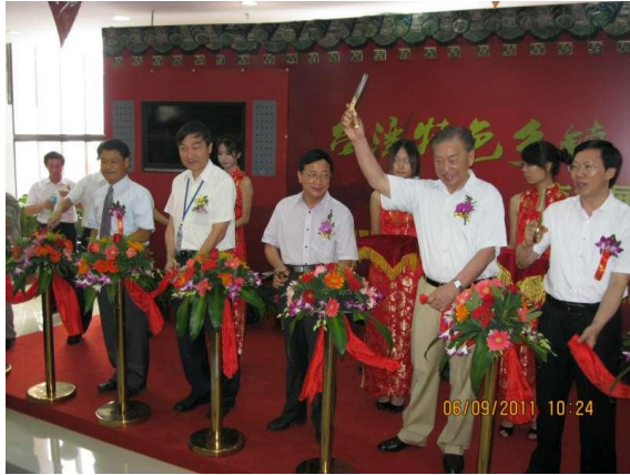
大嶼小鎮-臺灣特色鄉鎮交流展示館 秘書長(左三)與其他縣市代表為開幕式剪綵