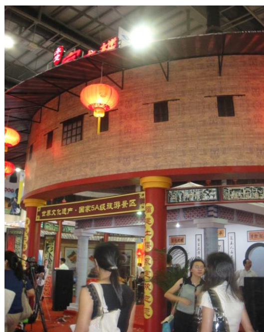
廈門旅展-福建永定館