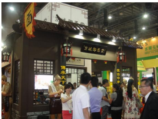
廈門旅展-某知名麵館展位