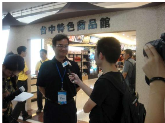
大嶠小鎮-臺中特色商品館賣場 局長於現場接受媒體採訪