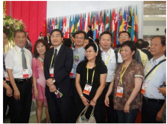
廈門旅展開館儀式後出席人員合影