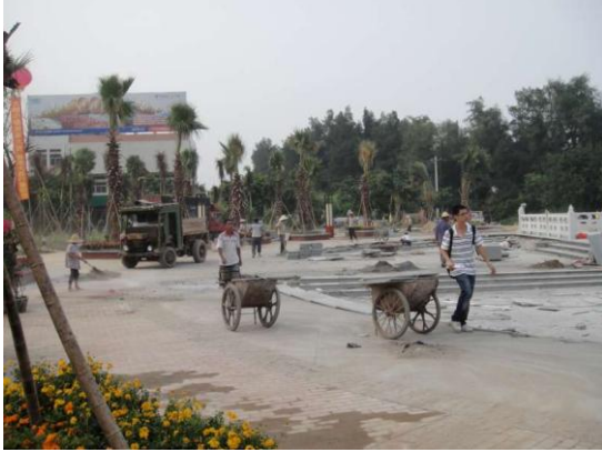
大嶠小鎮-臺灣免稅商品主題公園 9月5日下午勘查時現況