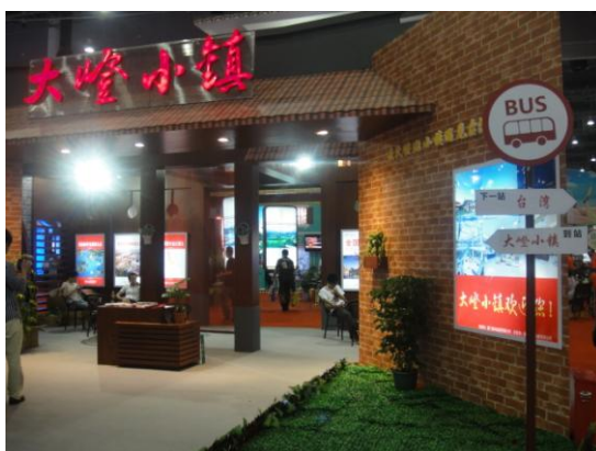
廈門旅展-大嶝小鎮館