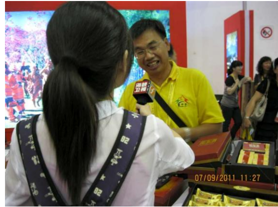
廈門旅展-中彰投中臺灣館 本市糕餅業者接受當地媒體採訪