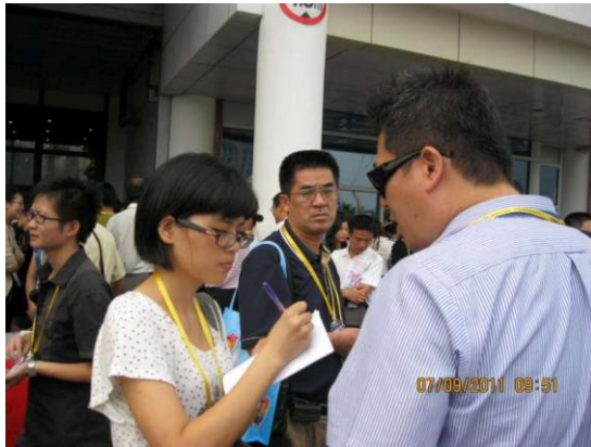
廈門旅展展館外-等候開館時 科長接受廈門日報記者專訪