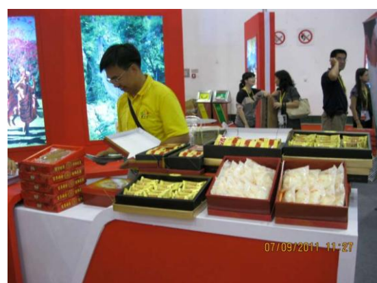
廈門旅展-中臺灣館糕餅展位