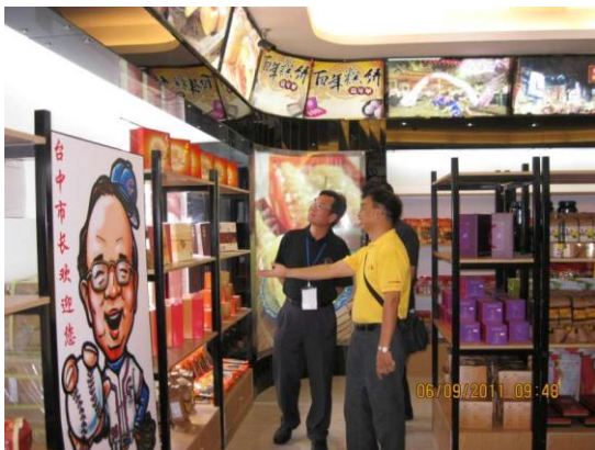
大嶠小鎮-臺中特色商品館賣場 瞭解業者商品於賣場之上架情形