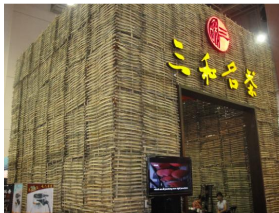
廈門旅展-某茶行展位