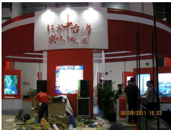
廈門旅展-中彰投中臺灣館 討論展場佈置及動線