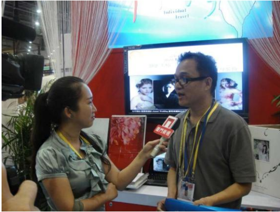
廈門旅展-中彰投中臺灣館 本市婚紗業者接受當地媒體採訪