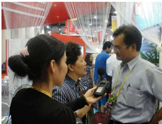
廈門旅展-中彰投中臺灣館 局長接受當地媒體採訪