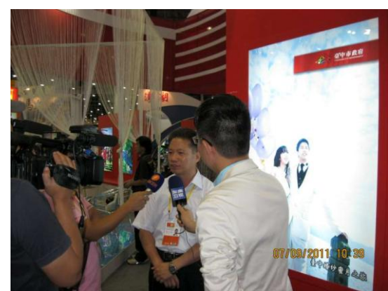
廈門旅展-中彰投中臺灣館 本市旅行業者接受當地媒體採訪