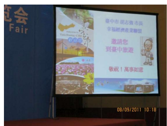
廈門旅展推介（推荐）會 本市推介（推荐）會資料