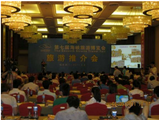
廈門旅展推介（推荐）會 本市代表上台簡介現場媒體眾多