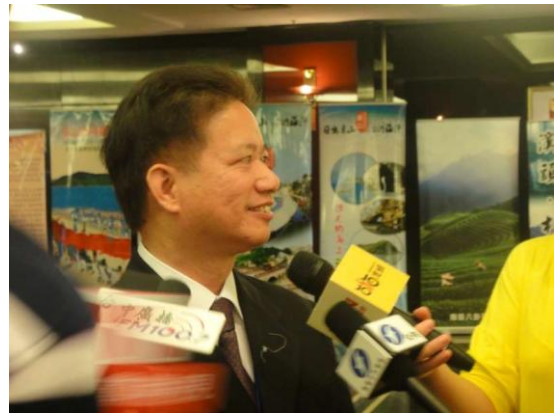
廈門旅展推介（推薦）會後 本市代表獲多家媒體採訪