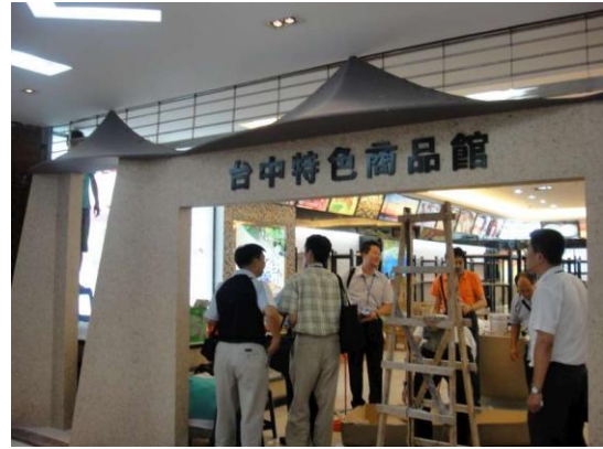
大嶠小鎮-臺中特色商品館賣場 9月5日下午勘查時現況