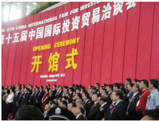
廈門旅展開館儀式