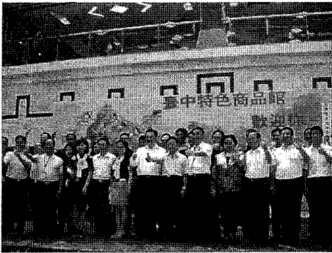
廈門市臺辦代表與本府代表團共同推介