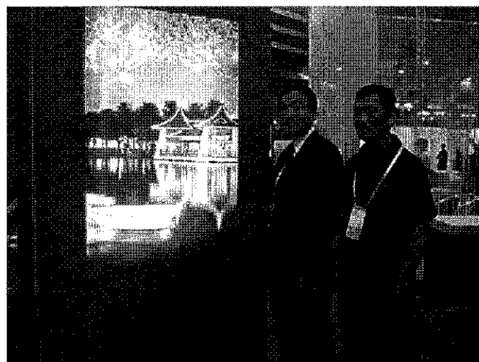
海峽旅遊博覽會中臺灣展場