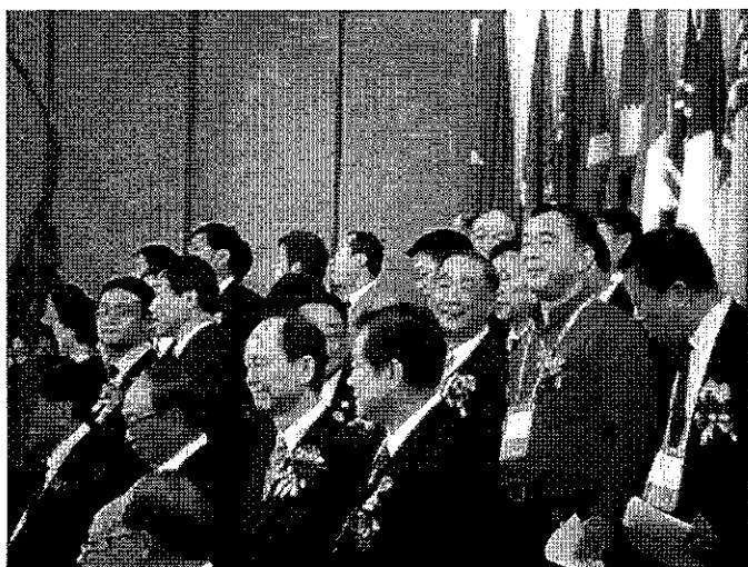
第15屆國際投資貿易洽談會開館式