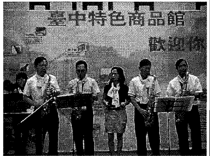
閃亮大樂團表演造勢