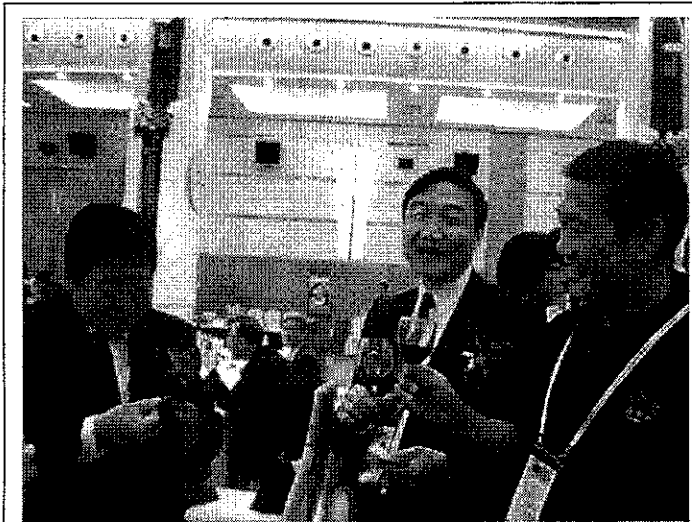
與國臺辦副主任孫亞夫互動