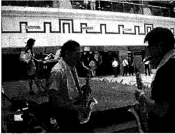
「閃亮大樂團」回饋演出