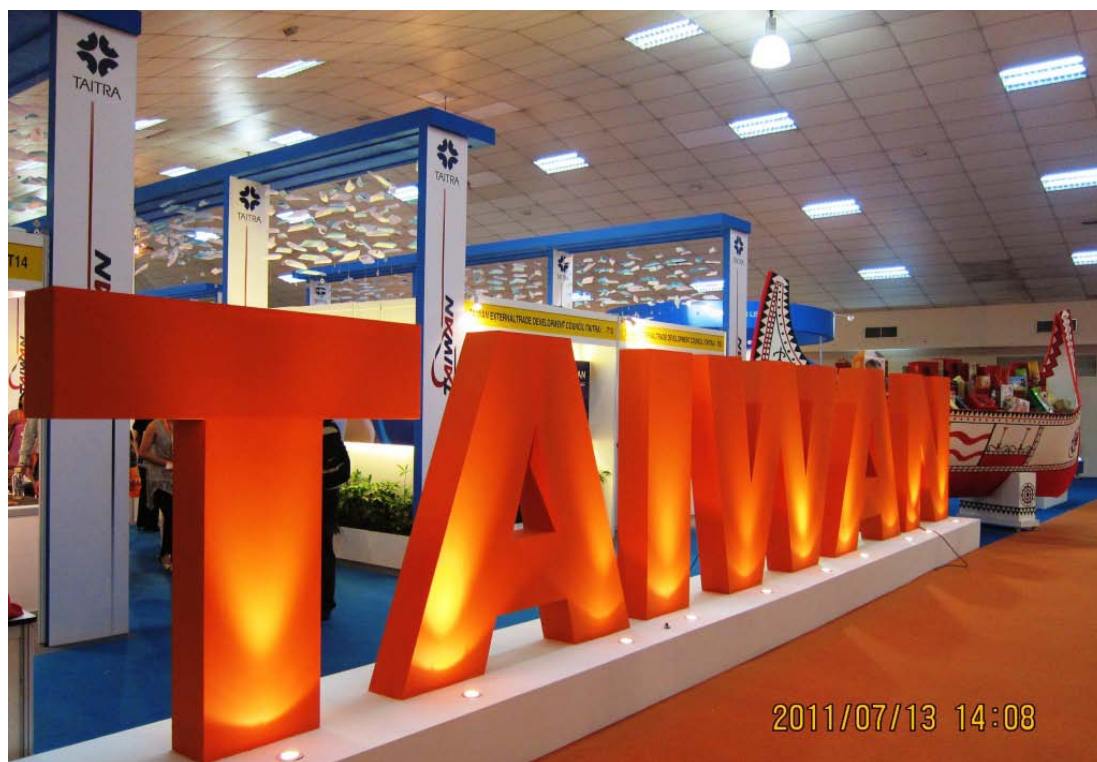
圖4 馬來西亞國際食品展臺灣館入口全貌

早上參觀傳統市場及3家超市，下午1點左右至會場，2點30分大會開幕，3點50分臺灣館開幕，6點結束第一天展覽。