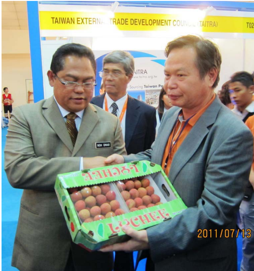
圖 6 本局蔡局長向大馬農業局局長推薦本市荔枝商品。