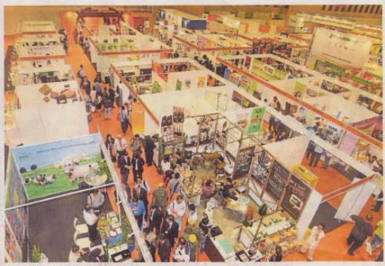
本届展出，台湾馆如同往年，吸引许多人潮。