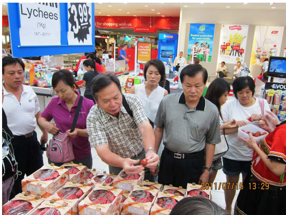
圖 10 超市行銷活動中本局蔡局長向當地民眾示範如何剝荔枝。

9點30分出發，參觀超市FairPrice倉庫，11點30分午餐，下午至2家FairPrice參加荔枝促銷活動，3點至量販店Giant參觀，5點結束行程。