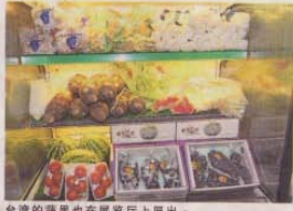
台湾的蔬果也在展览厅上展出。