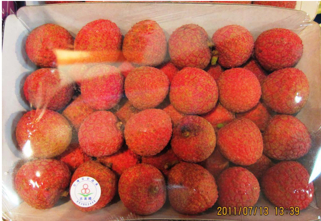
圖 13 以人工選果之果品相當亮眼，不僅色澤鮮豔，且果品未受損，賣相極佳。

七、此外，7月16日晚上與駐新加坡代表晚宴，史代表建議明年中秋節前後將在新加坡舉辦臺灣小吃活動，屆時將請本市協助相關事宜，藉此案可強力於海外行銷本市特色小吃或伴手禮，請各相關單位全力配合。