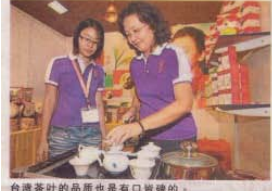
台湾茶叶的品质也是有口皆碑的。