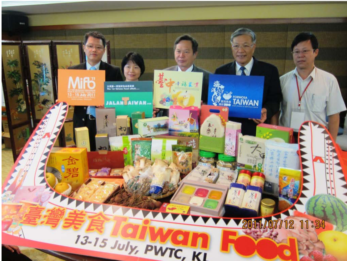
圖 2 於馬來西亞召開記者會，重申臺灣商品安全性，並為參加馬來西亞國際食品展舉辦行銷活動，希望能藉由媒體力量吸引人潮。