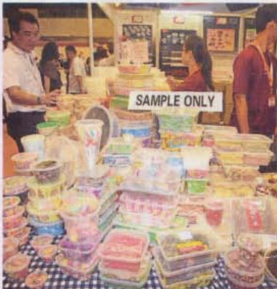
各式各样的台湾商品，可让您大快朵颐。