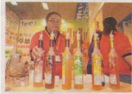
来！来！来！大家吃醋保健康。