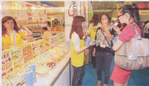
参观者纷纷品尝各种口味的饮料。