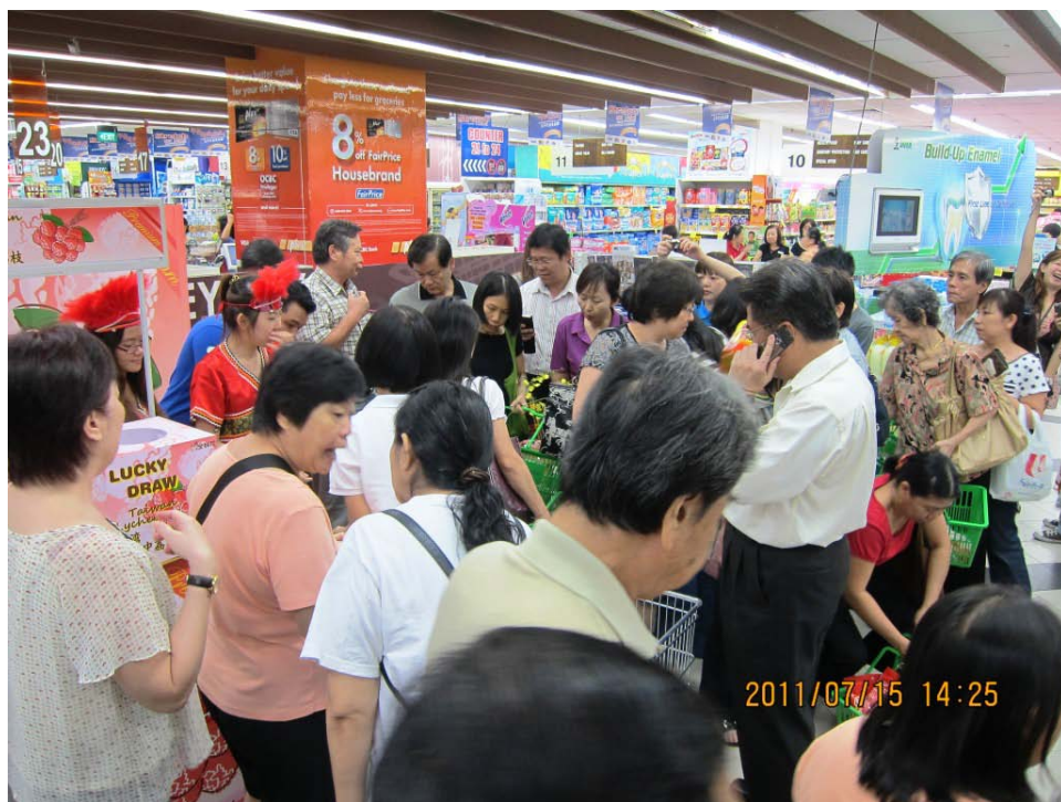
圖 11 超市行銷活動人潮眾多，本市荔枝造成搶購，促銷活動可謂相當成功。