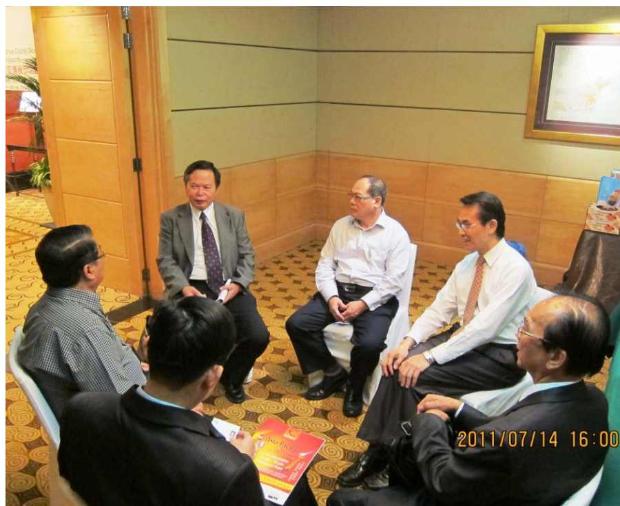
圖 9 記者會後本局蔡局長與當地貿易商洽談本市農特產。