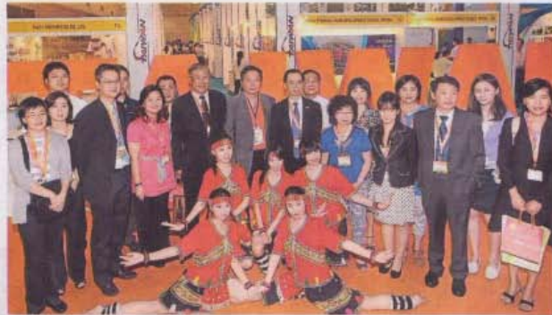
台湾馆开馆了，全体工作人员欢迎我国商家前往找寻商机。