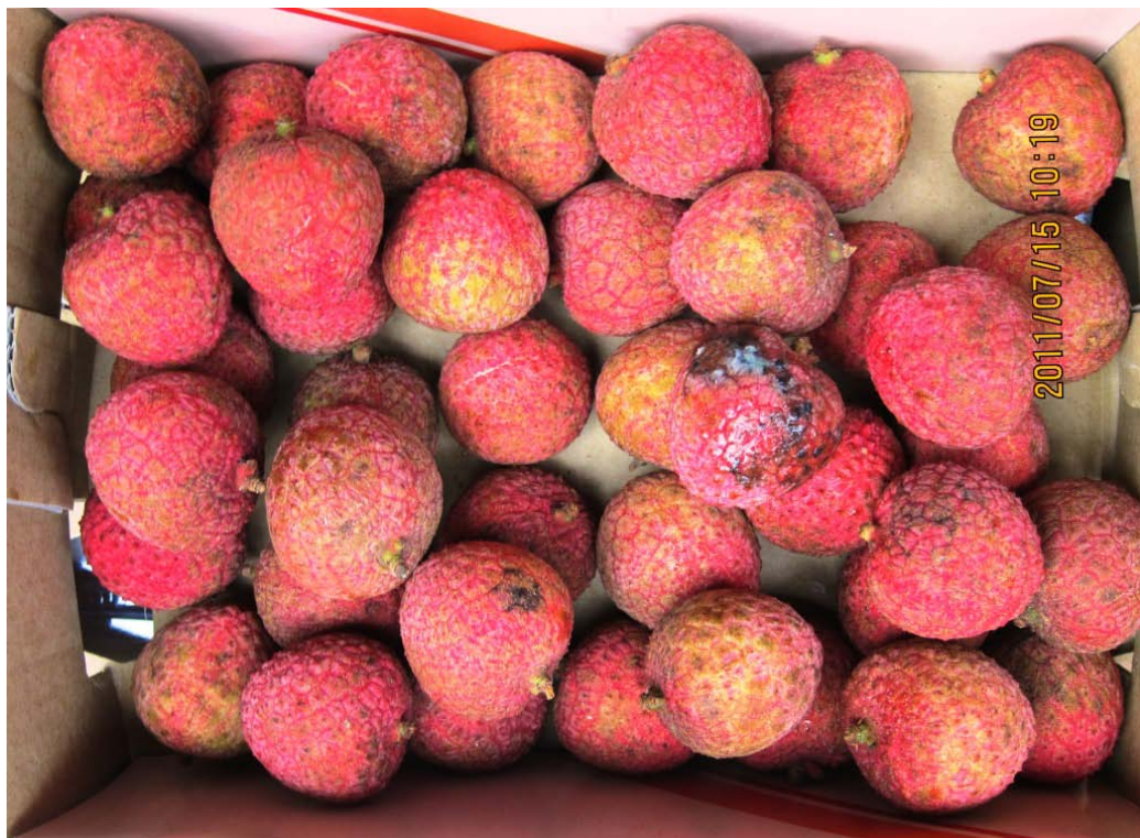
圖 12 機器選果之荔枝每盒中皆有 2-3 粒果品受損，此為未來欲大量外銷荔枝待克服之重點。

六、我們到超市業者的倉庫查看試驗性質的機器選果荔枝，發現每盒(約 40 粒)有 2-3 粒呈現發霉或不良品質，由於人工選果作業緩慢，無法在短期間內出大量訂單，又機器選果由此次試驗發現其品質仍需加強，故在此方面應再接洽農試所作技術方面的改良，以找出作業速度及品質兩者皆優的方式，才能有利於本市荔枝外銷。