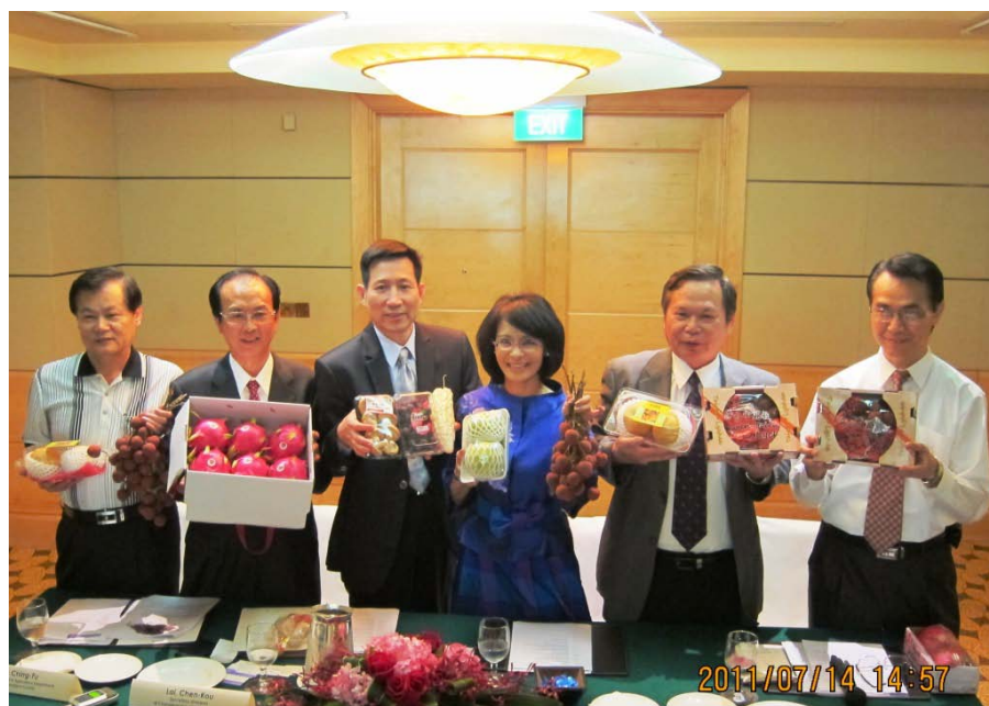
圖 8 彰化縣及本市聯合行銷新加坡記者會中，駐新加坡史代表與大家展示 2 縣市農特產品。

早上 11 點 10 分吉隆坡國際機場起飛，中午 12 點到達新加坡樟宜國際機場，下午 2 點記者會，6 點與當地超市業者交流，9 點結束行程。