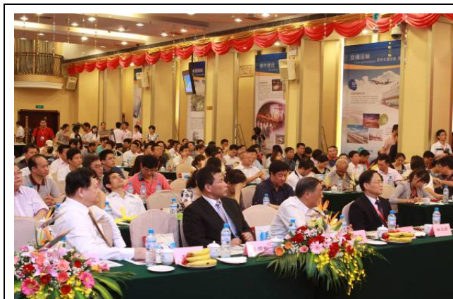
與會來賓座無虛席