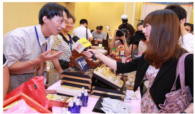
媒體採訪報導本市推介特產