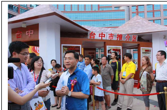
蔡炳坤副市長於本市特展館前接受採訪