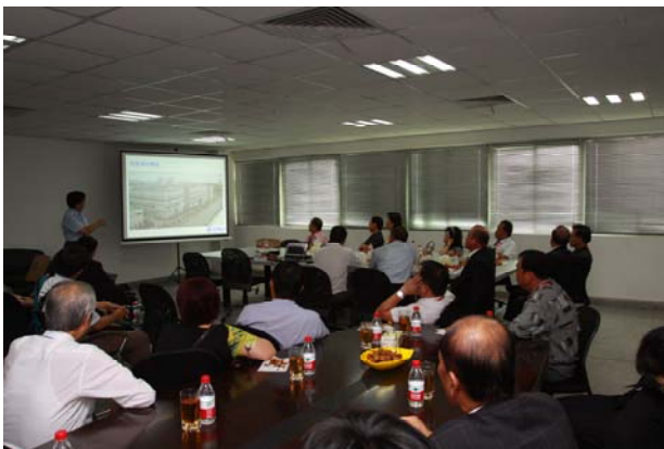
參訪廈門臺商拓凱公司