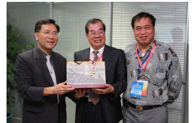
參訪廈門臺商拓凱公司