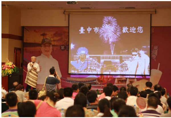
蔡副市長炳坤會中發表演說