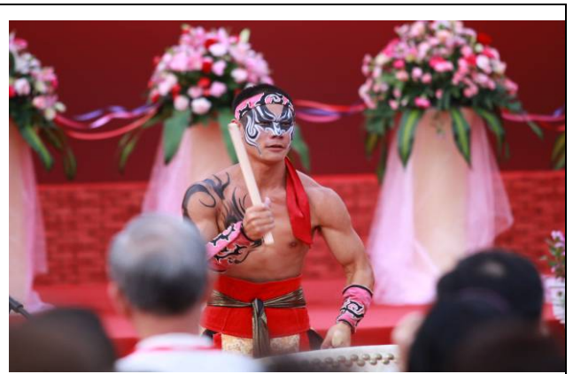
本市九天民俗技藝團於開幕式現場表演