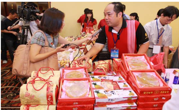
媒體採訪報導本市推介糕餅