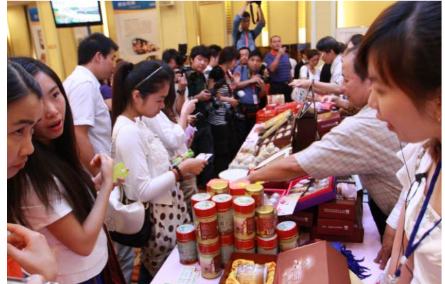
大陸民眾熱情的參加本市推介會