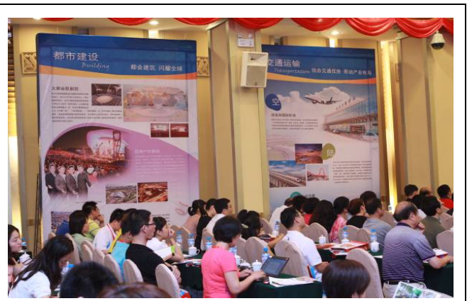
現場也以大型海報介紹臺中市的建設與交通