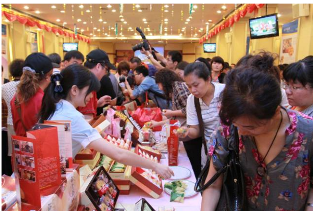
大陸民眾熱情的參加本市推介會