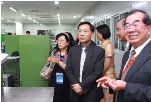
參訪廈門臺商拓凱公司