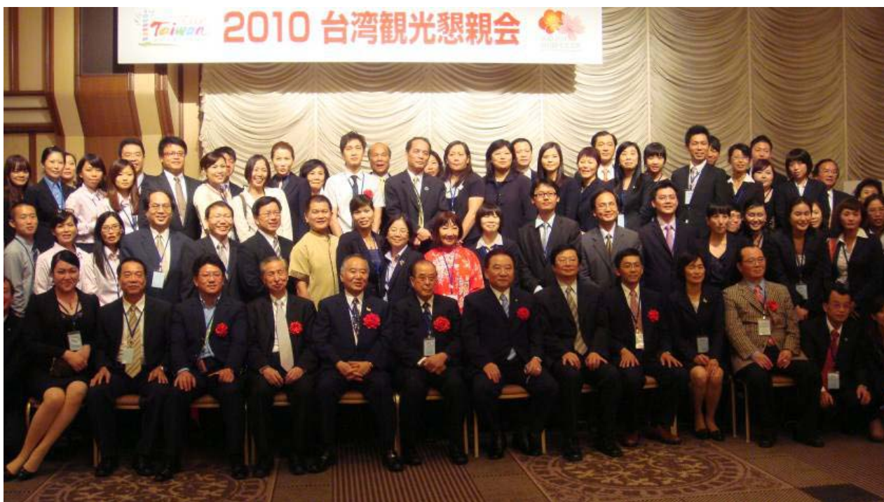
2010 年臺灣觀光說明會暨懇親會(東京帝國飯店)