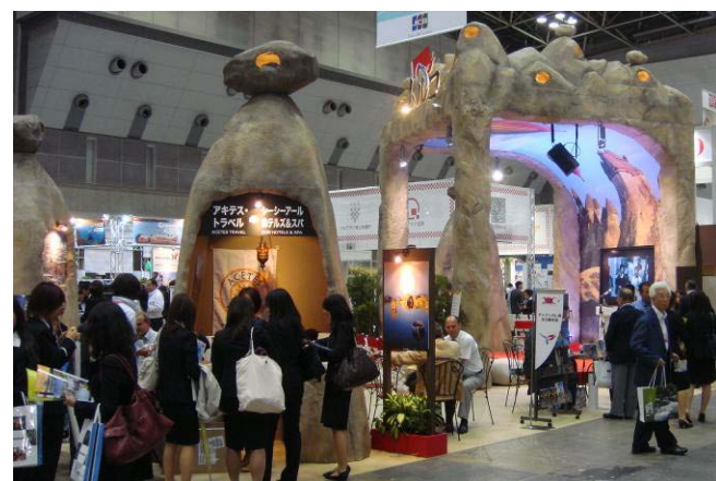
2010 年東京世界旅遊博覽會-各國展館