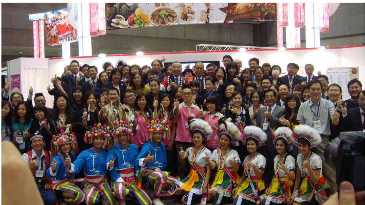
2010 年東京世界旅遊博覽會-臺灣館