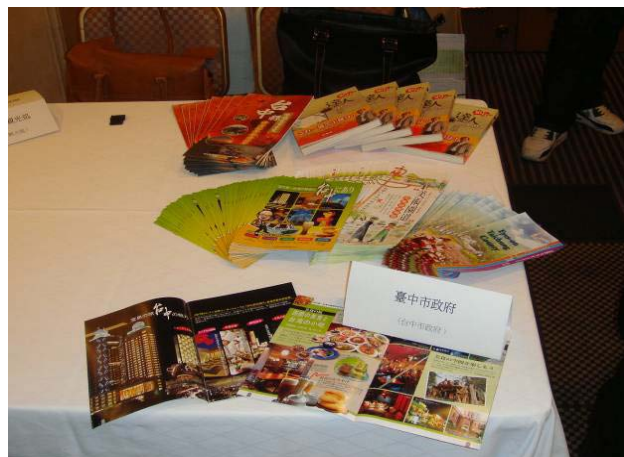
2010 年臺灣觀光說明會暨懇親會(名古屋希爾頓飯店)