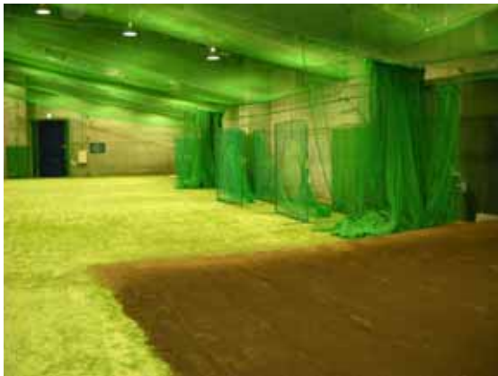
新潟市立棒球場下之地下練習場