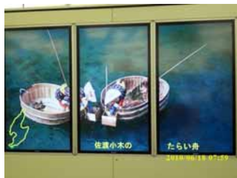
新潟港乘船區利用自動數化投影片介紹新潟之美與文化