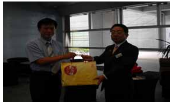
與新潟市政府代表互贈禮物