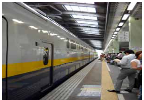
新潟站新幹線候車月台