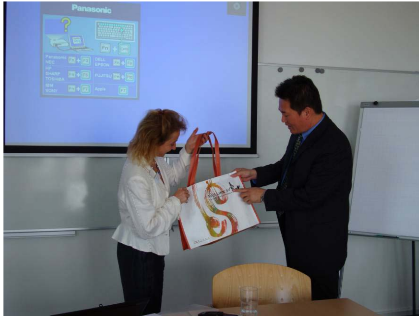
圖 13. 贈送市府環保袋及禮品予大會簡報人員