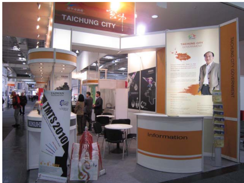
圖 10. 台中市形象館攤位位於國際大廠攤位周遭，成功吸引大批人潮