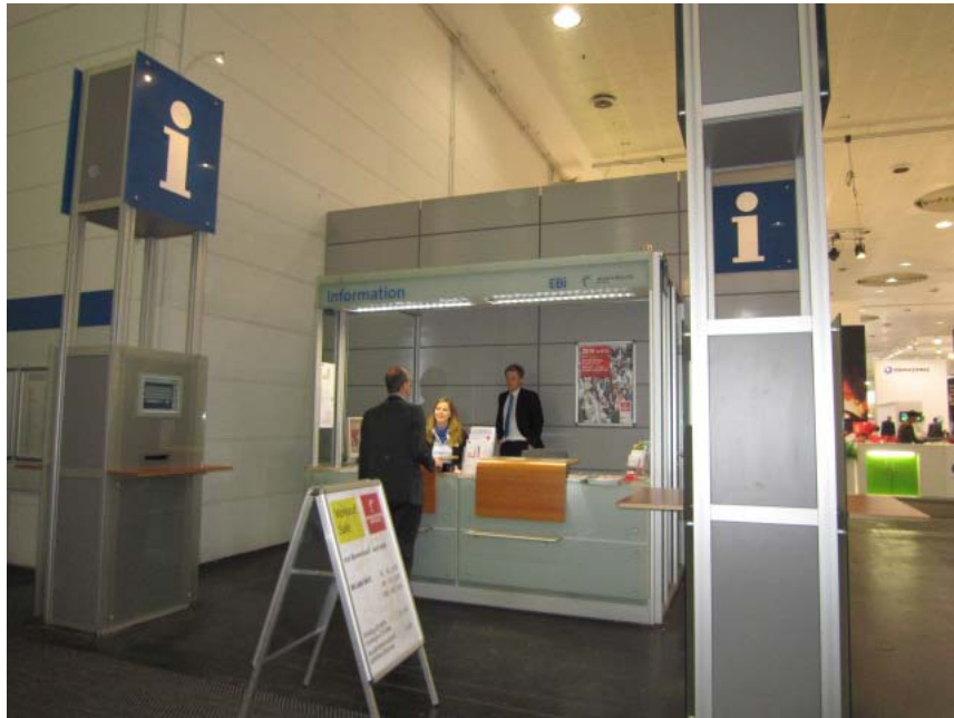
圖 7. 每個展館皆設置服務台