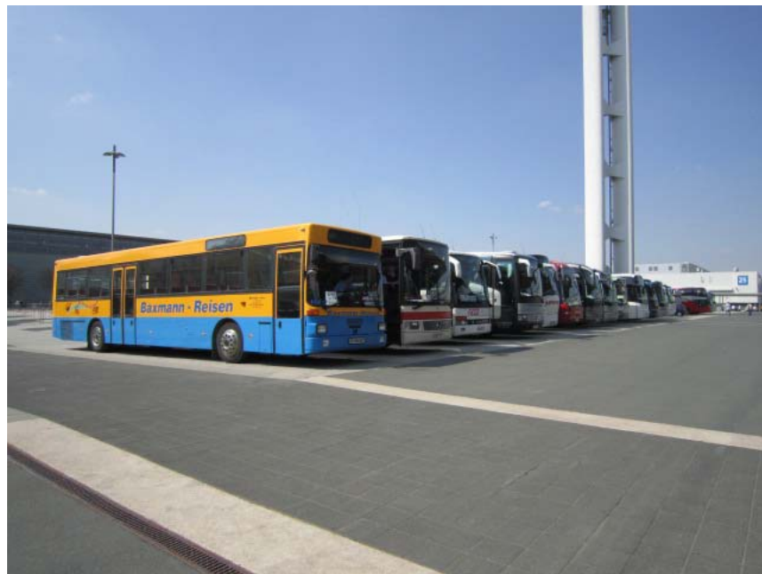
圖 6. 廣大停車場吸引大批人潮之參訪團