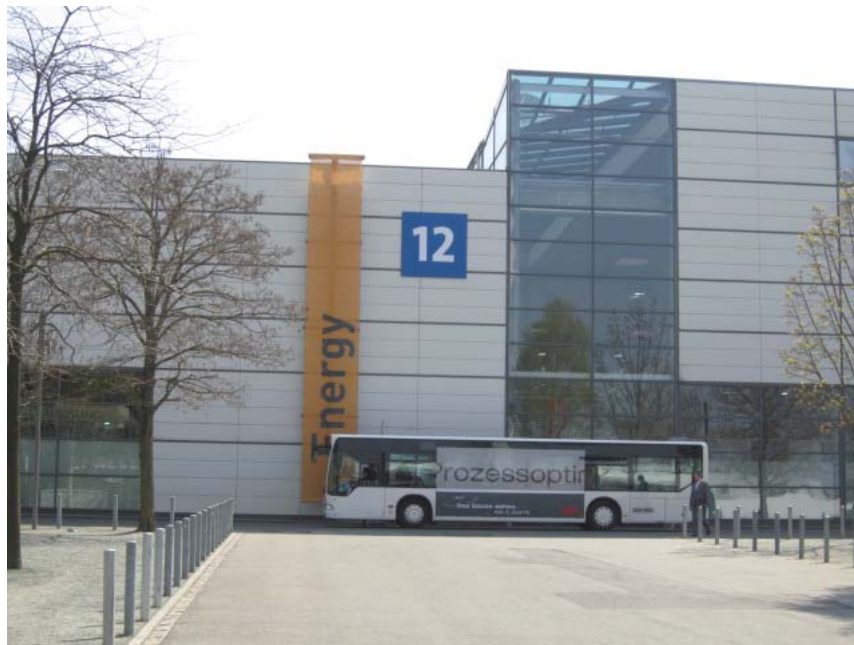
圖 4. 各個展館廣大，大會提供接駁車往返各展館