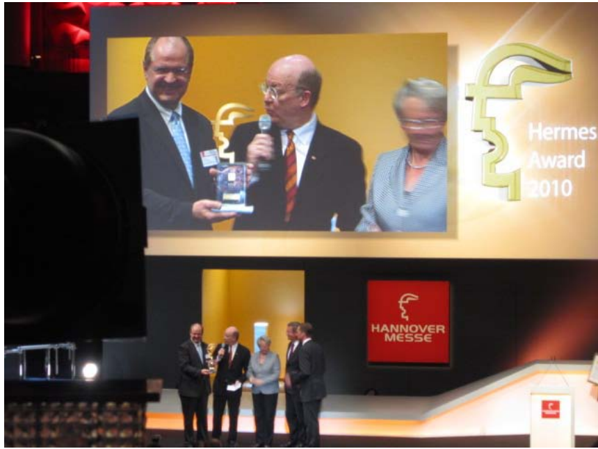
圖 3. 鼓勵業界創新而舉辦的海默斯大獎(Hermes Award 2010) 頒獎典禮