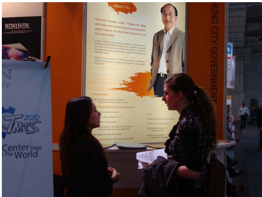
圖 14. 訪客洽詢台中市政府事宜