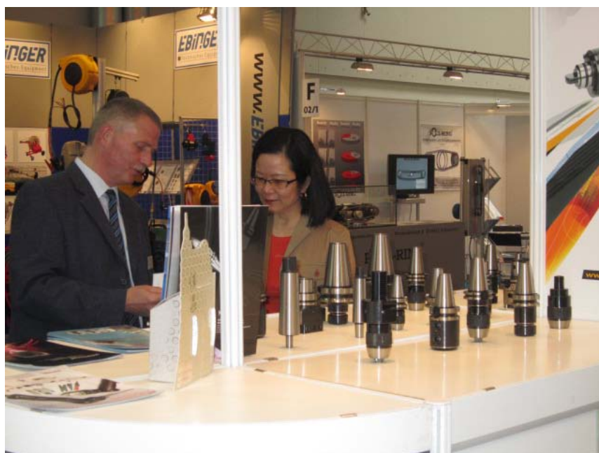
圖 11. 攤位訪客洽詢