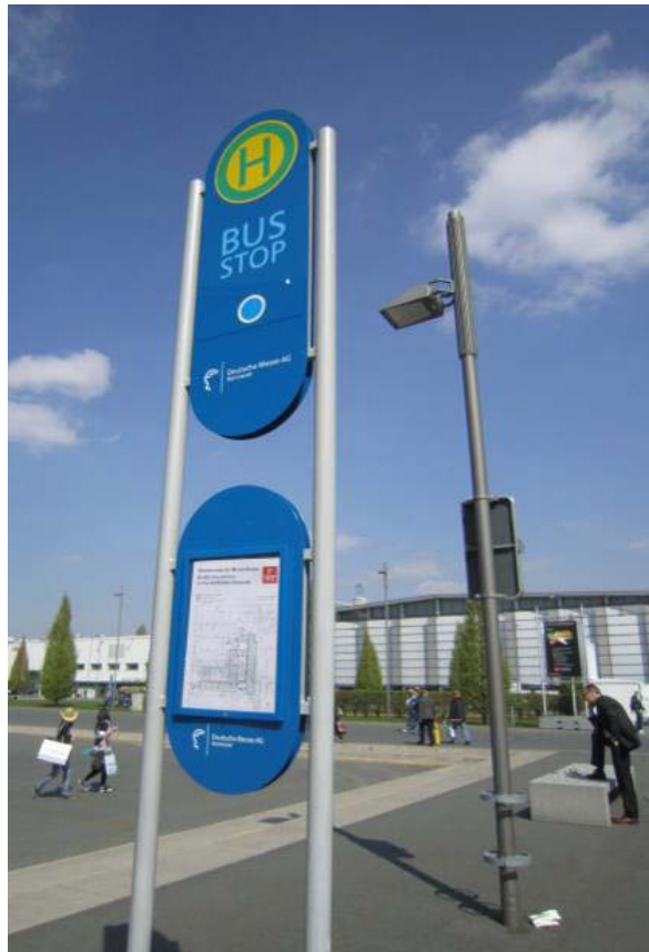
圖 5. 接駁車站牌，路線標示清楚