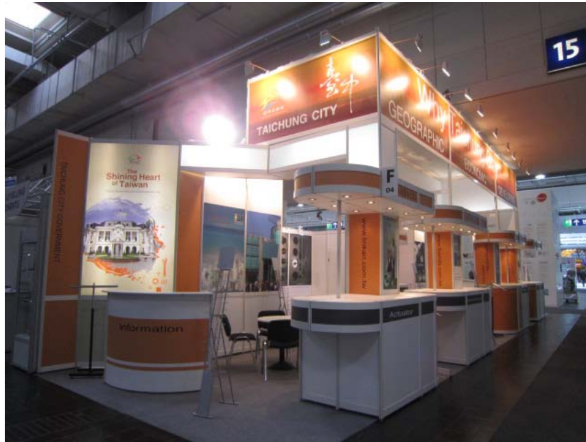
圖 9. 台中市形象館攤位設計亮麗顯眼