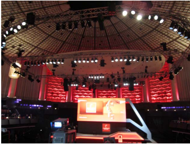
圖 1. 開幕典禮舞台設計