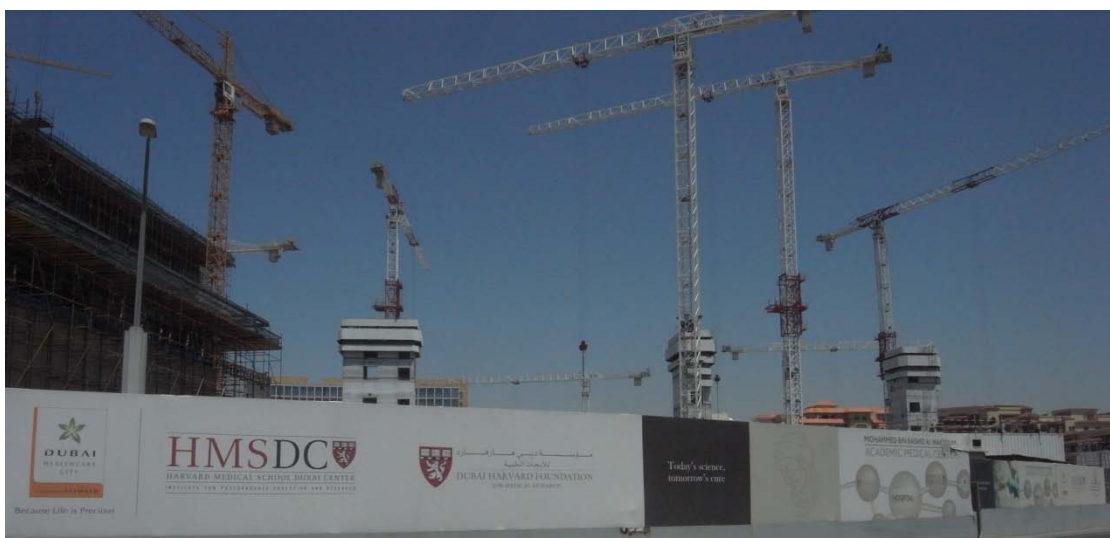
杜拜堪稱全世界最大的工地