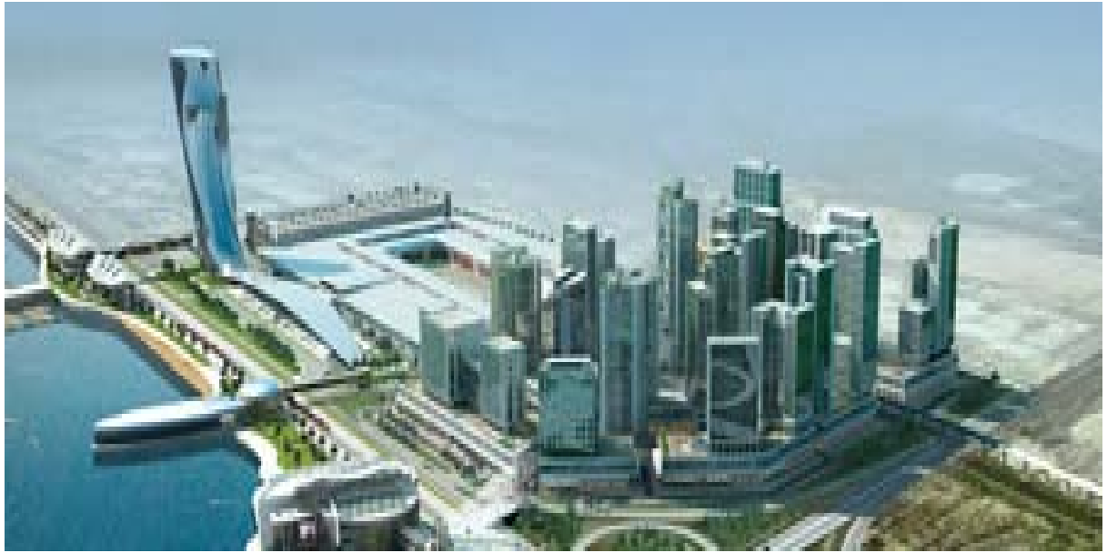
Capital Centre and Capital Gate 3D 模擬