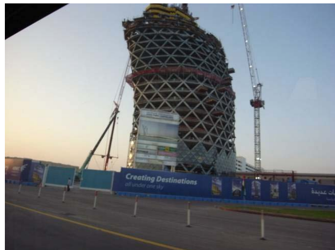
阿布達比「首都之門 (Capital Gate)」的高塔工地