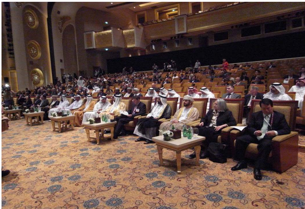
全球城市論壇會場