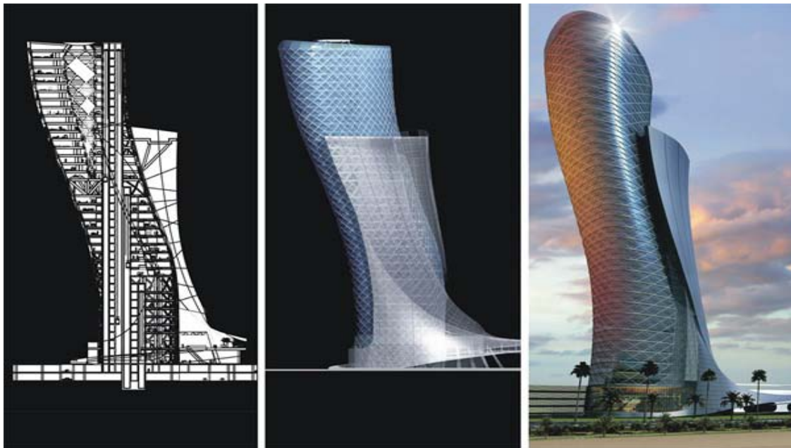
Capital Gate 3D 模擬