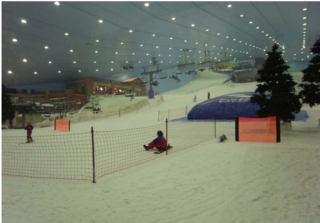
棕櫚島的盡頭：亞特蘭提斯旅館