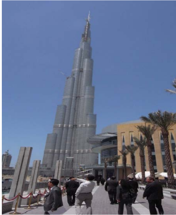
即將於 2009 年 9 月 9 日完成的杜拜塔