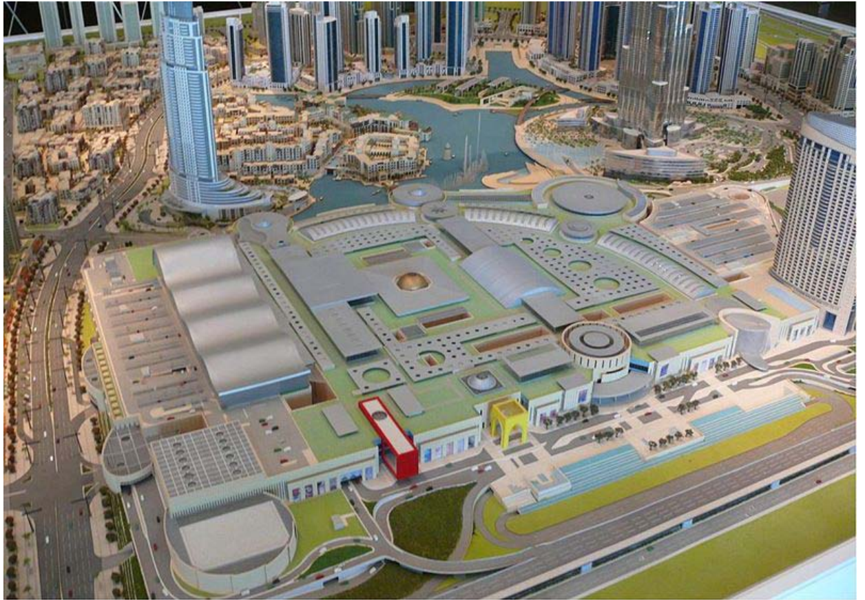
杜拜塔整體開發計畫模型