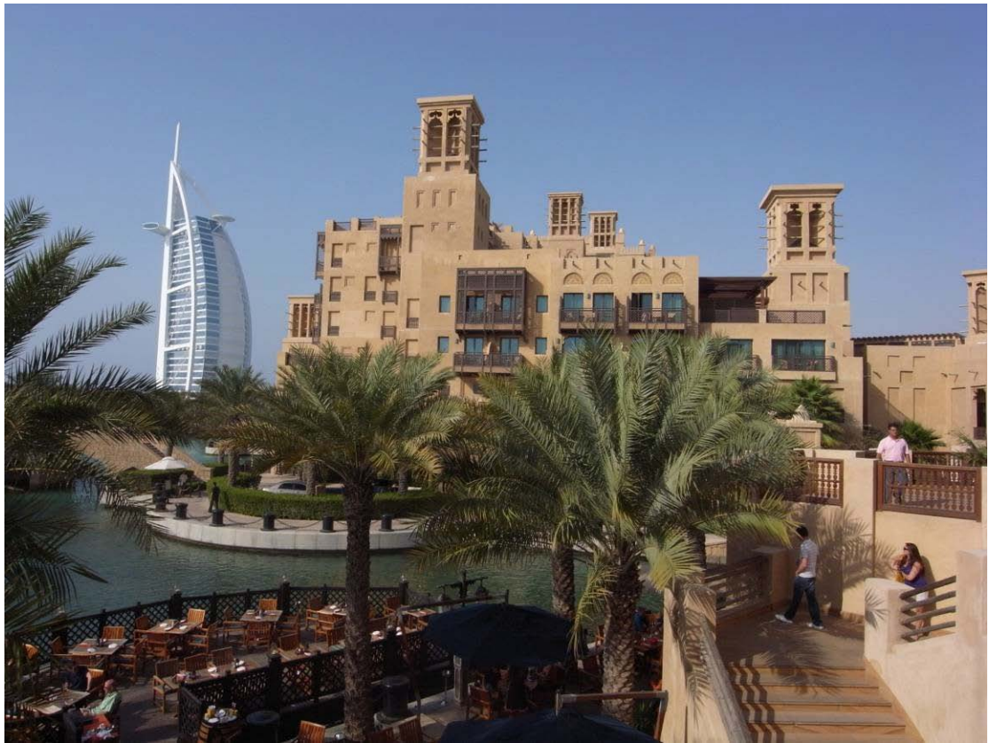
全球城市論壇會場