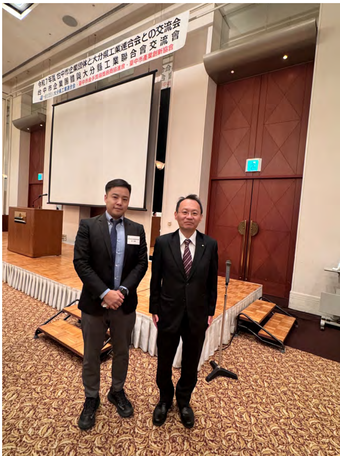
林副總幹事與大分縣桑田龍太郎副知事合影。