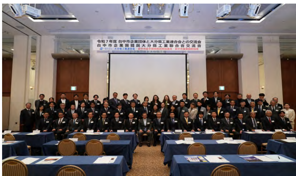
交流媒合會會前全體合影留念。