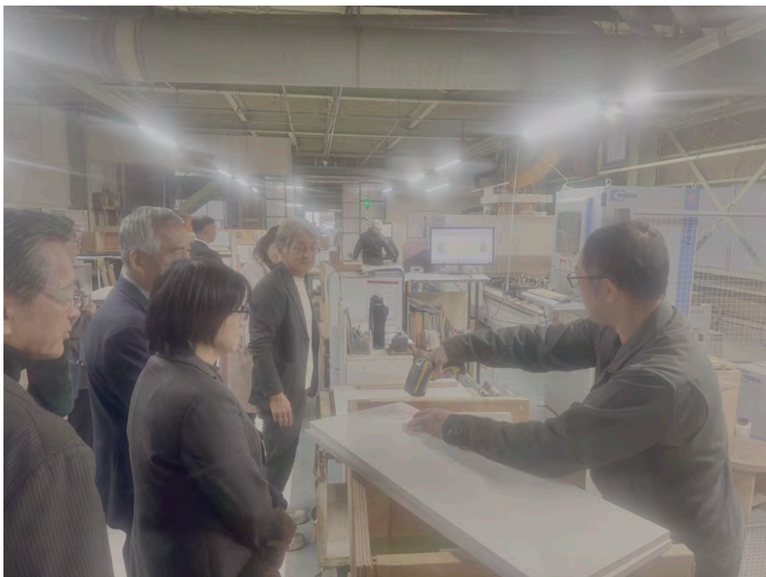
團員於田中工藝工廠參訪。