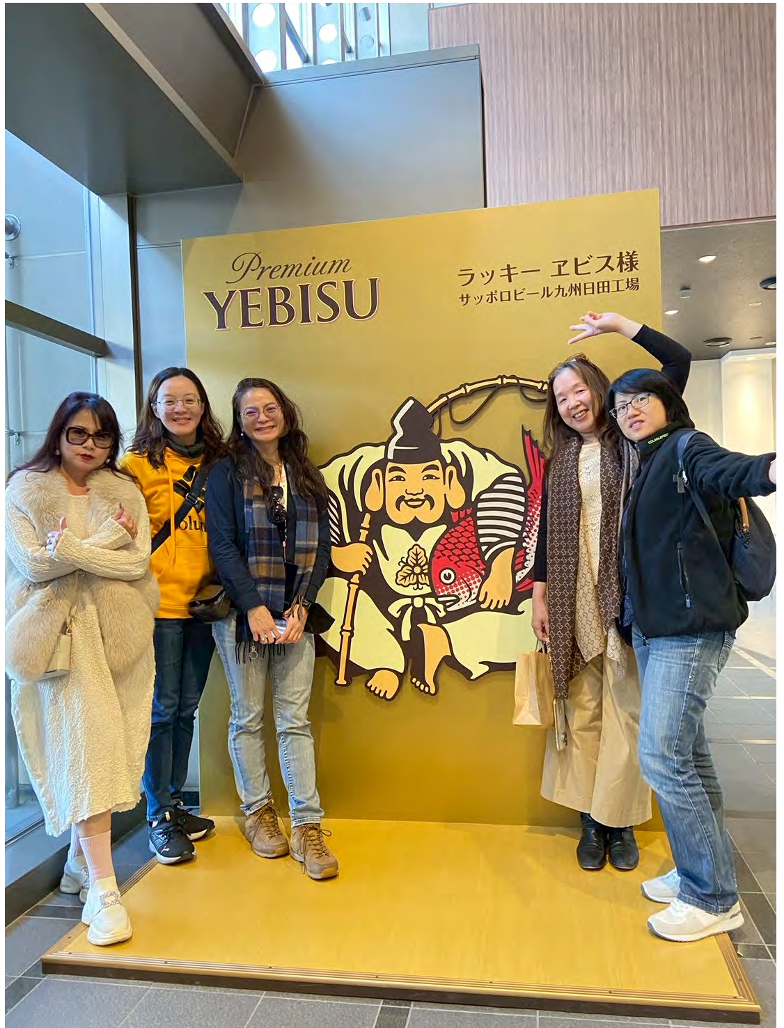
團員於 SAPPORO 啤酒工廠合影。