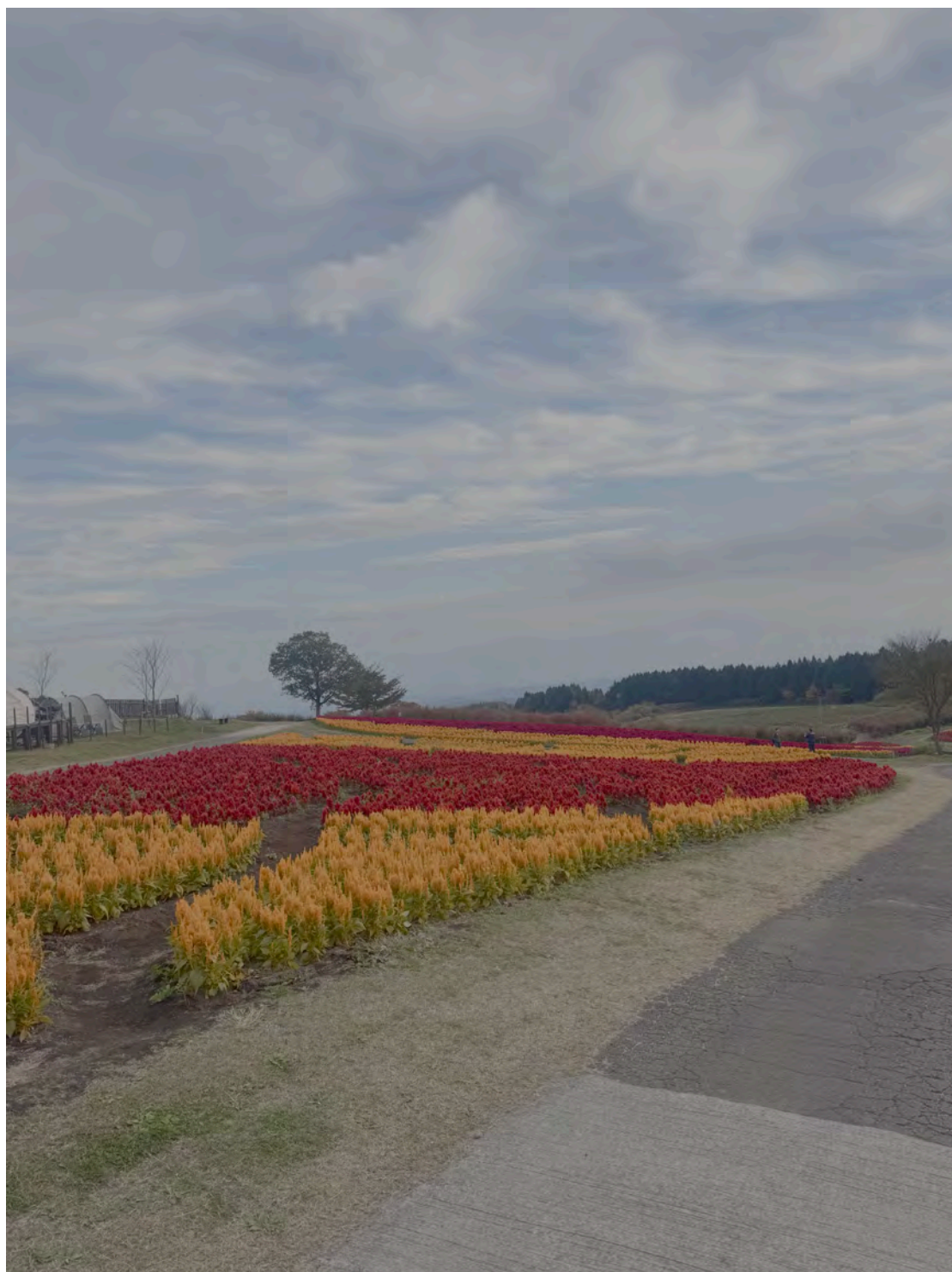
久住花公園風景一覽。

久住花公園：本次適逢冬季平日，小部分景觀花草枯萎凋零、遊客較為稀少，但整體維護程度仍有值得台灣學習之處。融合露營帳篷與花園交錯是台灣較少見的設計。