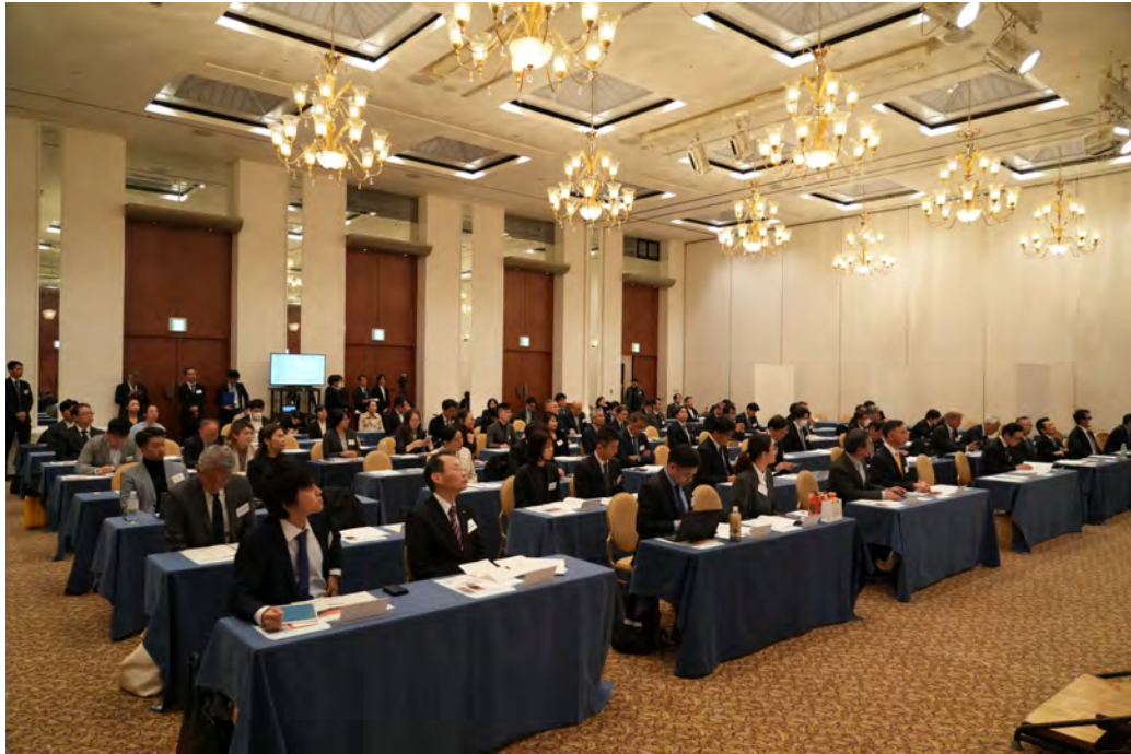
交流媒合會會場側拍。