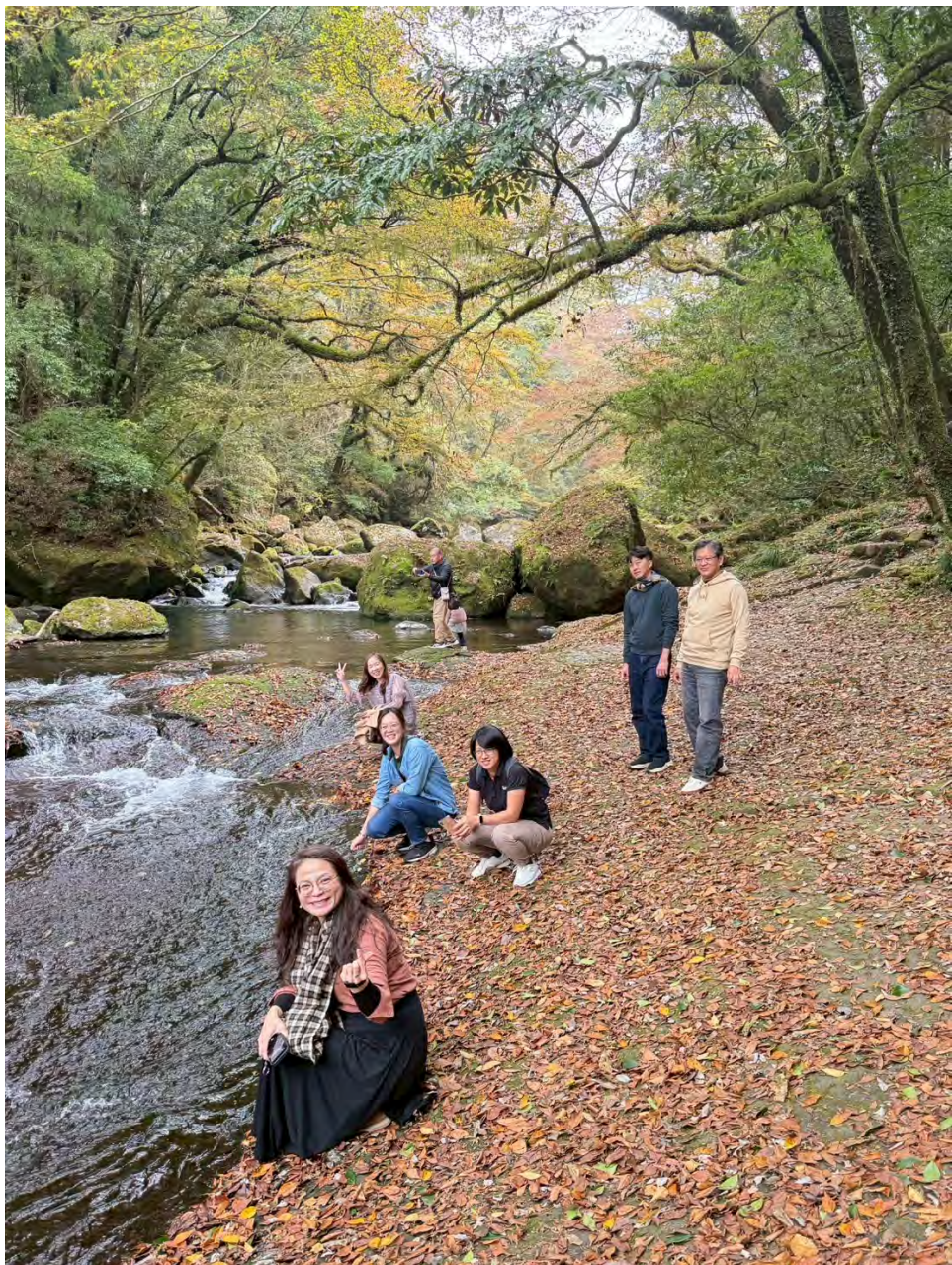
團員於菊池溪谷合影。

菊池溪谷：遊客如織、景色秀麗，小型工班駕車四處修繕，也可見園區步道沿途維護之用心。