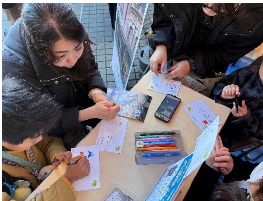
「從台中寄明信片到日本活動」廣受好評，獲得日本民眾熱烈回響