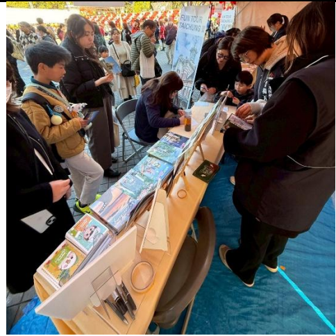
現場展攤擺設觀光景點及活動資訊