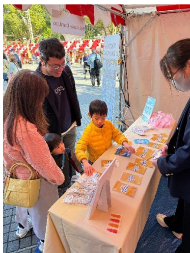
日本民眾於攤位體驗翻牌