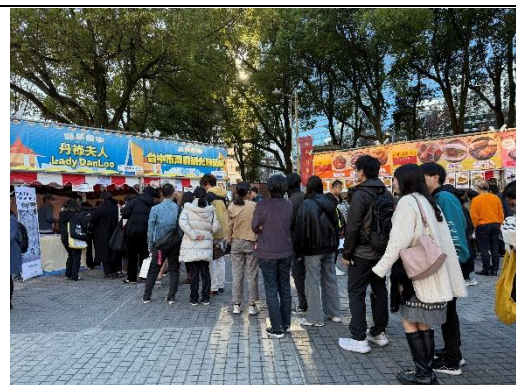
2025年台灣台中夜市人潮聚集於台中攤位前參加活動