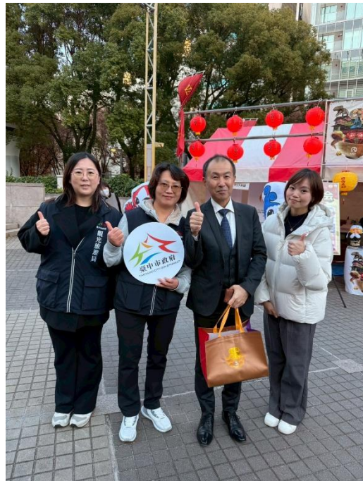
與名古屋觀光文化交流局佐治局長 合影並致贈伴手禮