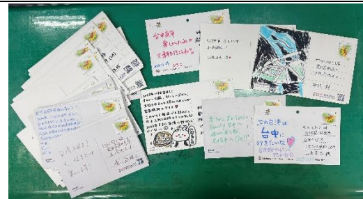
「從台中寄明信片到日本活動」廣受好評，獲得日本民眾熱烈回響