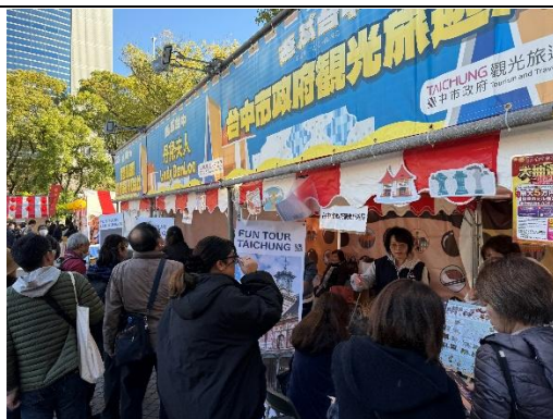
2025年台灣台中夜市人潮聚集於台中攤位前參加活動