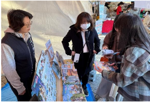
觀旅局團隊介紹台中景點及活動