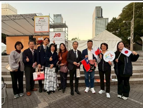
觀旅局代表與主辦方及台灣辦事處代表合影