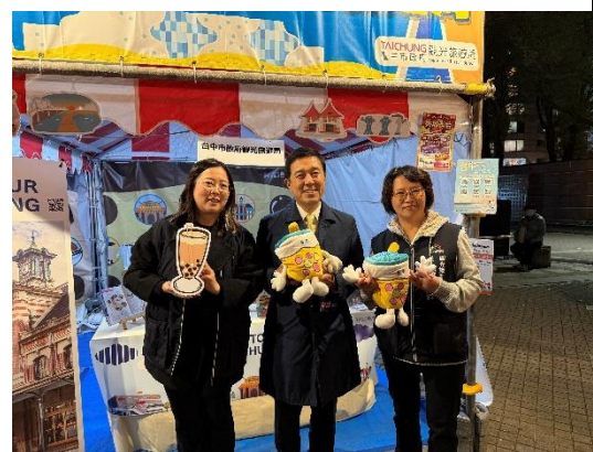
與名古屋市長合影並致贈伴手禮