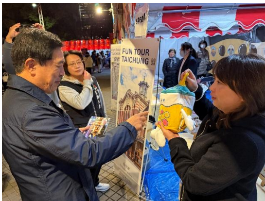
名古屋市長廣澤市長參訪本局展攤