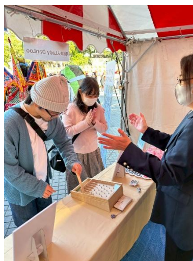
日本民眾於攤位體驗彈珠台