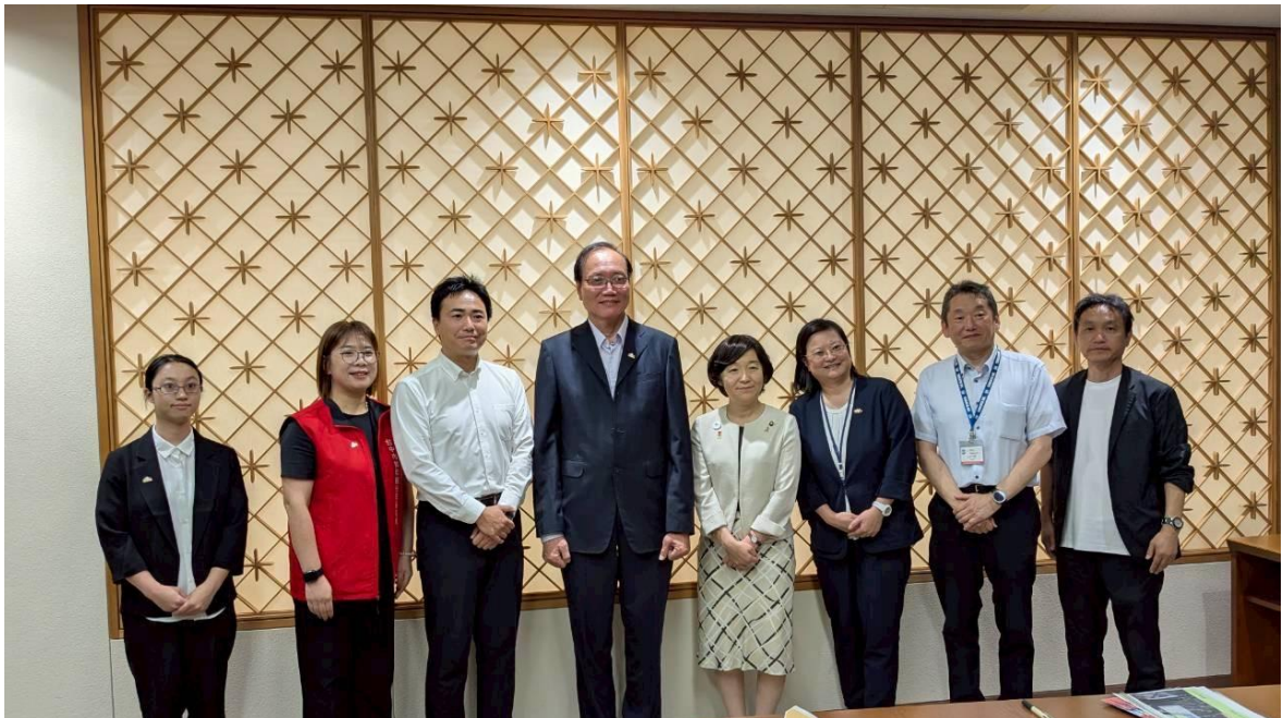
代表團拜會酒田市矢口明子市長、安川智之副市長

於當日下午約 5 時 10 分，陳參事全成率團拜會酒田市矢口明子市長及安川智之副市長，酒田市地域創生部池田郁雄部長全程陪同。會談中，日方對本市代表團來訪表達熱烈歡迎，並介紹酒田市的觀光資源、城市特色及相關服務設施。本局代表則就觀光推廣策略與雙方交流合作提出關注與期待。整場拜會在輕鬆、融洽氛圍中進行，有助於深化兩市彼此了解，並為未來觀光合作奠定良好基礎。