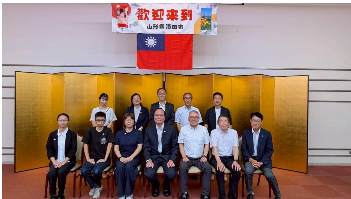
酒田市府等單位舉辦歡迎晚宴