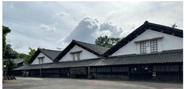
山居倉庫及櫟木道