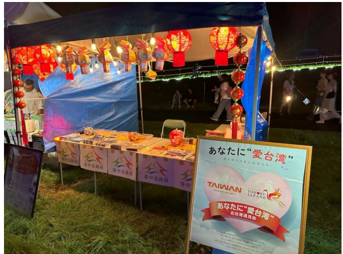
酒田市為臺中市特別設置宣傳展攤