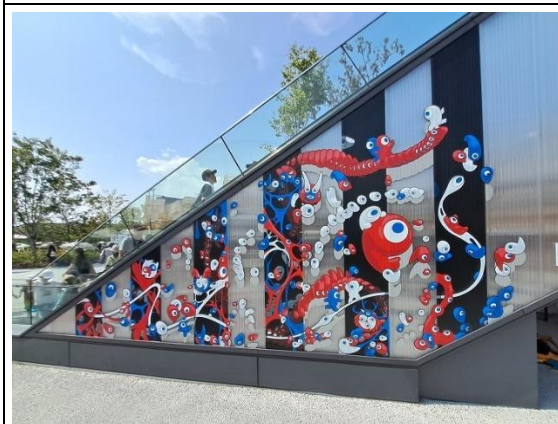
以「脈脈」為概念的藝術設計