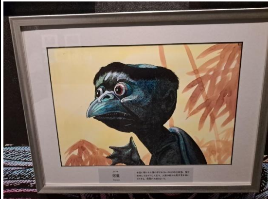
水木茂紀念館內展示作品-河童