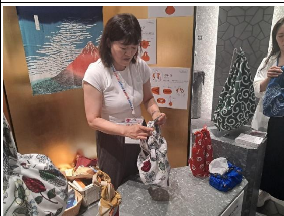
關西館京都府-包袱巾使用法