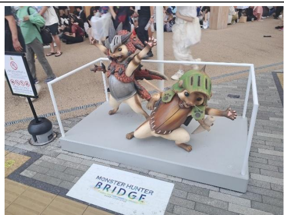
知名遊戲《魔物獵人》角色塑像