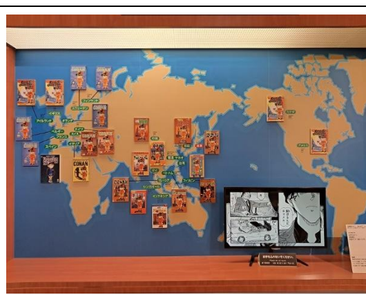
柯南漫畫在世界各地的版本