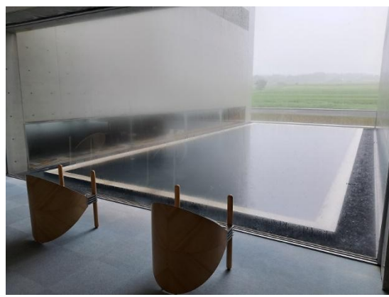
植田正治寫真美術館