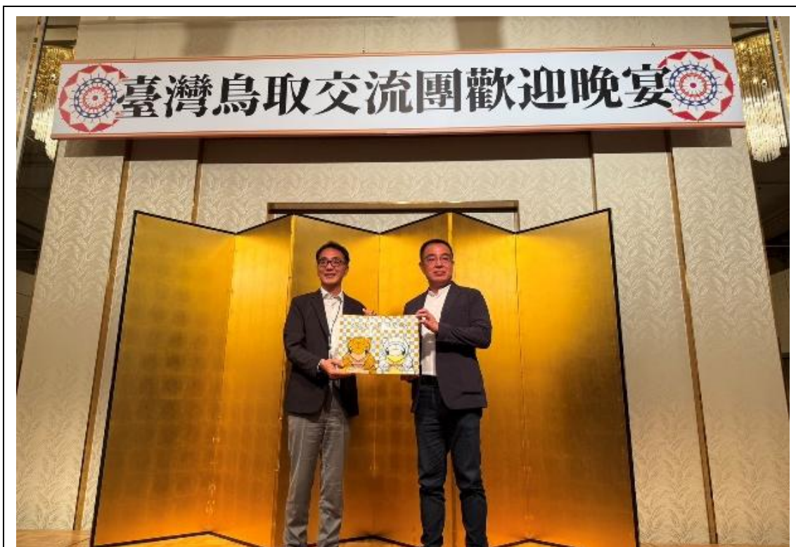
與田口局長互贈禮品