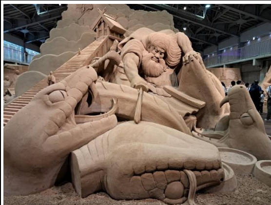
砂之美術館砂雕作品