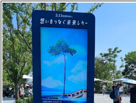
紀念 311 震災的數位互動設施

日本作為 2025 世界博覽會的主辦國家，也藉由這次機會展示其科技、文化、藝術、觀光等軟實力，進一步提升國際影響力。例如吉祥物「脈脈」的設計象徵文化傳承與延續、人類文明之間的連結與國際間的交流等概念，奇特造型也吸引世界各地參觀者的目光；大型木構造物「大屋根環形迴廊」以及在會場各地展示的動漫遊戲角色，都是日本向國際行銷軟實力的表現。