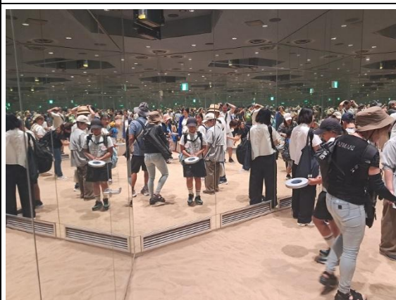
關西館鳥取縣-「無限砂丘」