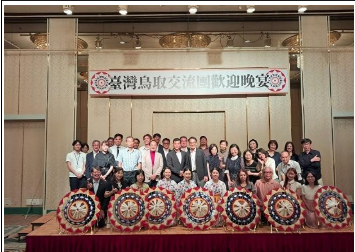
交流團與日方合影