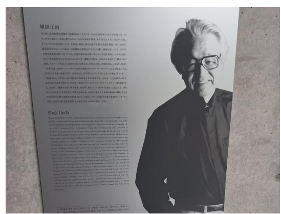
植田正治生平介紹