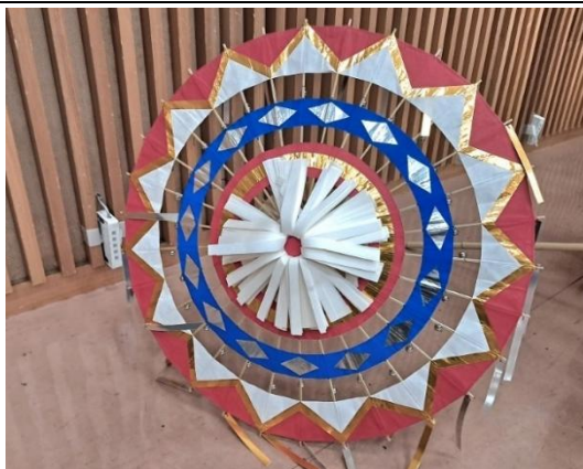
傘舞使用之「鏘鏘傘」

鳥取鏘鏘傘舞祭是鳥取縣最知名的祭典，為了準備參加晚上的祭典，上午來到鳥取縣廳，由鈴音大使指導交流團成員練習 2 組傘舞動作。下午參訪位於鳥取市的鳥取砂丘及砂之美術館，鳥取砂丘是山陰海岸地質公園的一部分，東西長達 16 公里，面積約 16 公里，其中最高的砂丘「馬之背」是最著名的景點。接著參觀鄰近的砂之美術館，砂之美術館展期為每年的 4 月中旬到隔年的 1 月初，每年都會設定不同國家作為主題，今年配合大阪的世界博覽會，將主題設定為「日本」。為了迎接新的主題，在休館期間就必須將原作品破壞，重新創作新的作品，也呼應日本「一期一會」的概念。