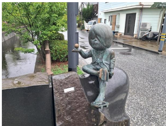
水木茂大道上的鬼太郎銅像