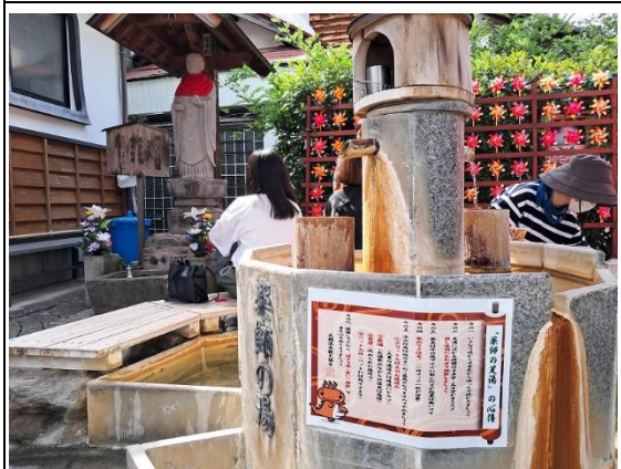
足湯-「藥師之湯」 能在上方取水口直接取水飲用