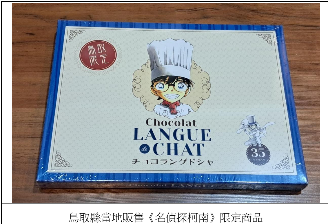
鳥取縣當地販售《名偵探柯南》限定商品