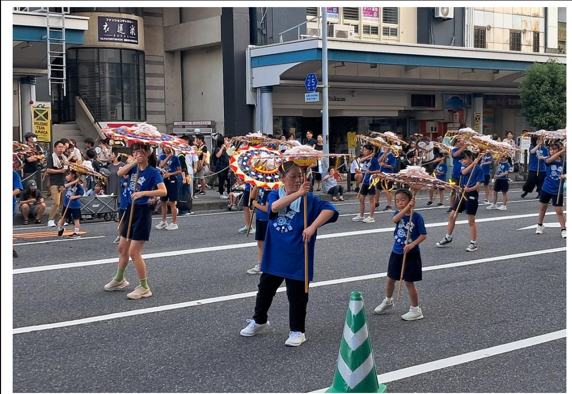
不同年齡層的市民都參與到祭典中

此外，主辦單位為了確保祭典的秩序及安全，對於隊伍的人數、編排、每首歌曲的行進距離都有詳細的規定；針對正值盛夏的祭典，每隻隊伍都配有裝載飲水和運動飲料的推車跟著，也對參加者及觀眾充分告知預防中暑的注意事項。