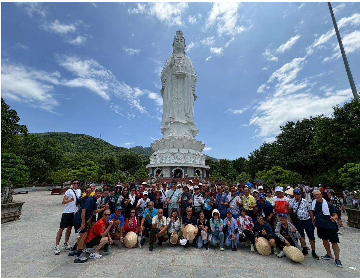
圖 15：團員於山茶半島觀音像前合影