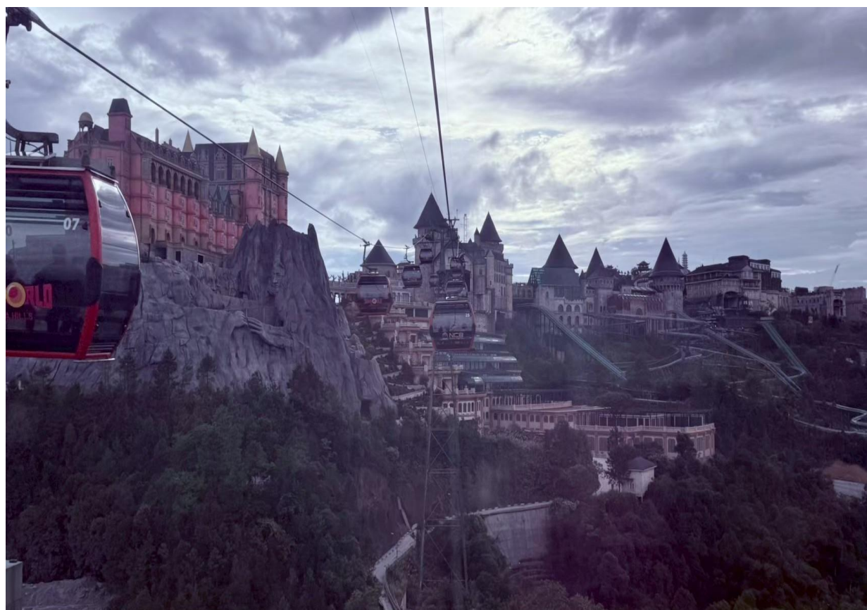
圖 13：搭乘世界著名纜車前往巴拿山及日蝕廣場