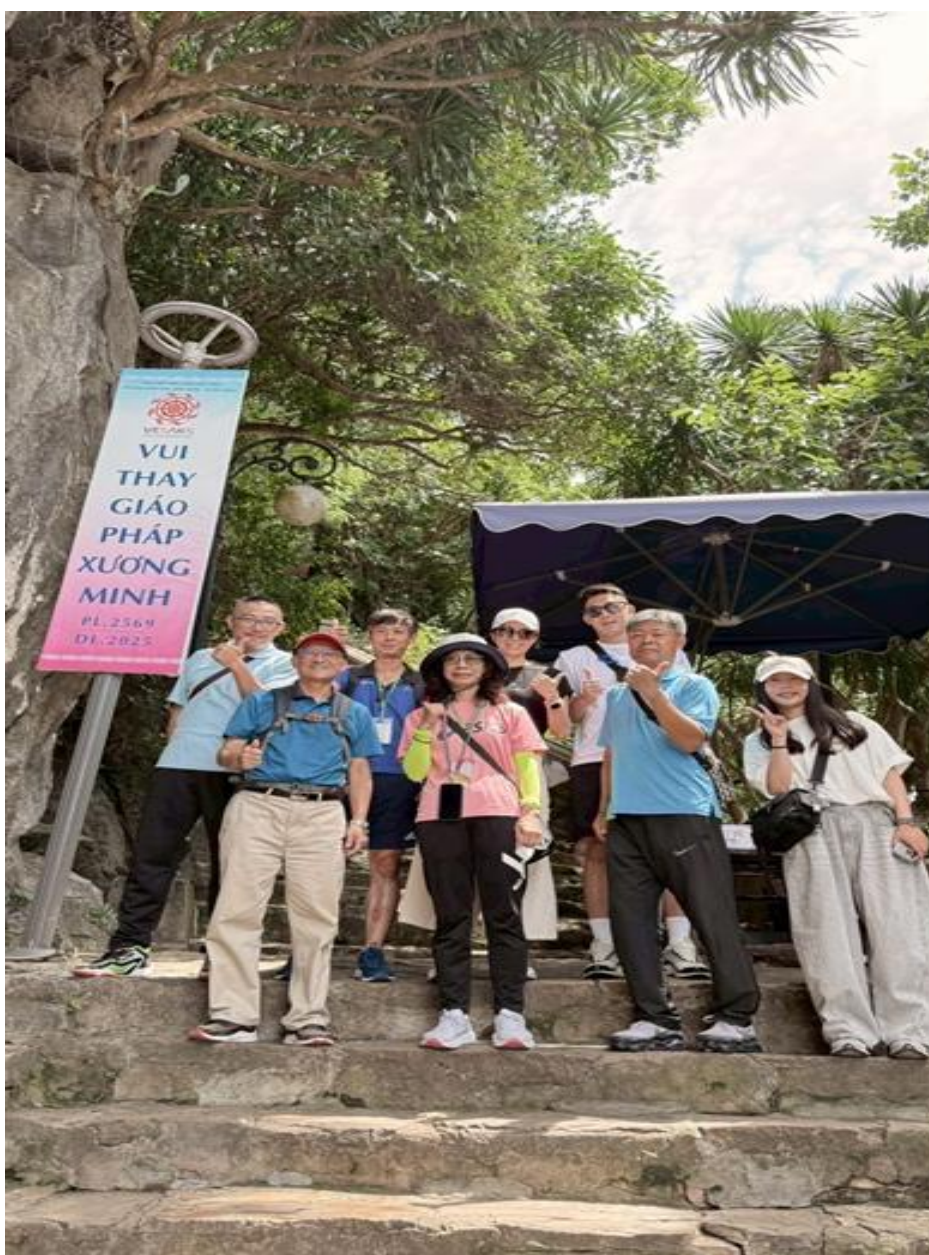
圖 7：五行山登山健行與宗教巡禮

五行山由五座高數十公尺的石灰岩石峰所組成，分別代表五行裡的金、木、水、火、土，所以被命名為五行山。因當地曾出產玉石，所以又叫大理石山，英文名稱為 Marble Mountain；其最大山頭是水山，也是最主要的參觀重點。上頭有兩座觀景臺，東邊是望海臺、西邊是望江臺，一邊可眺望海岸、另一邊可眺望漢江景色；藉由以健行結合觀光的方式，提升運動風氣。