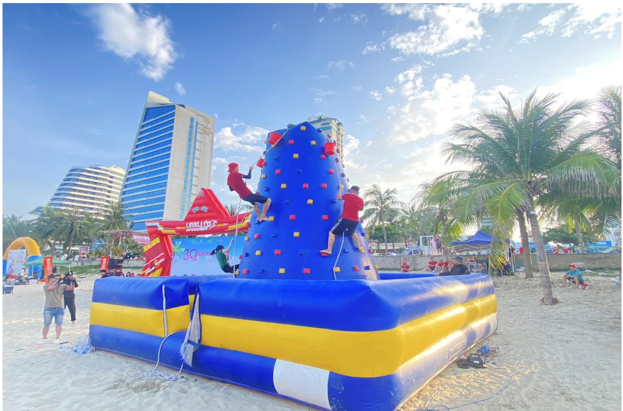
圖 19：企業進行員工運動會競賽