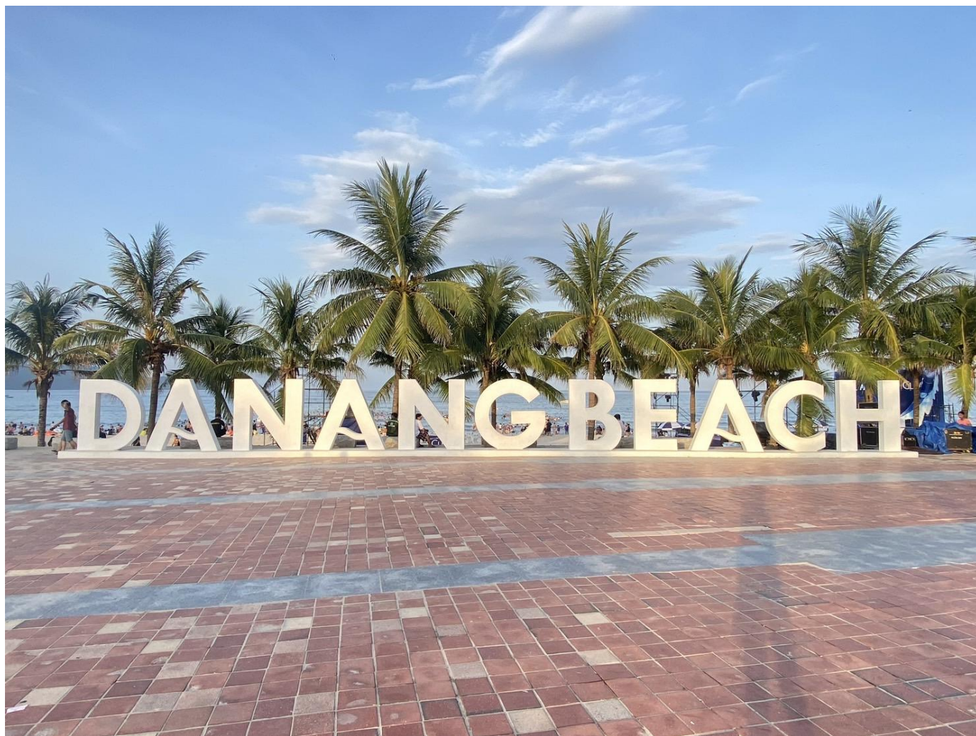
圖 17：著名景點美西沙灘

此外夜間的韓江觀光區，沿岸設有步道、景觀橋與商業設施，為峴港推動城市河岸觀光的重要據點。夜間搭乘遊船夜遊韓江，沿途欣賞燈光設計與沿岸都市景觀，實地體驗峴港如何將水岸觀光與夜間經濟相結合。。