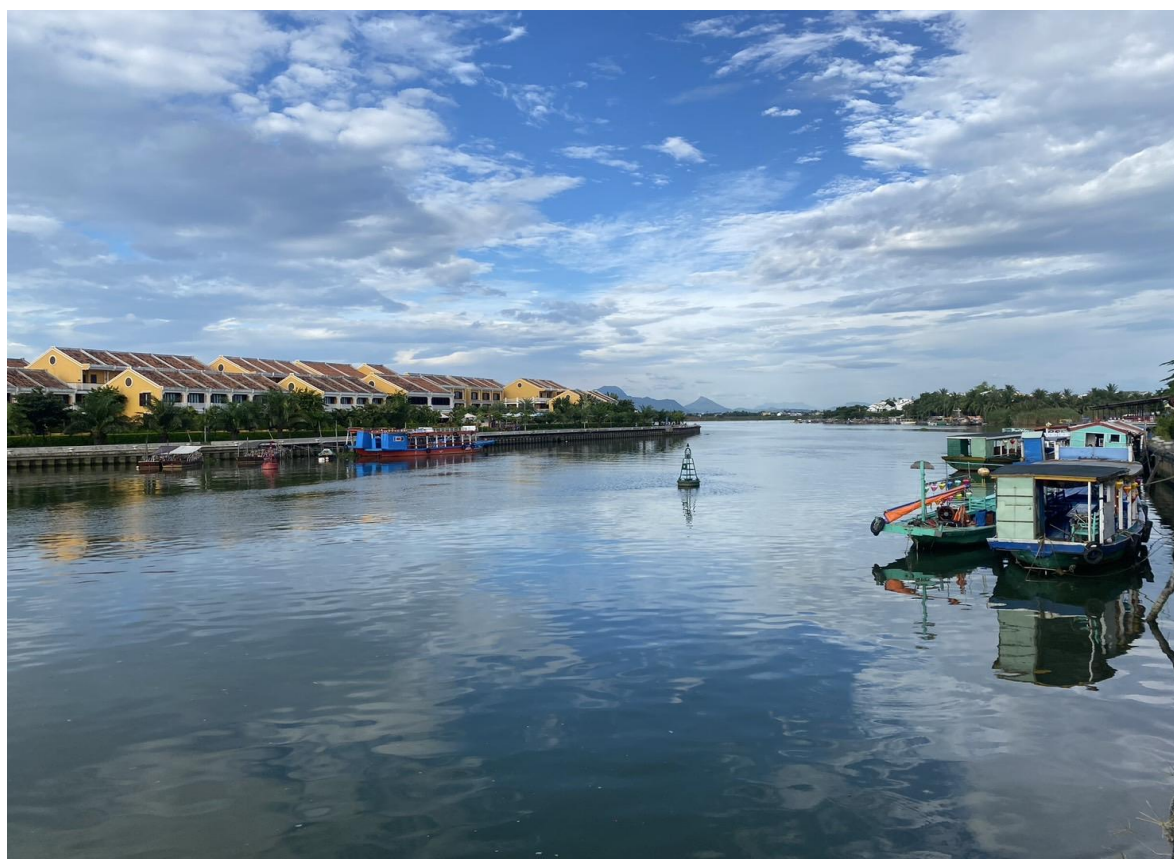
圖 6：惠安古鎮水域全景