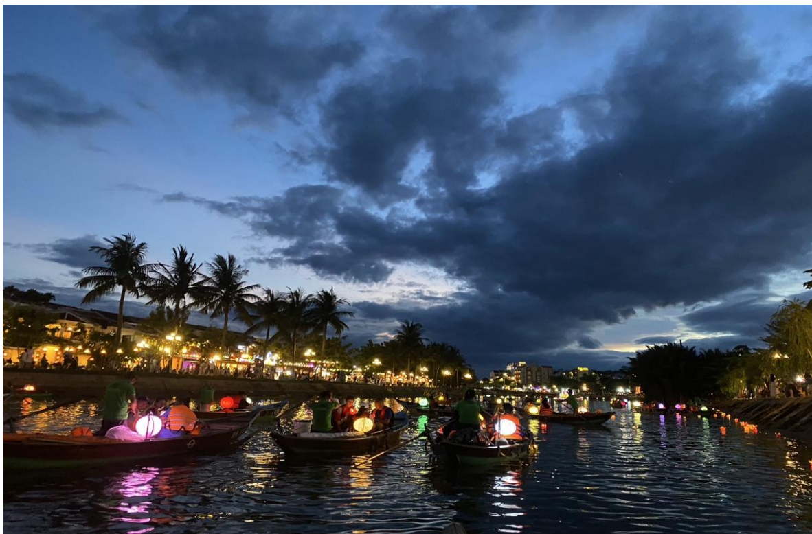
圖 5：惠安古鎮搭乘船隻夜遊祈福