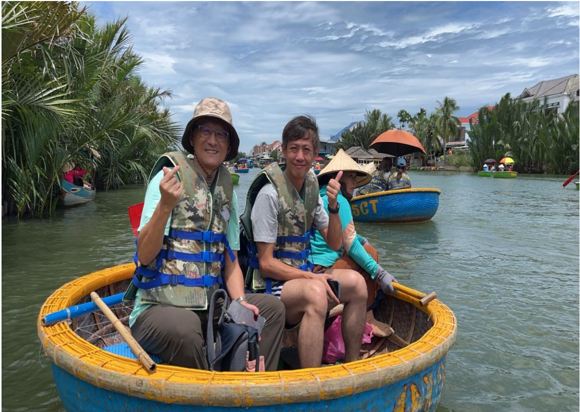
圖 2：峴港市迦南島搭乘碗公船