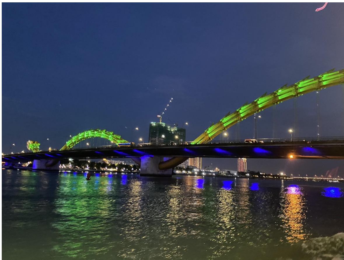
圖 20：夜遊韓江行經著名景點-龍橋