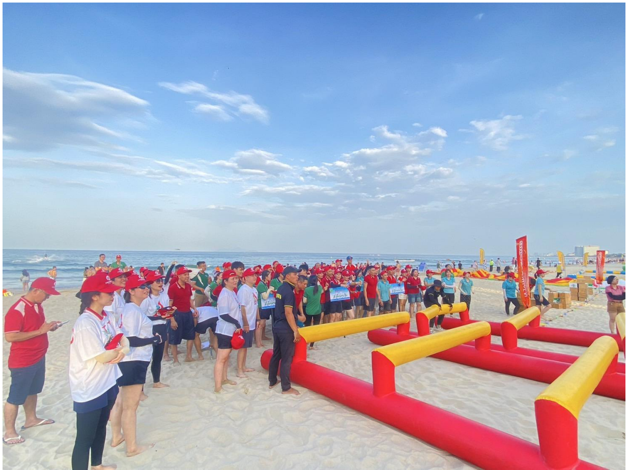
圖 18：企業在此勝地舉辦員工運動會