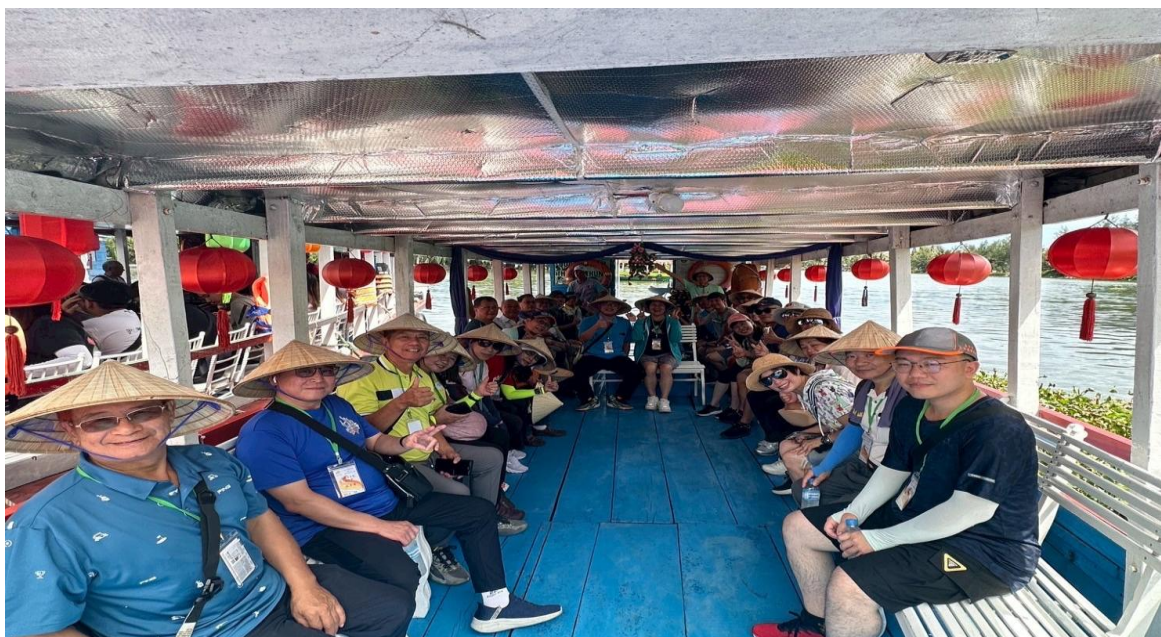
圖 1：全團人員搭乘接駁船隻前往迦南島

上午前往距峴港不遠的 迦南島 （Cam Thanh），搭乘當地傳統竹製「籃筒船」（Thung Chai），這種船是迦南島竹藍船又稱簸箕船、碗公船、桶船或是越南水上咖啡杯，名字非常有趣，竹籃船原本是當地漁民在近海捕魚用的小船，以竹條編制，堅固又不失美感，同時可以就近觀賞高速旋轉木桶船的表演，實地觀察越南沿海生態環境與漁民生活型態。此旅遊模式兼具教育與體驗性，具高度觀光發展潛力，未來可思考導入結合臺中水域運度的觀光項目，增加多元性。