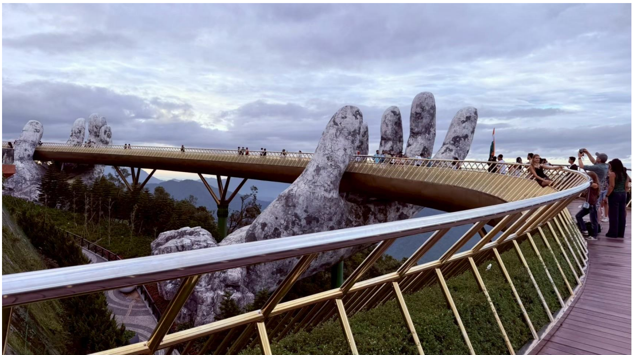
圖 8：巴拿山知名景點佛手橋

景點分為上、中、下三大區域；上層景點有法國村、軌道車 LUGE、茶館、靈峰禪寺以及奇幻公園；中層景點有佛手橋、花園、酒窖、小火車及靈應寺；下層景點則有會安花園並且為纜車起點；最著名的就是纜車，曾經是世界紀錄「世界最長纜車系統」、「世界起落點海拔落差最大的纜車系統」，纜車長度長達 5,801 公尺；著名的佛手大橋自 2018 年開始營運，特殊造型為峴港地區地標，石質大手其實是玻璃纖維打造。