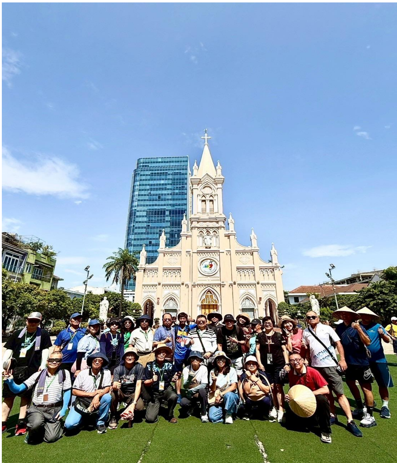
圖 16：參訪團走訪粉紅大教堂