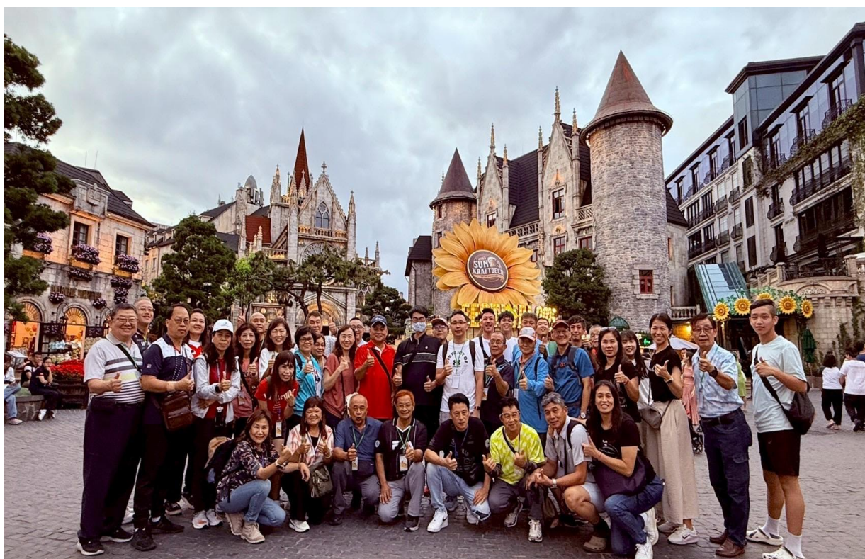
圖 10：團員於巴拿山上大合照