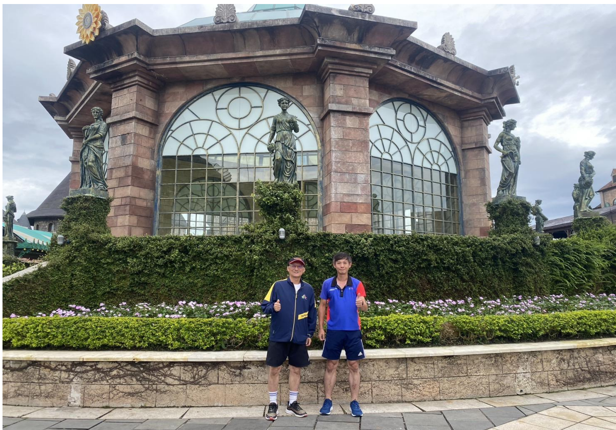
圖 9：巴拿山涼爽天氣適合運動推廣