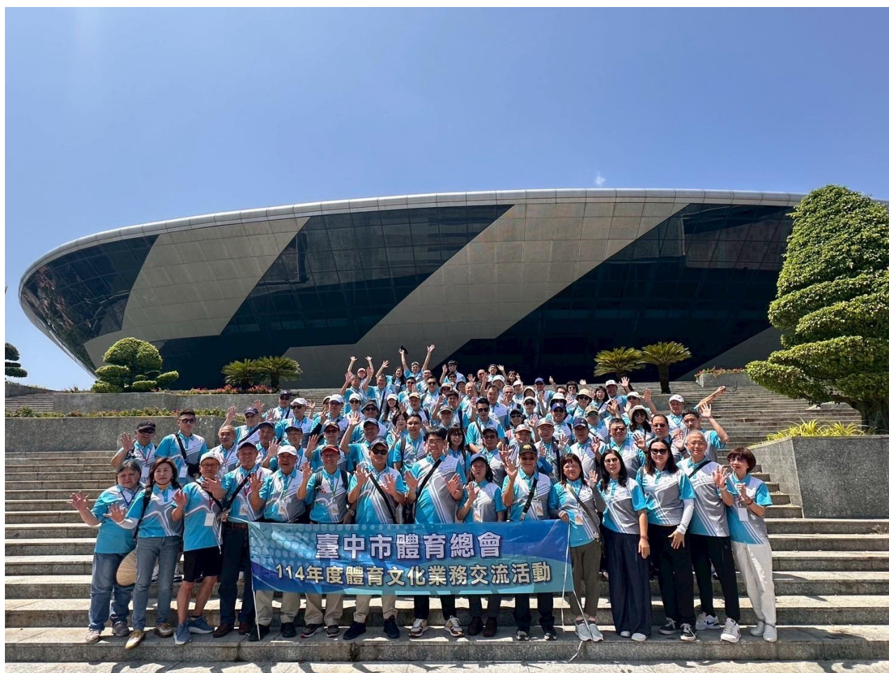
圖 22：越南峴港體育館前合影