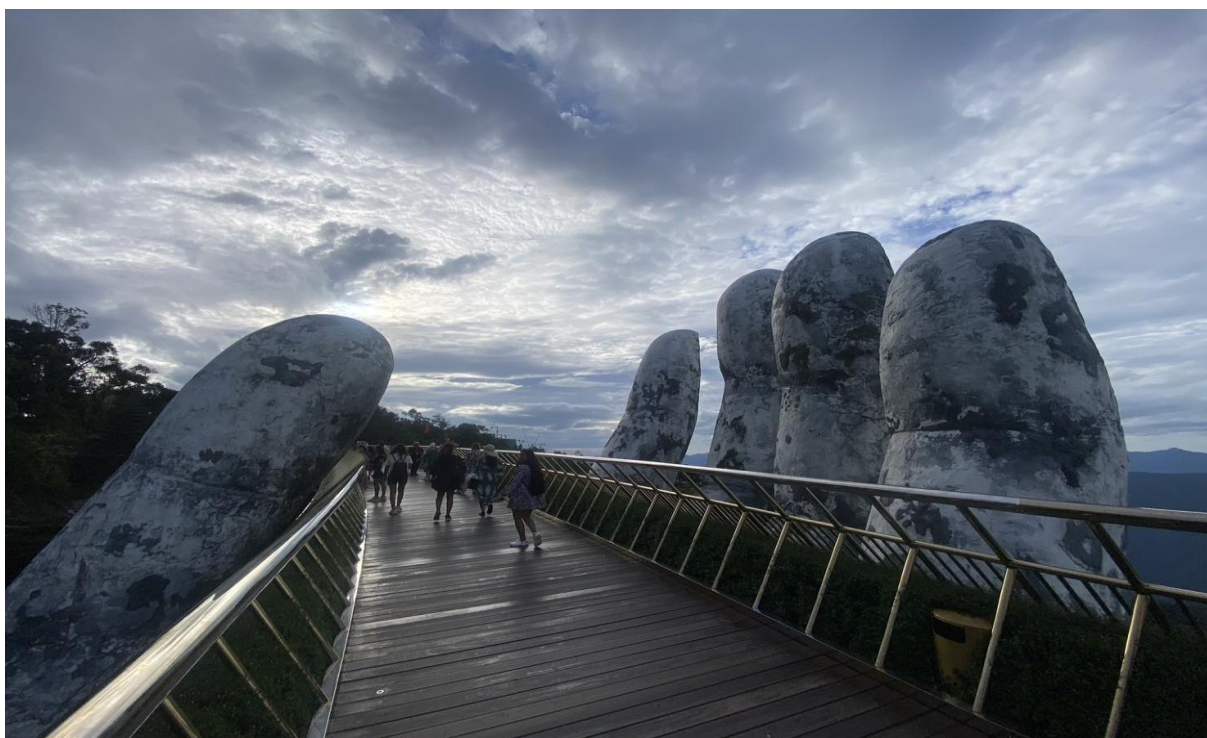
圖 12：清晨時刻走訪佛手橋