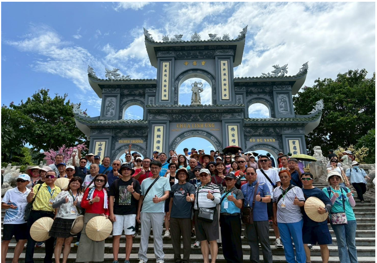
圖 14：團員於靈應寺前合影

靈應寺廟宇腹地寬廣，院內種有各種花草、盆景，四季花開不斷。寺廟的正殿中間供奉釋迦牟尼佛像，通往正殿的路兩旁是排列整齊的 18 尊羅漢佛像，均由白玉雕刻而成，佛像表情神態逼真，栩栩如生，呈現喜怒哀樂不同樣態的神情。除了欣賞越南的廟宇之美外，也可從山茶半島上遠眺美溪沙灘綿延的海岸線以及整座城市，視野遼闊，景色宜人。