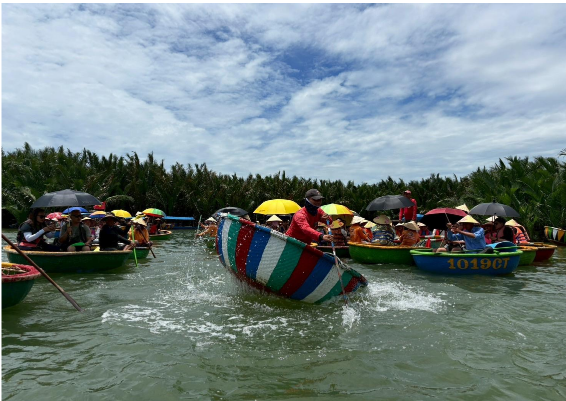
圖 3：峴港市迦南島碗公船高速旋轉表演