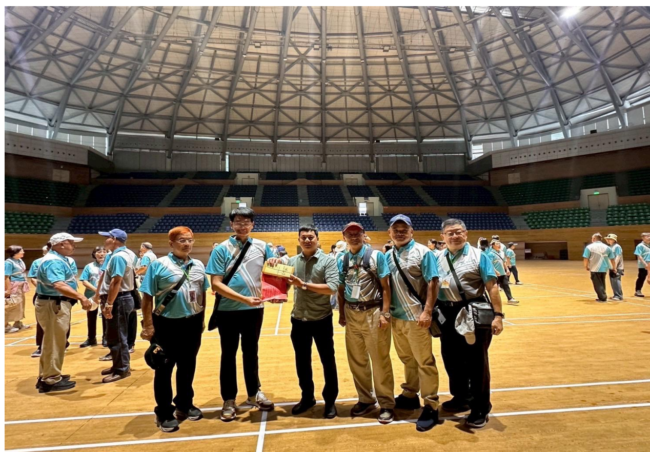
圖 23：與越南峴港體育館交流及分享運動經驗