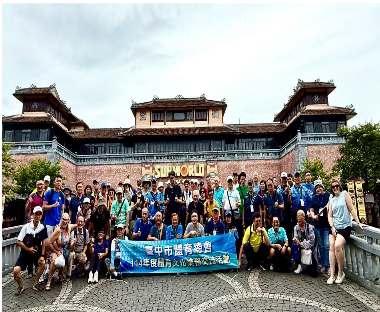
圖 11：巴拿山上行程導覽合影照

當日上午安排前往知名景點「日蝕廣場」等知名景點走訪，結合了藝術、光影和壯麗建築的廣場；不僅外觀非常壯觀，還經常有各種燈光秀和演出活動，另外「Le Jardin D' Amour 愛情花園」分成好幾個不同主題區域，結合四季變換和迷宮花園特色以及古典雕像和優雅的噴泉，相當適合透過知名景點推廣觀光及運動方向的結合；其中一個著名景點靈應寺為巴拿山上的一座著名寺廟，建築風格獨特，坐落於海拔約 1400 米的高地上。寺內最引人注目的就是高達 67 米的白色觀音像，不僅是宗教的象徵，更是所有拍照打卡的熱門地點。