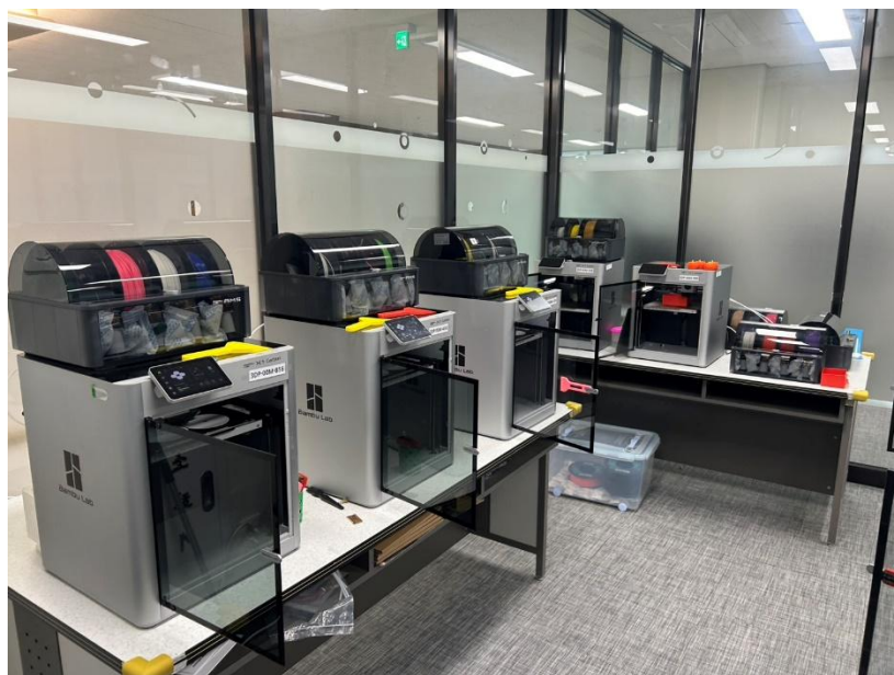
圖 16: 3D 列印設備