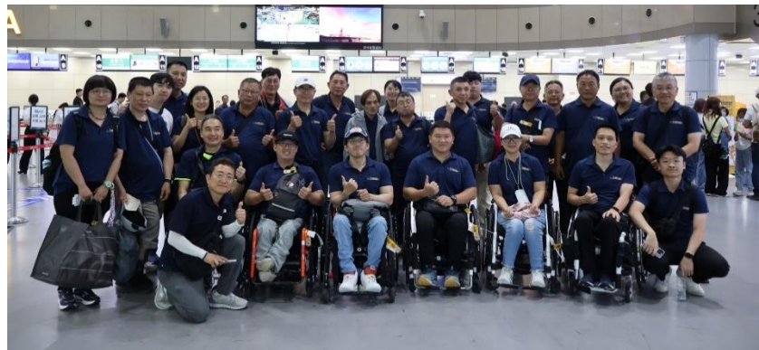
圖 24: 交流團於釜山金海國際機場合影

本次行程結束，由大邱身障體育會工作人員協助移動至釜山金海國際機場，於韓國時間晚間 9 時 05 分起飛，並在臺北時間晚間 10 時 25 分抵達。