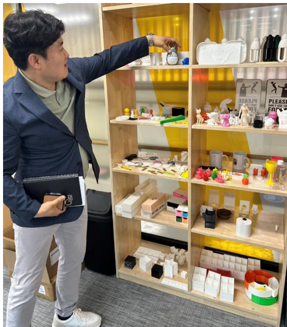
圖 15: 教務主任介紹學生工藝作品