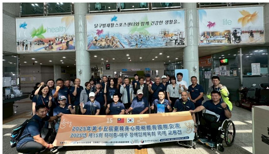
圖 21: 交流團於大邱達句伐康復體育中心合影

參訪期間，我們特別感受到中心不僅是身障者的復健據點，更是一般市民與身障者能共同運動、交流的開放場域。館內運動氛圍熱絡，自然而包容，真正落實了運動平權與社區融合的理念，令人印象深刻。