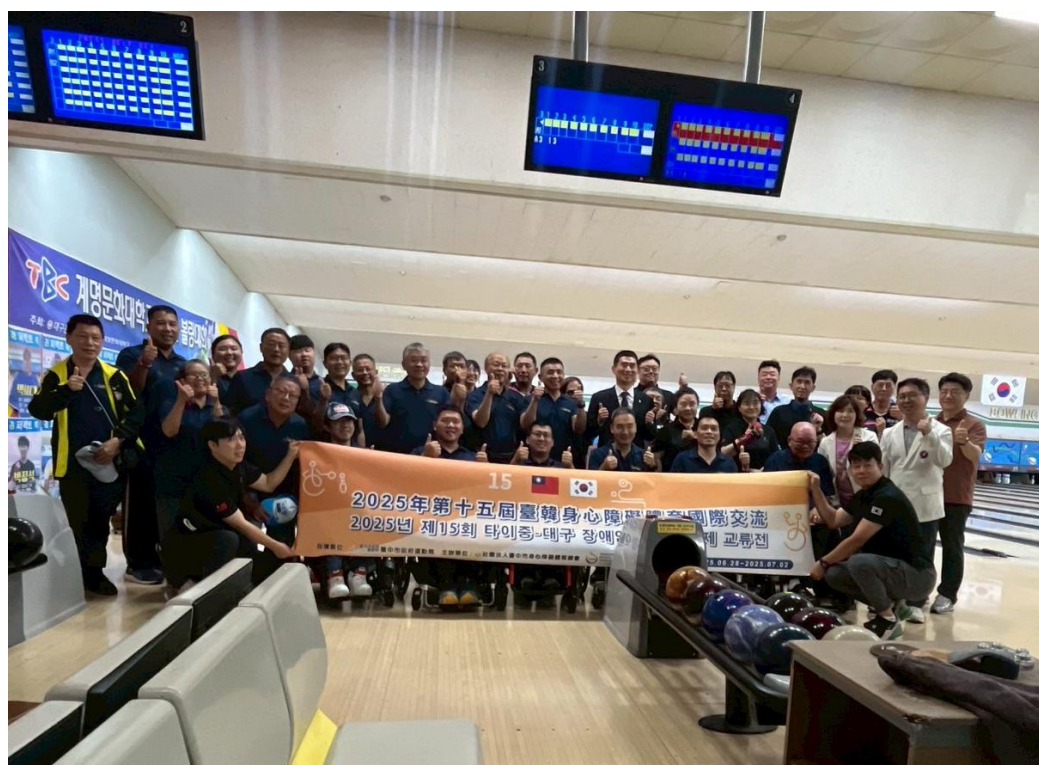
圖 9: 臺韓交流團於現代保齡球館合影