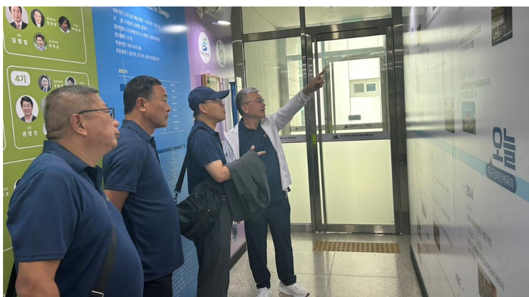
圖 3: 大邱市身心障礙國民運動中心一樓展示牆