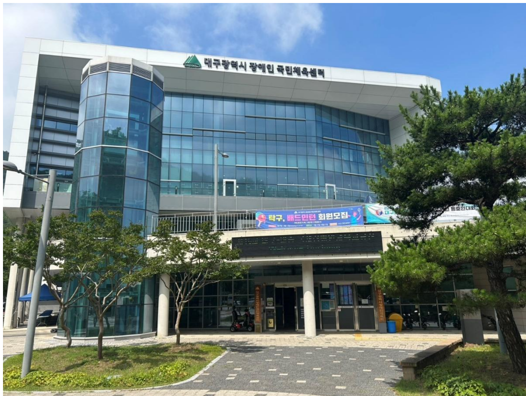
圖 2: 大邱市身心障礙國民運動中心

與開放式大廳（含咖啡休憩區）等；二樓設有會議室、更衣室、淋浴間、無障礙及一般廁所、倉儲空間；三樓為標準籃球場，並設有淋浴間與無障礙廁所；四樓為挑高設計之多功能體育館，另附有廣播音控管理室、籃球場與會議室等設施。