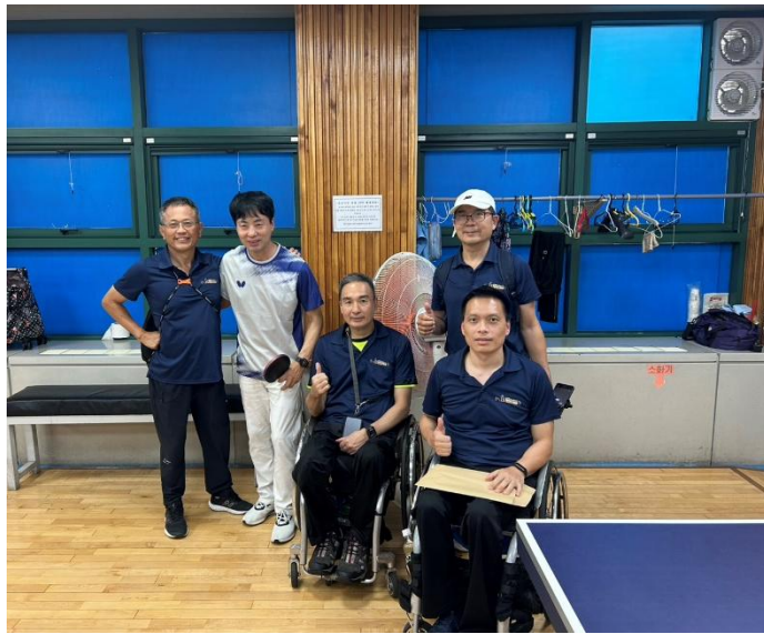
圖 22: 桌球隊與當地選手合影