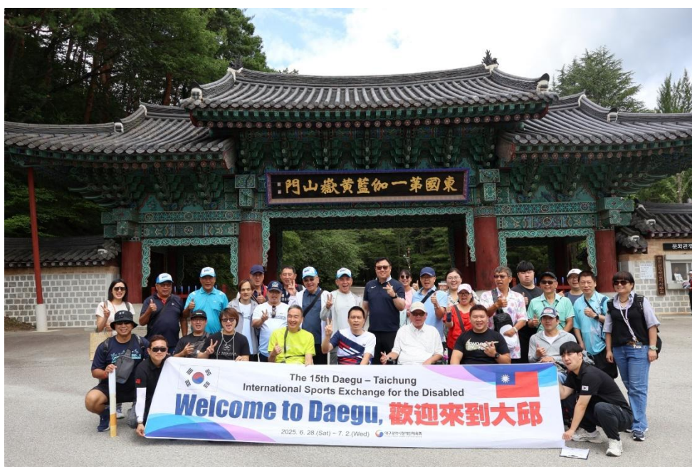
圖 17: 交流團於直指寺合影

寺內壁畫描繪佛陀說法、行者修行等場景，與山林自然交織出超越語言的靜謐氛圍，引領人們由外在風景進入內在心境，感受宗教藝術所蘊含的情感與智慧。此次實地參訪，讓我們從空間、圖像、歷史與語言等多重層面，深入理解韓國文化的根源，並體認文化傳承、宗教空間與精神價值的緊密關聯。跨文化的理解與對話，不僅深化國際交流，也為社會共融搭建起重要橋梁。