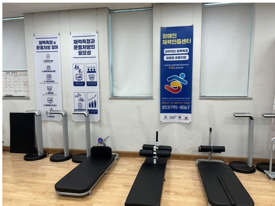
圖 6: 身障者專用體適能器材