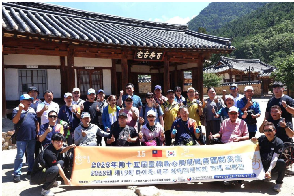
圖 11: 交流團於漆谷村合影

與一般觀光造景村不同，漆谷村迄今仍為實際居住型村落，居民的日常生活與自然環境共融共生，使村落保有鮮活的人文紋理與生活樣貌。其融合自然地理、歷史記憶與宗族文化的聚落型態，展現韓國傳統村落的空間實踐，也對理解風水文化與地方再生發展，具有高度參考與研究價值。