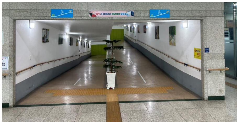
圖 23: 大邱達句伐康復體育中心無障礙坡道