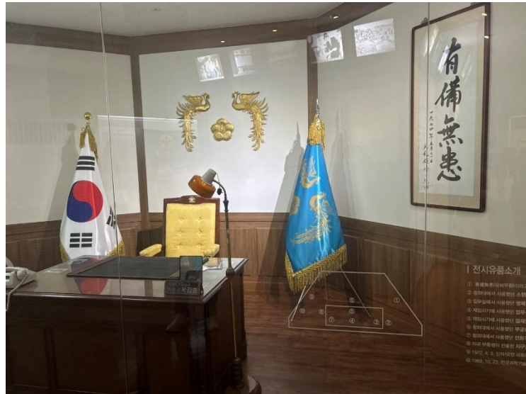
圖 18: 朴正熙總統時任辦公室

朴正熙總統於1961年主導軍事政變後執政長達18年，對韓國經濟發展、現代化建設與國家體制改革均有深遠影響，惟亦伴隨威權統治與民主受限之爭議。其故居作為一處歷史記憶場域，保存近代重要政治人物的成長軌跡，亦提供後世反思國家發展與民主進程之寶貴素材，具有高度文化與教育價值。