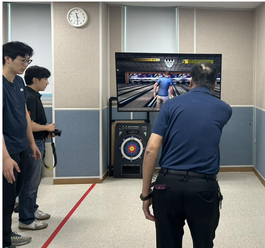
圖 7:選手體驗虛擬保齡球運動

障者享有五成費用減免。原先提供視障桌球訓練的空間也已重新規劃為防 隔音的虛擬運動體驗區，充分展現彈性管理與資源整合能力。