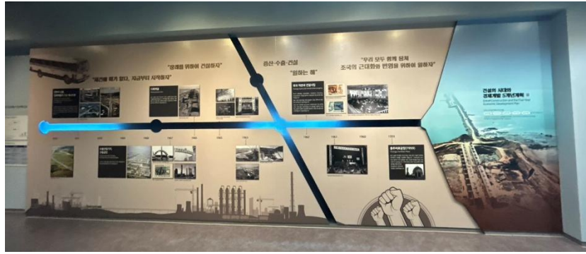
圖 19: 新村運動歷史沿革