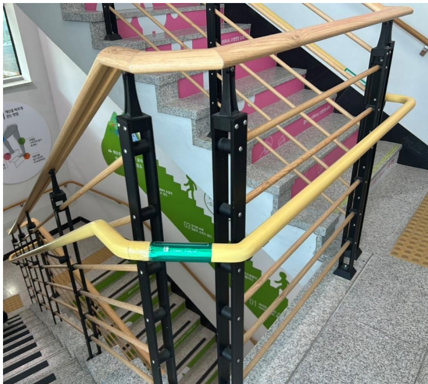
圖 4: 大邱市身心障礙國民運動中心樓梯間點盲裝置

整體建築設計強調共融性與實用性，考量身心障礙者進出便利性，設有圓形無障礙專用電梯，直通各樓層；出入口皆設置斜坡道，方便輪椅通行。樓梯間亦設置點盲裝置，協助視障者辨位。館內空間明亮，動線規劃順暢，展現無障礙與共融空間的設計理念。