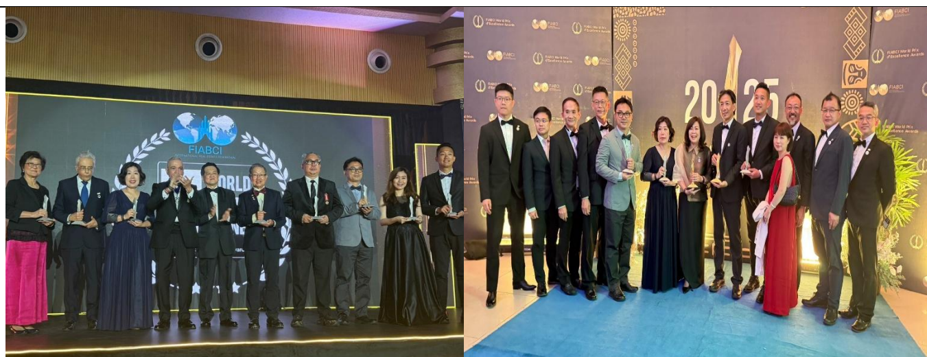
卓越建設獎頒獎典禮