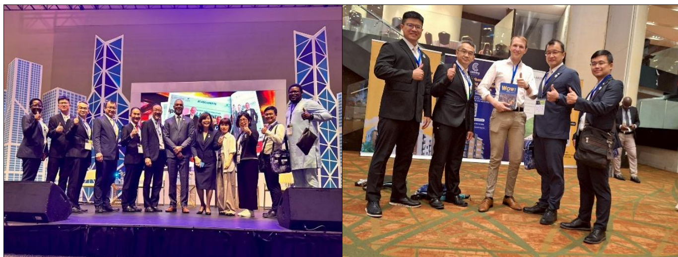
代表團與國際成員代表交流情形

此外，與會團隊亦善用會議空檔，向其他國家與分會代表進行不動產相關議題交流，同時推薦臺中市觀光資源（新聞局及觀旅局提供之中英文文宣），提升城市國際曝光度。議程雖密集，但涵蓋面向廣泛，從住宅政策到開發實務、再至科技應用皆有深入探討，透過論壇與跨國交流，均獲益良多。