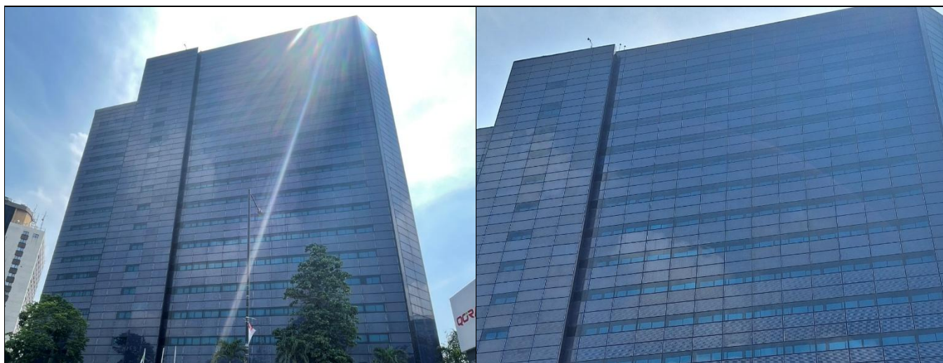
銀行大廈太陽能板外觀