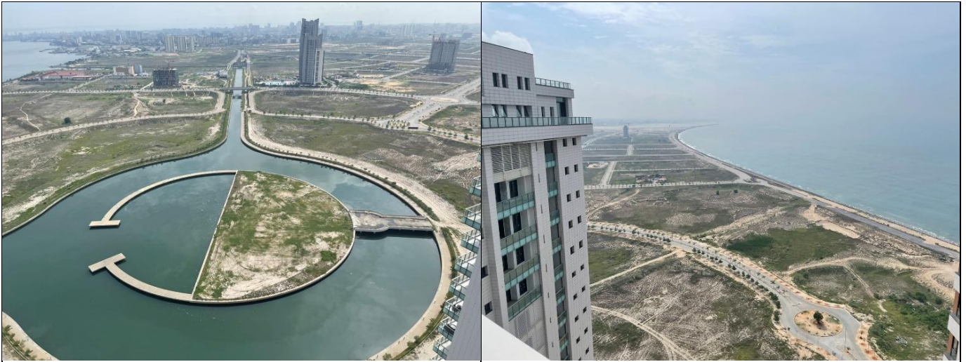
亞特蘭提克市俯瞰圖

據稱可有效抵禦百年一遇的風暴潮與海平面上升，並解決海岸侵蝕與洪水威脅。同時，該計畫亦結合商業與住宅區開發，呈現「防災工程 × 都市開發」的創新模式，兼具防災與城市發展的雙重功能，期能成為全球韌性城市的代表案例。