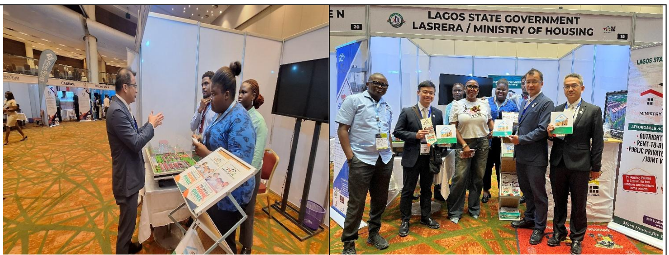
代表團與奈及利亞住宅及經濟發展部門互動

會議期間，與會團隊把握交流機會，與奈及利亞拉哥斯州住宅及經濟發展部門進行雙邊互動，就該州住宅政策、公共住宅推動策略，以及重點開發計畫如 Lekki 港口經貿園區等主題交換意見，互動熱絡。